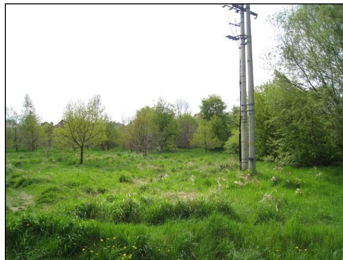
Fot. 7 Nieużytki w dolinie Gostyni, część północno-wschodnia