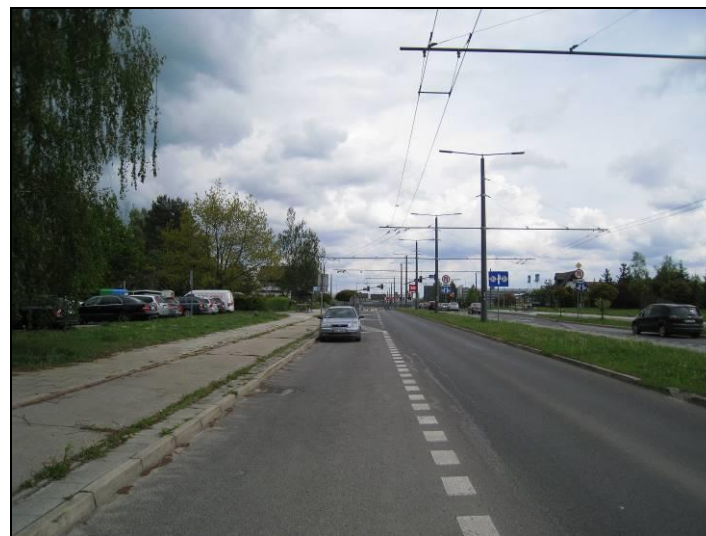
Fot. 11 ul. W. Sikorskiego w południowej części obszaru