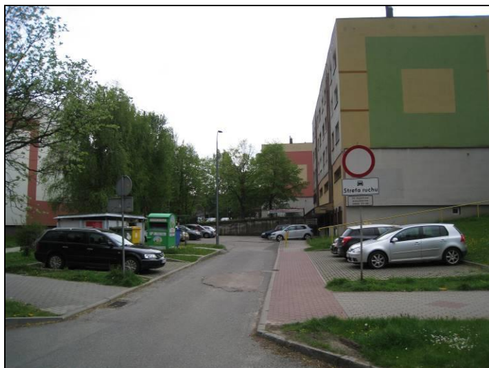
Fot. 9 Jak powyżej