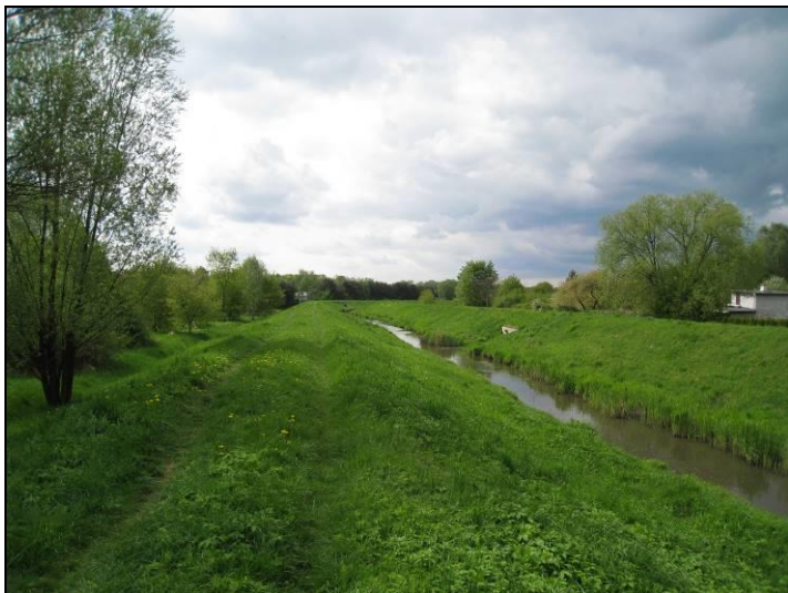
Fot. 1 Dolina Gostyni, widok z wałów przeciwpowodziowych