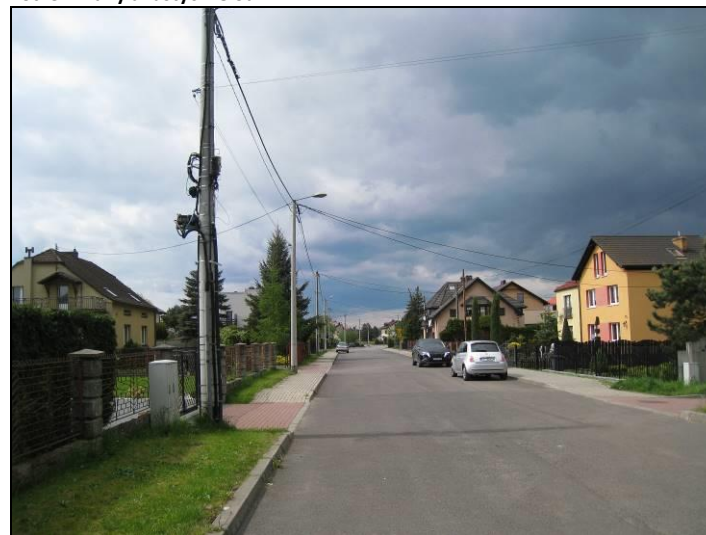
Fot. 4 Zabudowa mieszkaniowa w rejonie ul. J. Targiela