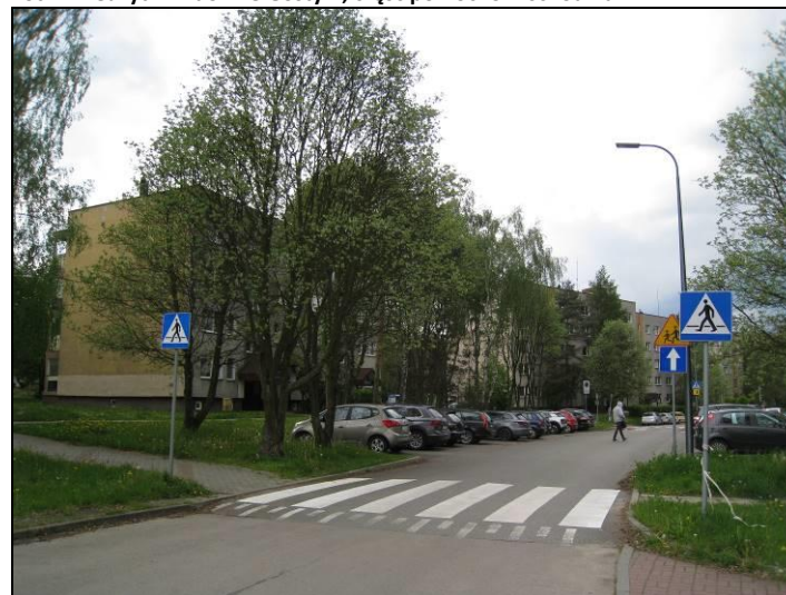
Fot. 8 Zabudowa wielorodzinna w rejonie ul. A. Zgrzebnicka