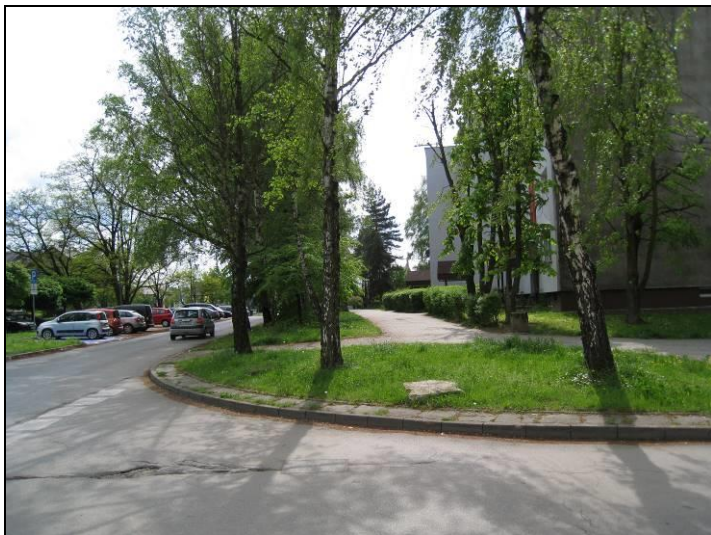
Fot. 13 Zabudowa w rejonie ul. S. Żółkiewskiego