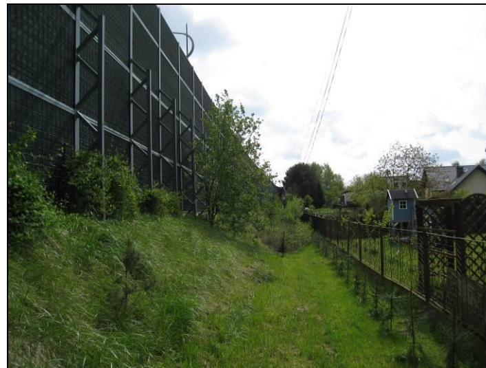
Fot. 3 Ekran akustyczny od DK1