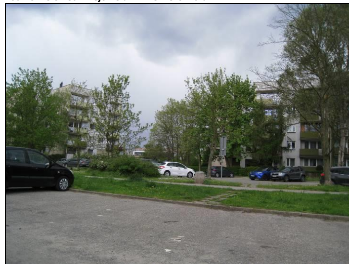
Fot. 16 Zieleniec w rejonie ul. R. Zaręby