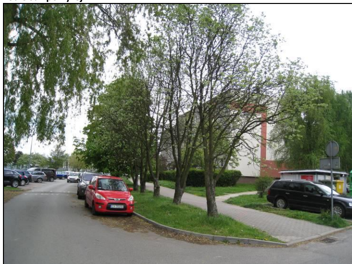
Fot. 10 Zabudowa w rejonie ul. R. Zaręby