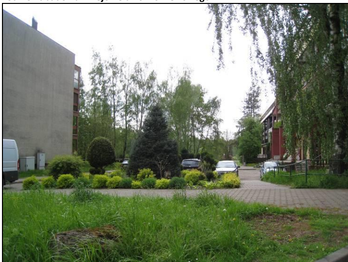
Fot. 14 Zieleniec w rejonie ul. R. Zaręby