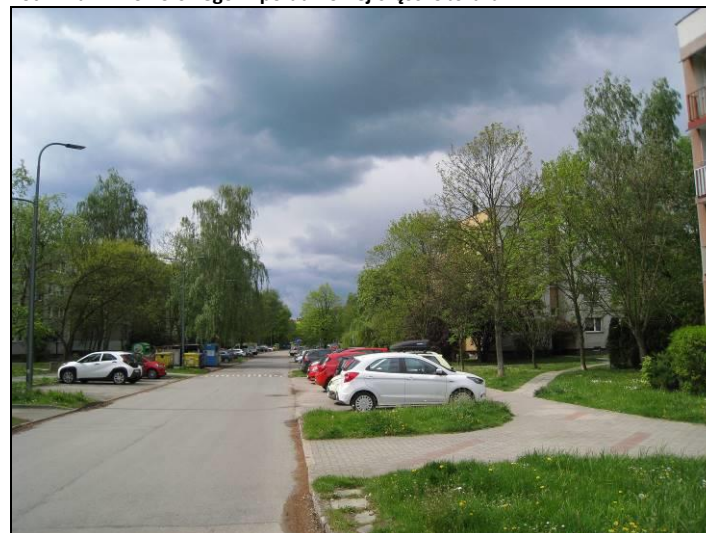
Fot. 12 Zabudowa w rejonie ul. G. Zapolskiej