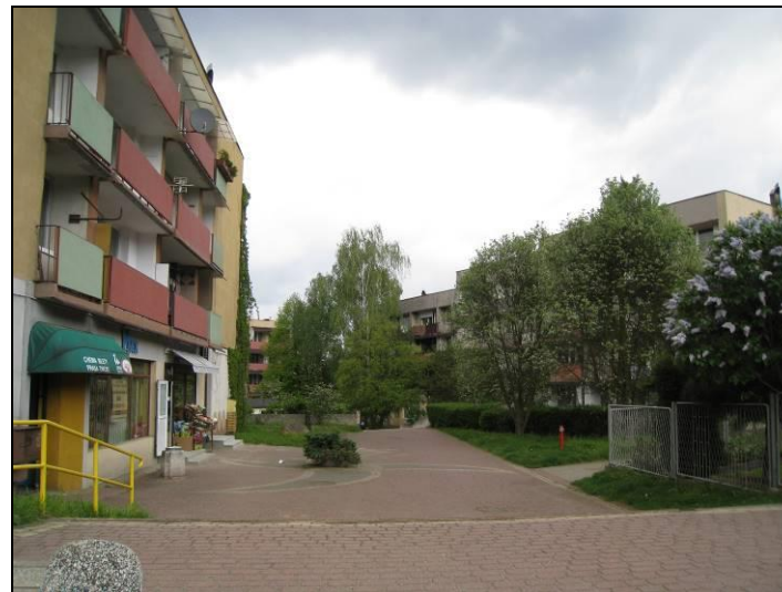
Fot. 15 Zieleniec w rejonie ul. A. Zelwerowicza