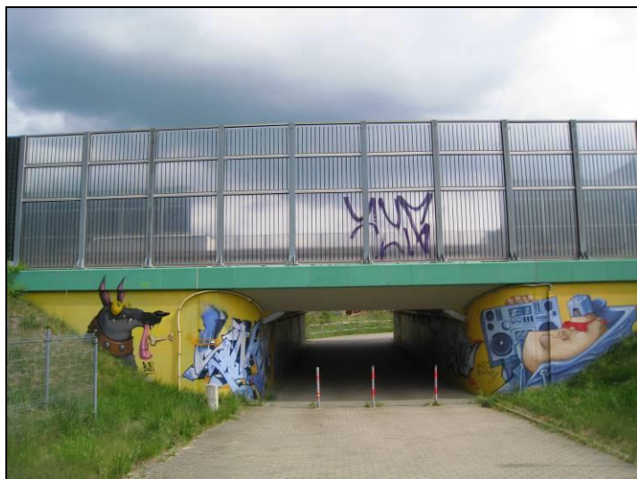
Fot. 5 Przejazd dla rowerów na północ od ul. J. Targiela