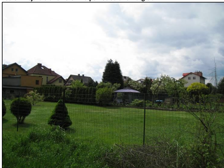
Fot. 6 Duże powierzchnie przydomowych ogrodów na zapleczu zabudowy jednorodzinnej w dolinie Gostyni