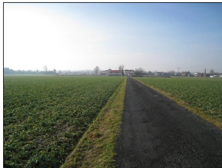
Fot. 3 Grunty orne w zachodniej części terenu