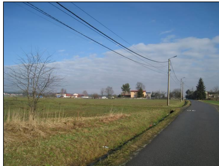
Fot. 7 Południowo-wschodnia część terenu