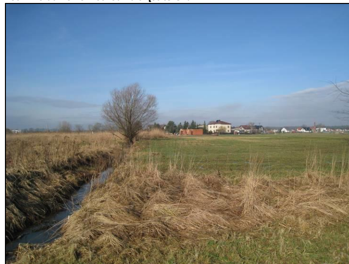
Fot. 8 Rów melioracyjny w części wschodniej terenu