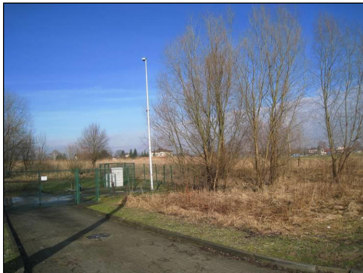
Fot. 9 Południowo-wschodnia część terenu, rejon przepompowni ścieków