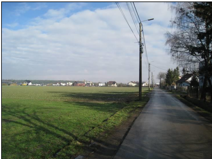
Fot. 5 Ul. Jaskrów, wschodnia część terenu, widok w kierunku północnym