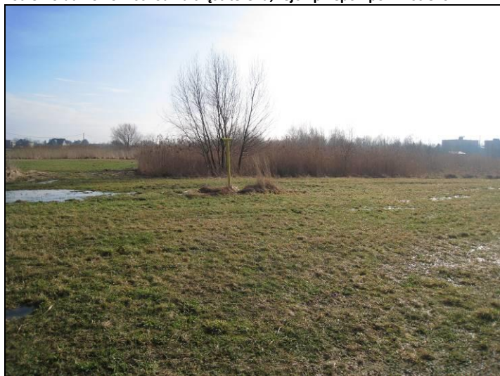
Fot. 10 Południowo-zachodnia część terenu