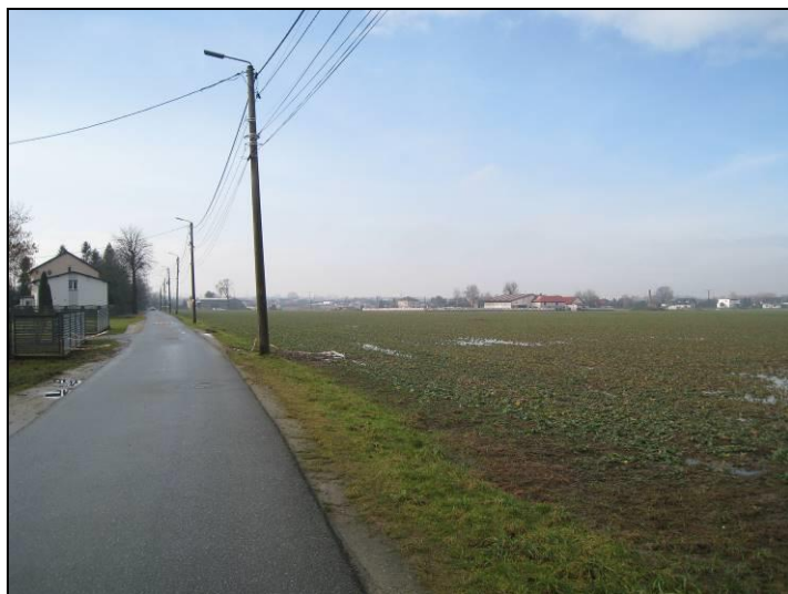
Fot. 1 Rejon ul. Jaskrów, wschodnia granica terenu, widok w kierunku południowym