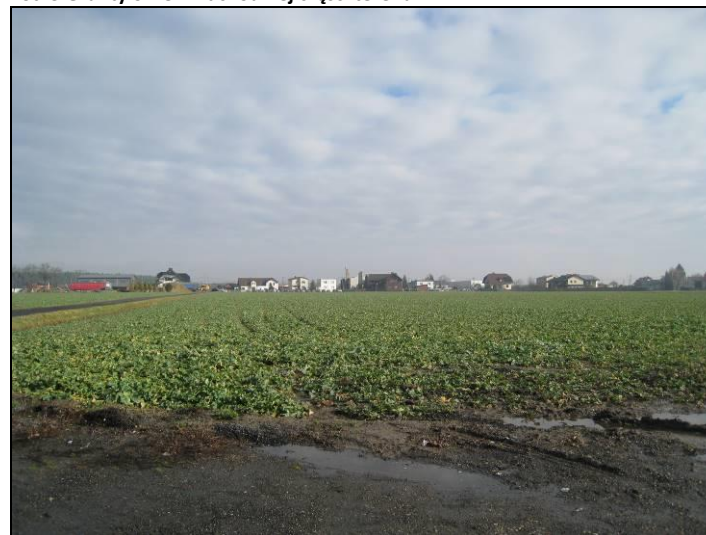
Fot. 4 Grunty orne w zachodniej części terenu