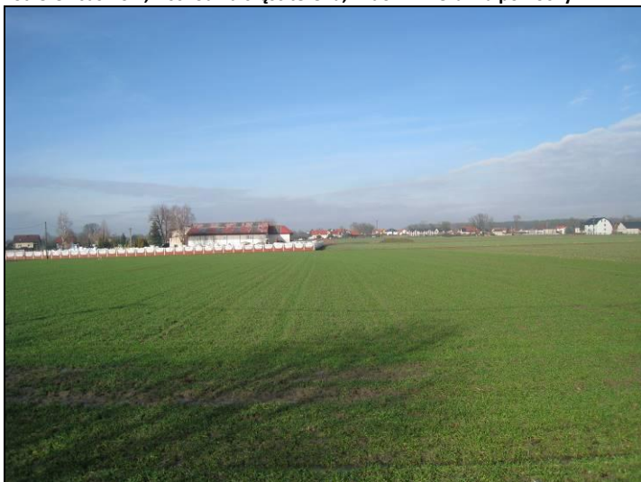
Fot. 6 Tereny rolne, widok od strony ul. Jaskrów, widoczny sklep z kamieniem ogrodowym