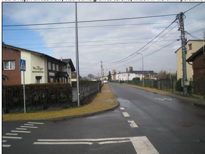
Fot. 2 Ul. Dzwonkowa, północna granica terenu