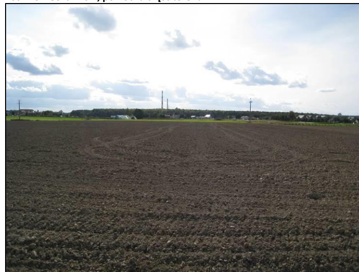
Fot. 8 Widok na centralną część terenu od strony ul. Zimowej