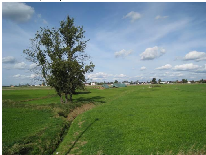
Fot. 10 Rów w południowej części obszaru, widok z ul. Oświęcimskiej