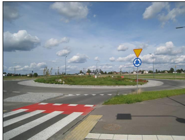
Fot. 3 Nowo wybudowane rondo na zachód od analizowanego terenu