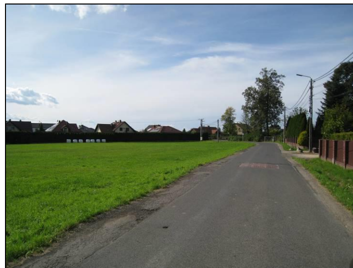
Fot. 7 Ul. Goździków, północna część terenu