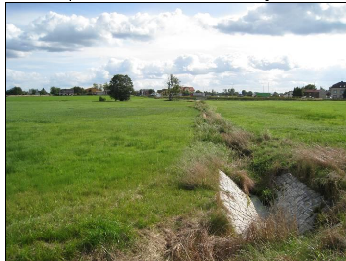
Fot. 4 Rów w części zachodniej terenu