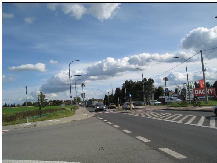
Fot. 5 Ul. Oświęcimska, widok w kierunku wschodnim