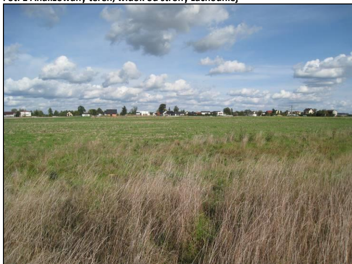
Fot. 2 Północno-zachodnia część analizowanego terenu