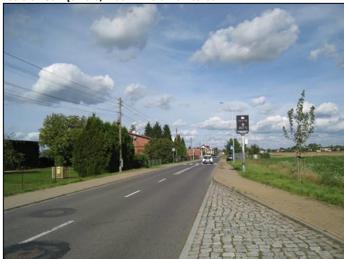
Fot. 6 Ul. Długa, widok w kierunku północnym