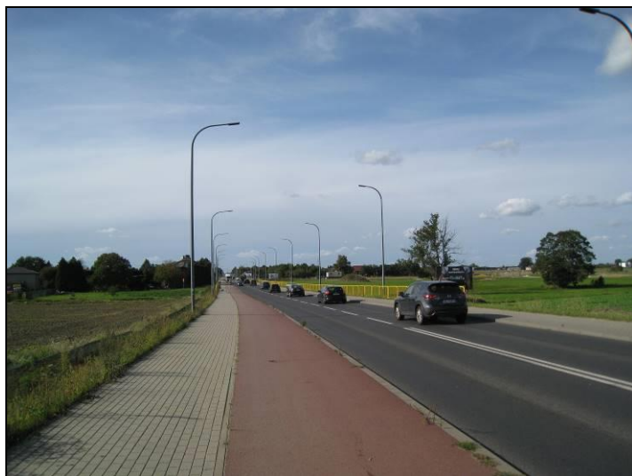
Fot. 9 Ul. Oświęcimska, widok w kierunku zachodnim