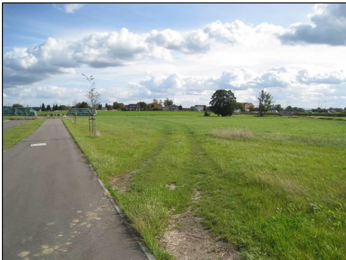
Fot. 1 Analizowany teren, widok od strony zachodniej