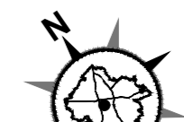
skala 1 : 1000