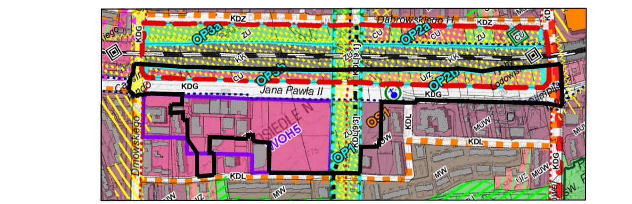
WYRSZECZ "STUDIUM UWARUNKOWAŃ I KIERUNKÓW ZAGOSPODAROWANIA PRZESTRZENNEGO MIASTA TYCHY" ZATWIERDZONEGO UCHWAŁĄ NR 00010/00010 RADY MIASTA TYCHY Z DNIA 10 GRUDNIA 2008 R. W ZAKRESIE 2M