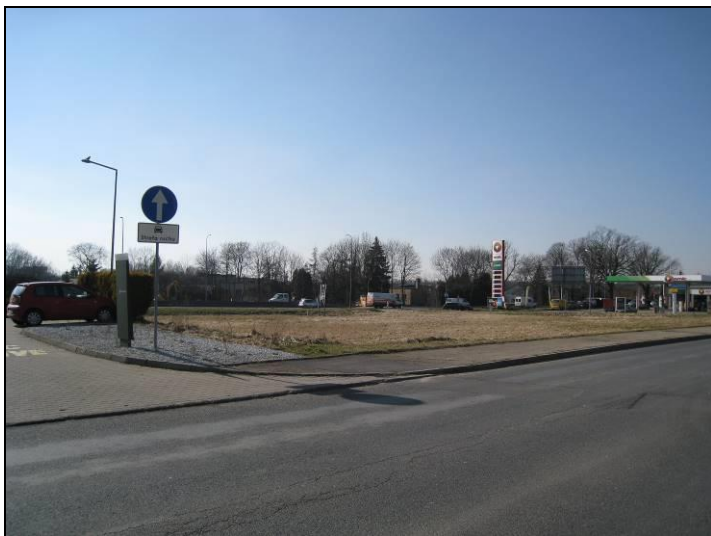
Fot. 1 Teren pomiędzy stacją paliw a restauracją McDonalds