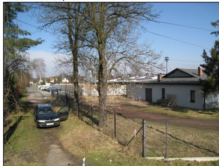
Fot. 4 Południowa część rejonu ul. Krótkiej