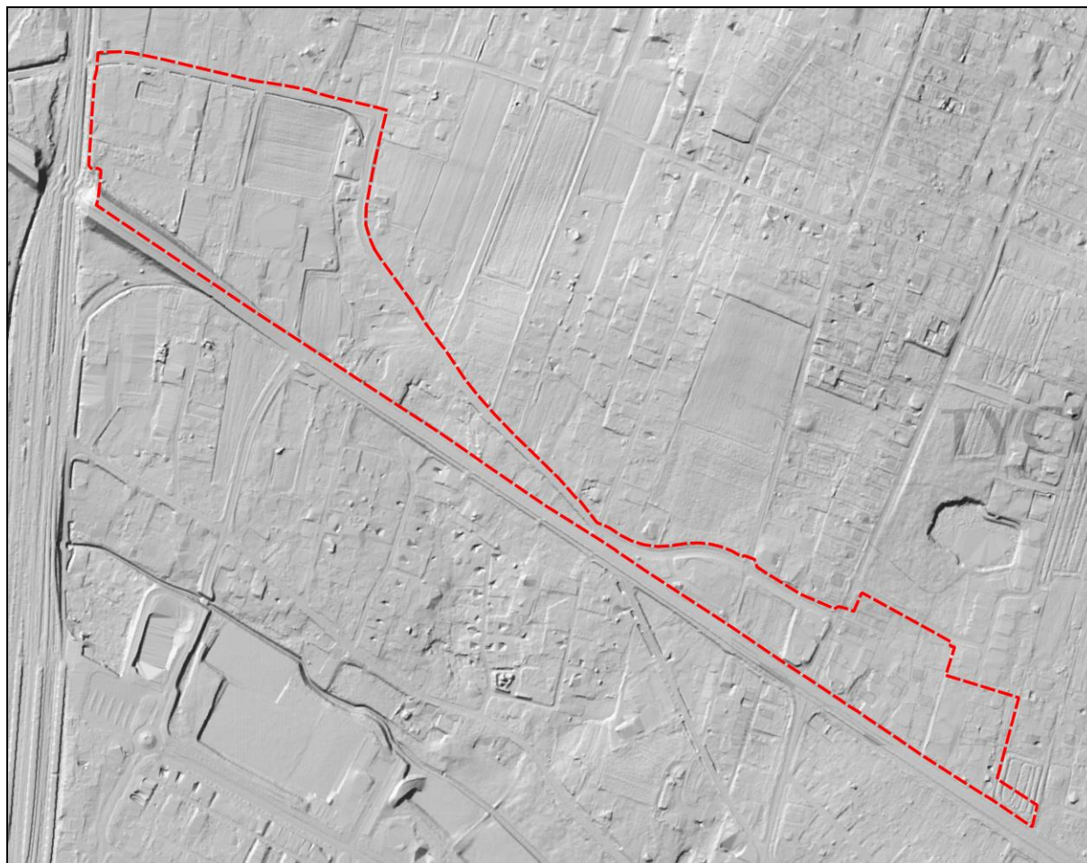
Rysunek 1 Ukształtowanie terenu na podstawie Numerycznego Modelu Terenu