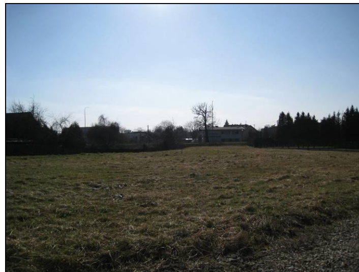
Fot. 7 Dawny teren rolny pomiędzy ul. Mąkołowską i ul. Mikołowską