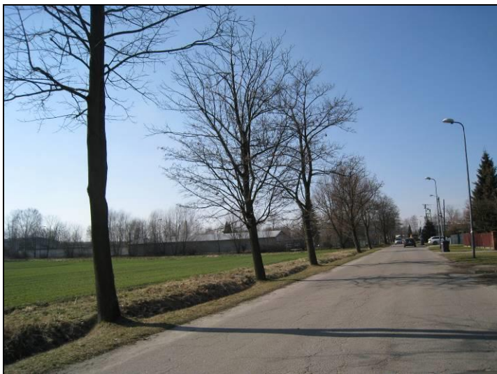
Fot. 5 Ul. Krótka, widok w kierunku południowo-wschodnim