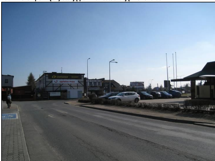
Fot. 2 Rejon połączenia ul. Skowronków i ul. Dołowej