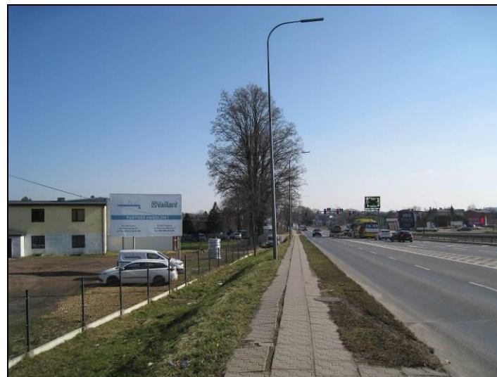
Fot. 3 Ul. Mikołowska, widok w kierunku wschodnim