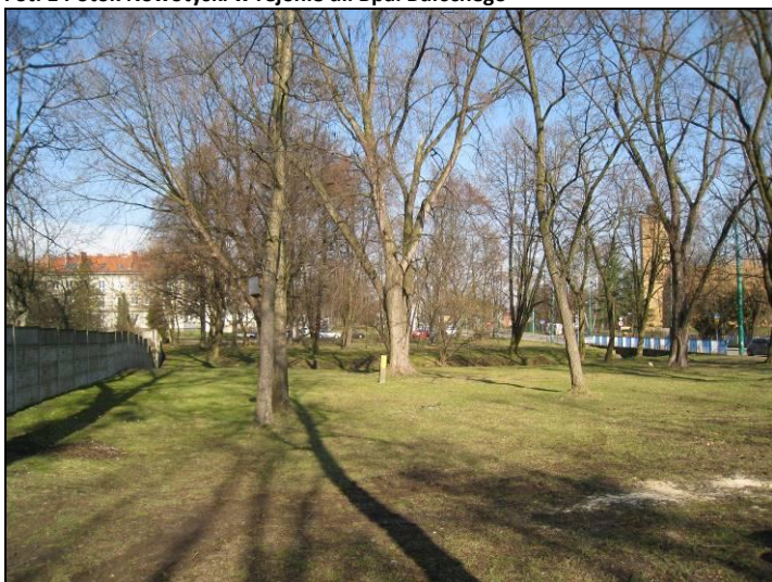
Fot. 2 Skwer pomiędzy ROD i ul. Bpa Burschego