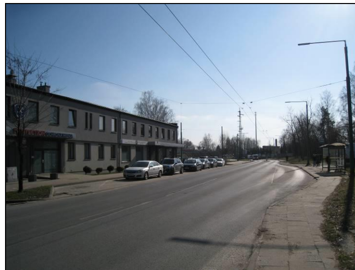
Fot. 11 Zabudowa usługowa w części zachodniej terenu