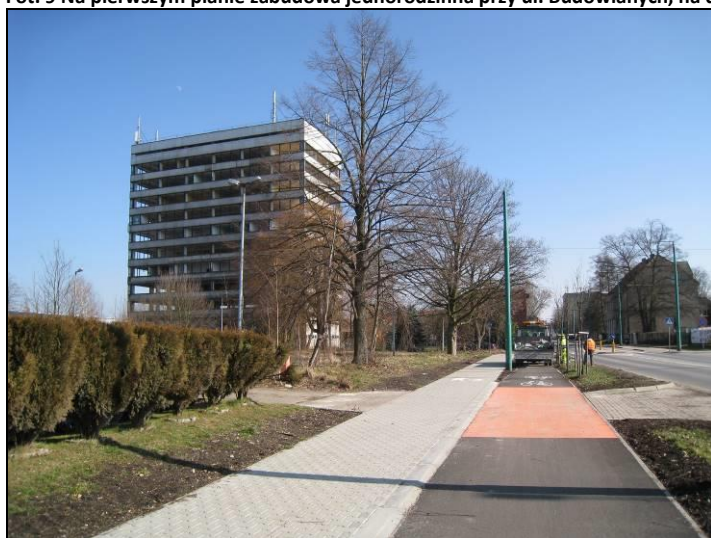
Fot. 10 Opustoszały wieżowiec widziany od strony zachodniej