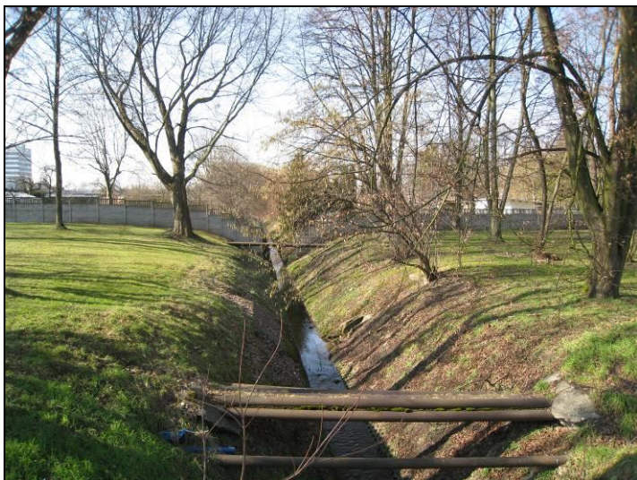
Fot. 1 Potok Nowotyski w rejonie ul. Bpa. Burschego