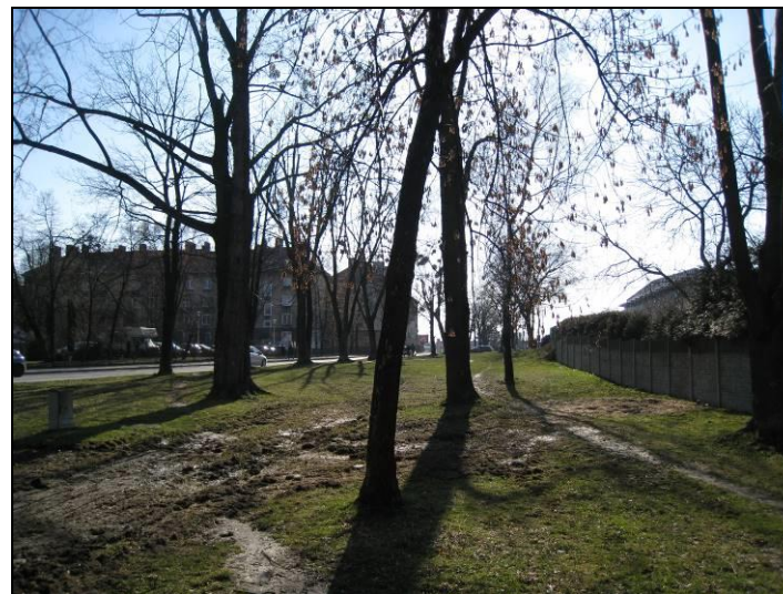
Fot. 3 Skwer pomiędzy ROD i ul. Bpa Burschego