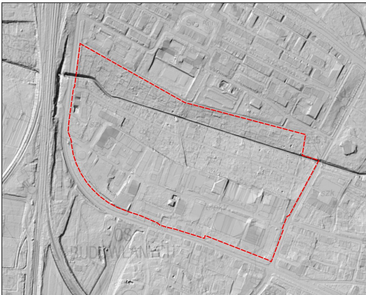
Rysunek 1 Ukształtowanie terenu na podstawie Numerycznego Modelu Terenu