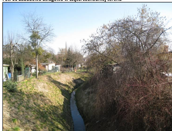
Fot. 12 Potok Nowotyski widziany z ul. Budowlanych