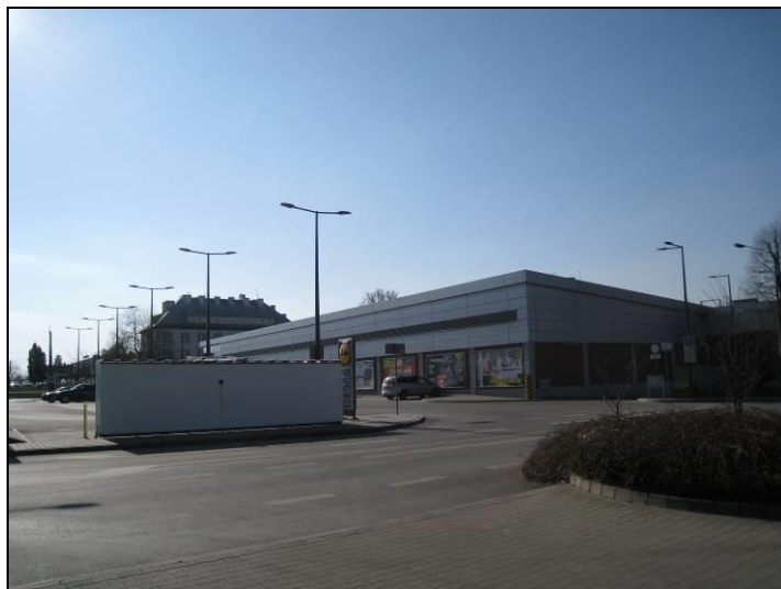
Fot. 5 Dyskont handlowy w części południowo-zachodniej