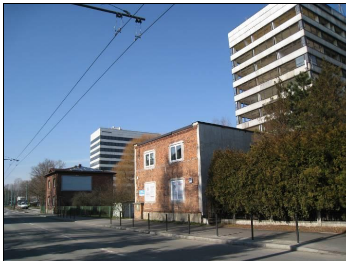
Fot. 9 Na pierwszym planie zabudowa jednorodzinna przy ul. Budowlanych, na drugim dwa wieżowce