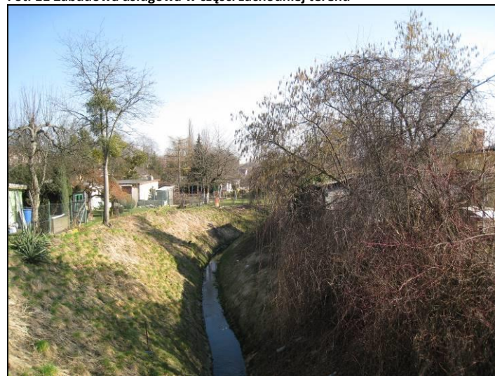
Fot. 12 Potok Nowotyski widziany z ul. Budowlanych