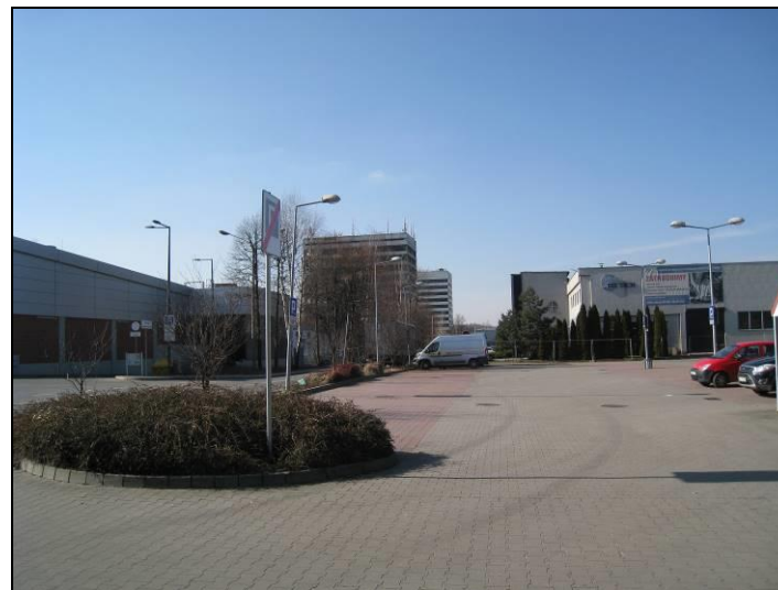
Fot. 7 Widok w kierunku dwóch wieżowców od strony ul. Bpa. Burschego