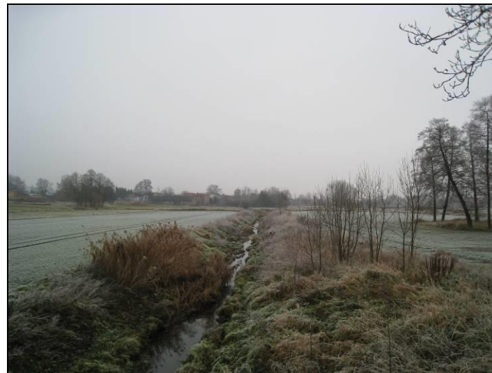
Fot. 3 Potok Tyski widziany z ul. Urbanowickiej