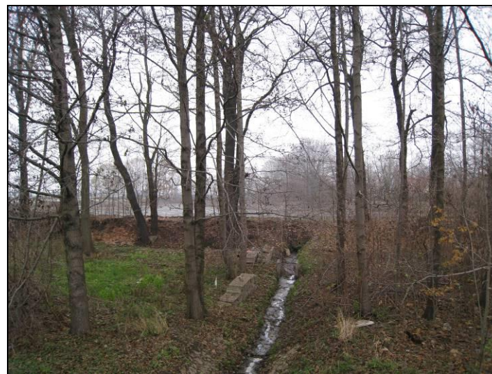
Fot. 11 Koryto cieką stanowiącego dopływ Potoku Tyskiego na północ od ul. Oświęcimskiej