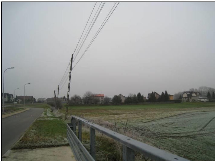
Fot. 1 Ul. Urbanowicka, zachodnia część terenu