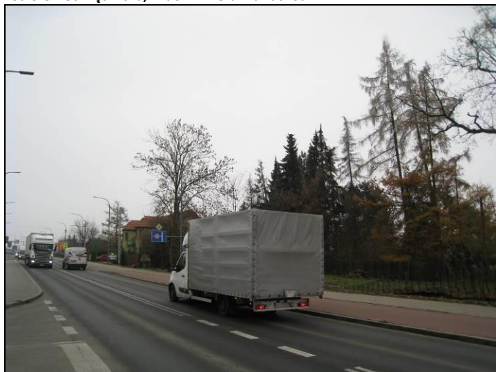
Fot. 10 Ul. Oświęcimska, widok w kierunku wschodnim