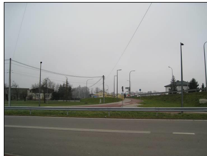
Fot. 7 Północno-wschodnia część terenu