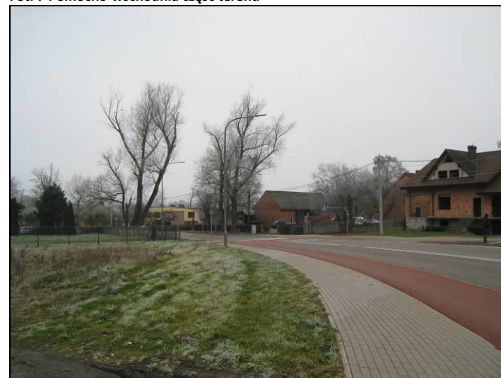
Fot. 8 Ul. Główna w części północno-wschodniej terenu