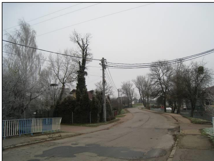
Fot. 5 Ul. Główna, wschodnia część terenu