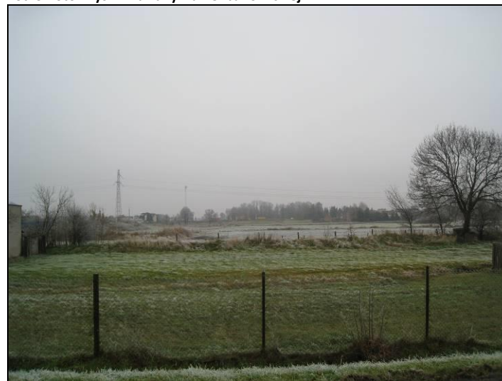
Fot. 4 Analizowany teren (na drugim planie) widziany od strony południowo-zachodniej od strony ul. Głównej