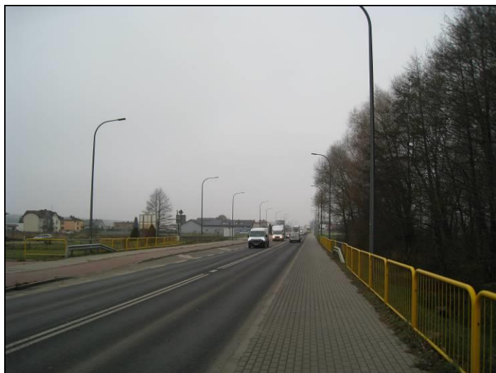
Fot. 9 Ul. Oświęcimska, widok w kierunku zachodnim