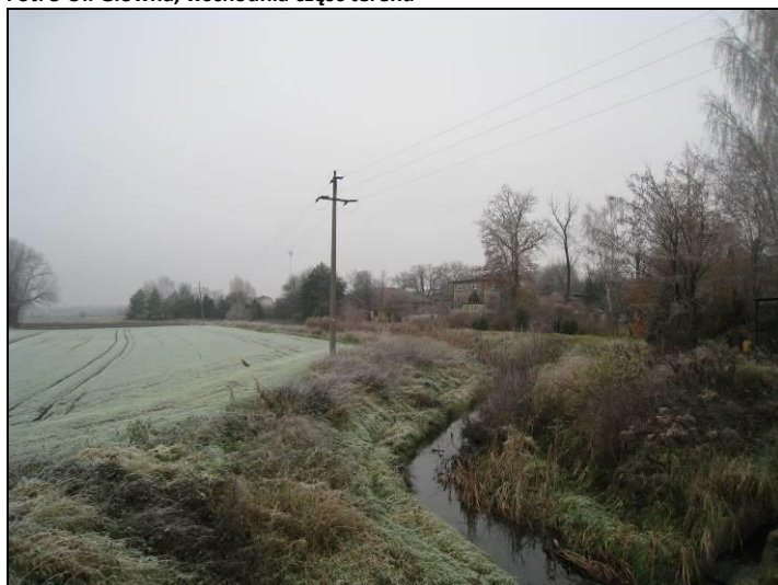
Fot. 6 Potok Tyski widziany z ul. Głównej