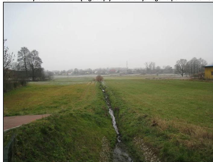
Fot. 12 Widok na ciek dopływający do Potoku Tyskiego z ul. Oświęcimskiej