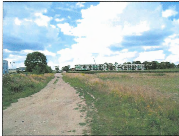
Fot. 11 Tereny rolne w północno-zachodniej części terenu, widok w kierunku zachodnim