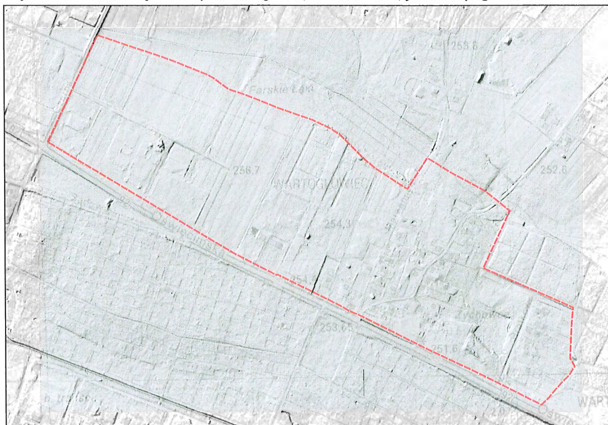
Rysunek 1 Ukształtowanie analizowanego terenu na podstawie Numerycznego Modelu Terenu

Analizowany teren położony jest na rozległym wyniesieniu wysoczyzny morenowej usytuowanym pomiędzy dolinami Mlecznej i Potoku Tyskiego. Teren jest generalnie płaski, rzędne wynoszą ok. 248 - 256 m n.p.m., powierzchnia opada nieznacznie w kierunku wschodnim, co jednak w terenie jest praktycznie niezauważalne. Nie występują tu jakiegokolwiek znaczące formy morfologiczne, tak naturalne, jak antropogeniczne.