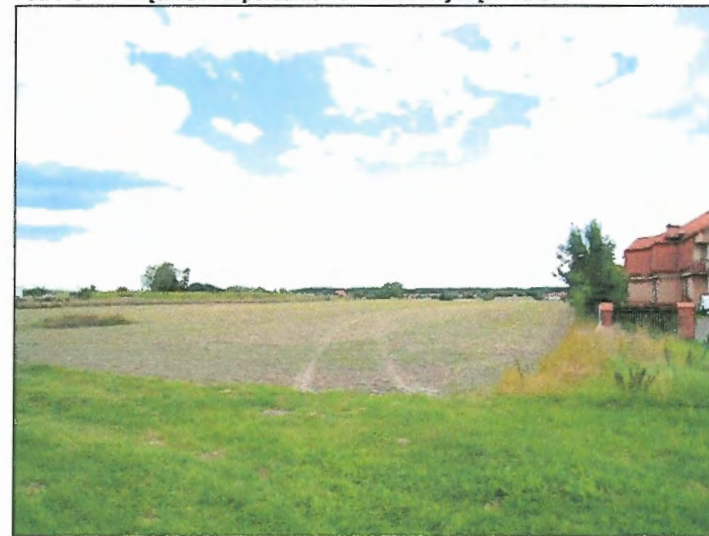
Fot. 8 Teren rolne w południowo-zachodniej części terenu