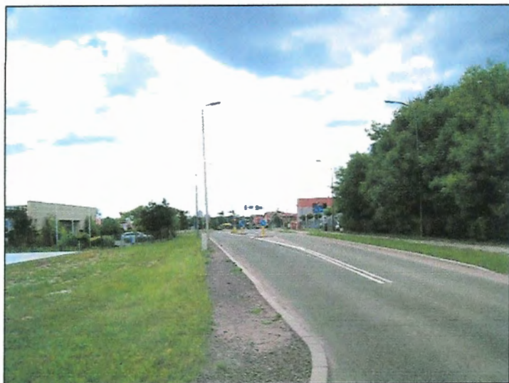
Fot. 9 Ul. Czarna, zachodnia część terenu