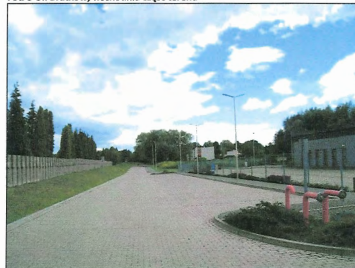
Fot. 4 Ul. Bratków, po stronie południowej Sala Królestwa Świadków Jehowy