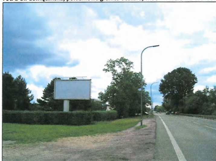
Fot. 2 Ul. Oświęcimska, południowa granica obszaru, widok w kierunku wschodnim