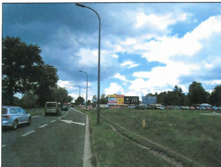
Fot. 1 Ul. Oświęcimska, południowa granica obszaru, widok w kierunku zachodnim