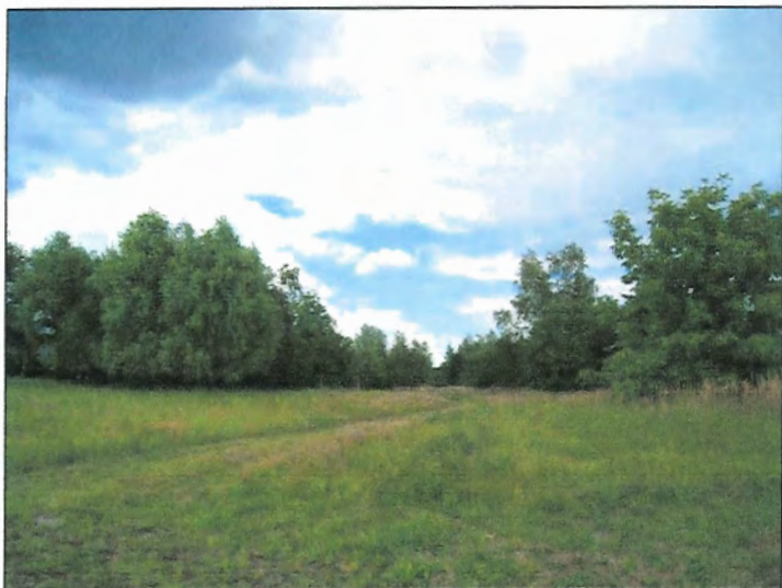
Fot. 5 Nieużytki pomiędzy ul. Jaskrów a terenem cmentarza