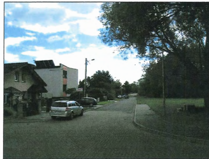
Fot. 3 Ul. Bratków, wschodnia część terenu