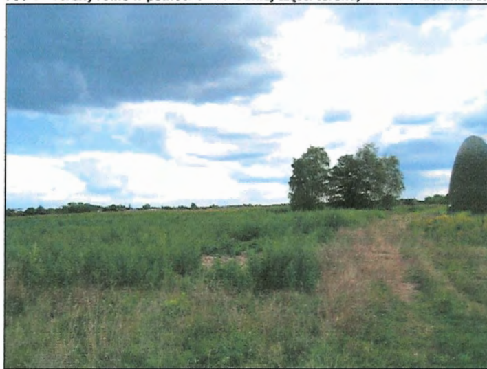
Fot. 12 Tereny rolne w północno-zachodniej części terenu, widok w kierunku wschodnim