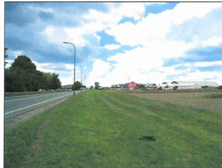
Fot. 7 Ul. Oświęcimska w południowo-zachodniej części terenu