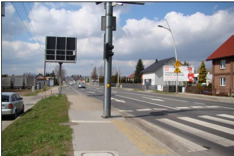
Fot. 13 Ul. Mikołowska, widok z północno-wschodniej części obszaru