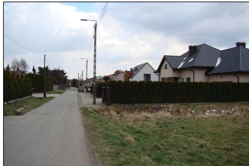
Fot. 3 Ul. Wiejska w zachodniej części terenu