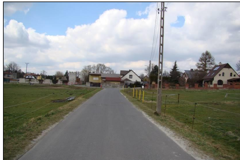
Fot. 7 Ul. Wiejska w centralnej części obszaru, na północ teren MN4, na południe teren poza mpzp