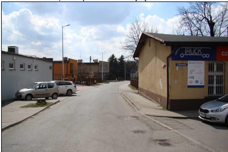
Fot. 14 Ul. Leśna, wschodnia granica terenu