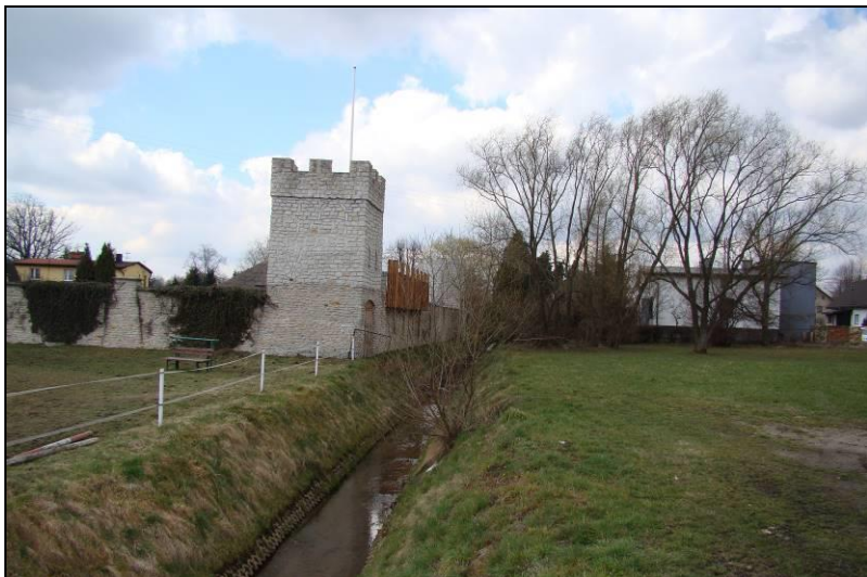
Fot. 5 Potok Tyski w centralnej części obszaru, na północ od Potoku Tyskiego teren ZP2