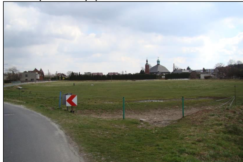
Fot. 4 Wybieg dla koni na południe od ul. Wiejskiej, poza południową granicą obszaru