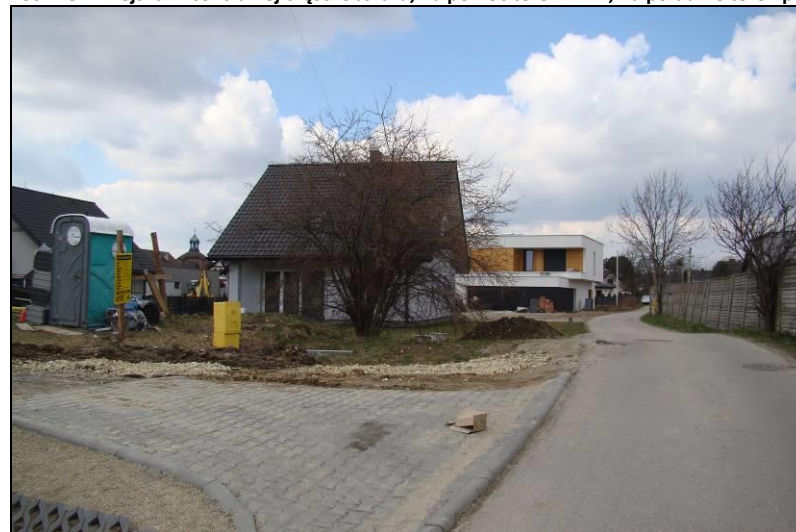
Fot. 8 Nowa zabudowa we wschodniej części terenu, w rejonie ul. Wiejskiej