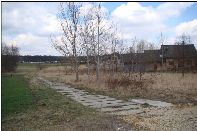
Fot. 1 Zachodnia część terenu, widok z ul. Wiejskiej