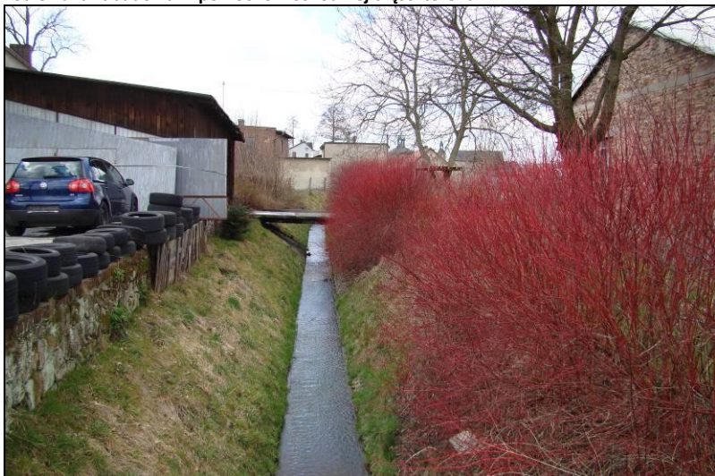
Fot. 10 Potok Tyski we wschodniej części terenu