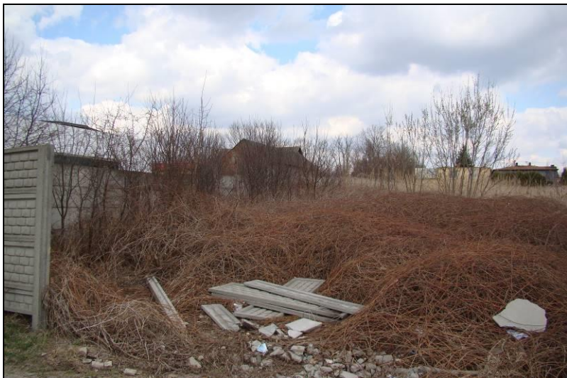
Fot. 9 Luka zabudowa w północno-wschodniej części terenu