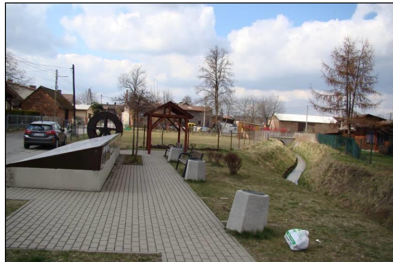
Fot. 11 Niewielki skwer w południowo-wschodniej części terenu, rejon ul. Wiejskiej i ul. Leśnej