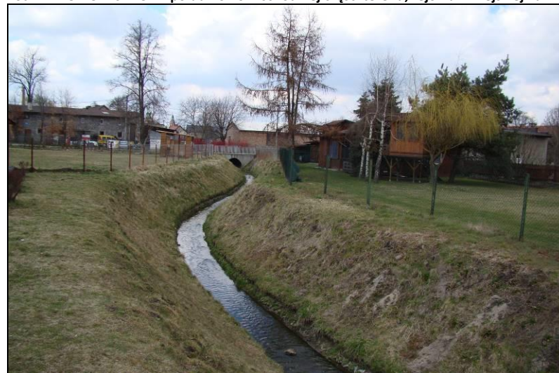
Fot. 12 Potok Tyski, widok w kierunku zachodnim z ul. Leśnej