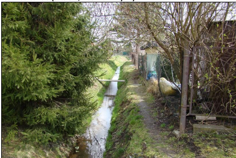
Fot. 2 Potok Tyski w rejonie ul. Wrzosowej