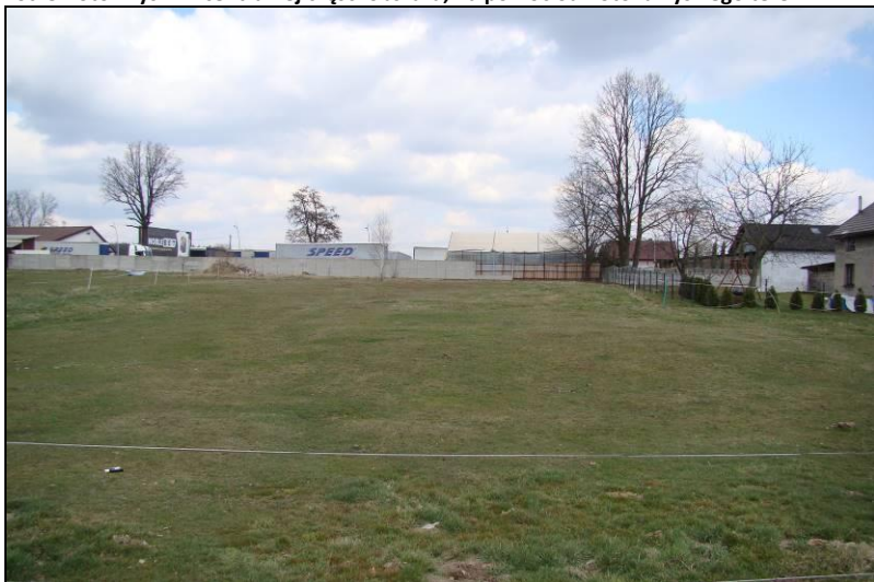
Fot. 6 Wybieg dla koni na północ od ul. Wiejskiej MN4