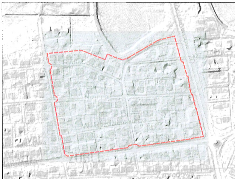
Rysunek 1 Ukształtowanie terenu na podstawie Numerycznego Modelu Terenu