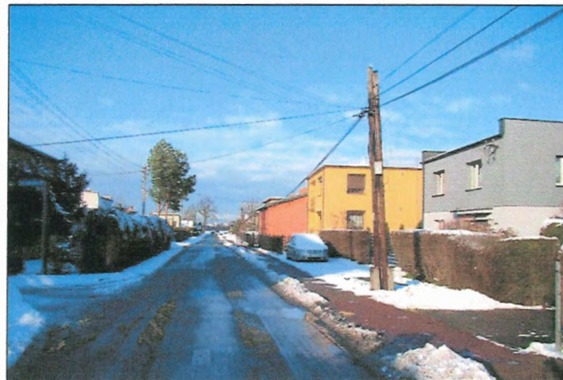
Fot. 3 Zachodnia granica terenu, ul. Borowa