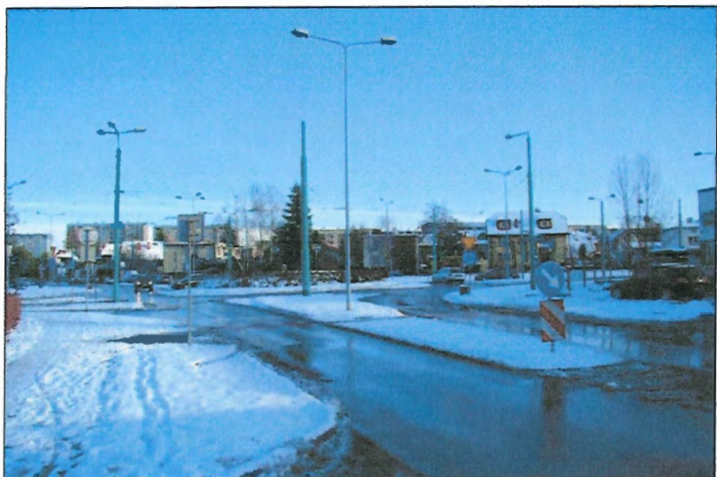
Fot. 1 Rondo Harcerskie, połączenie, ul. Stoczniewców 70 i ul. Harcerskiej