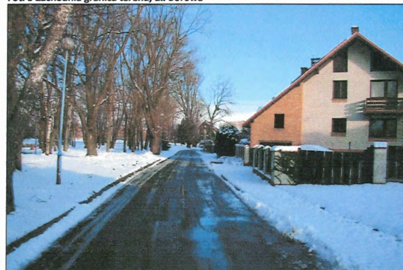
Fot. 4 Ul. Ks. S. Radziejowskiego, północna granica terenu