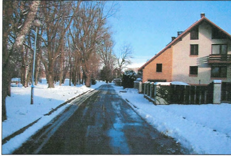
Fot. 4 Ul. Ks. S. Radziejewskiego, północna granica terenu