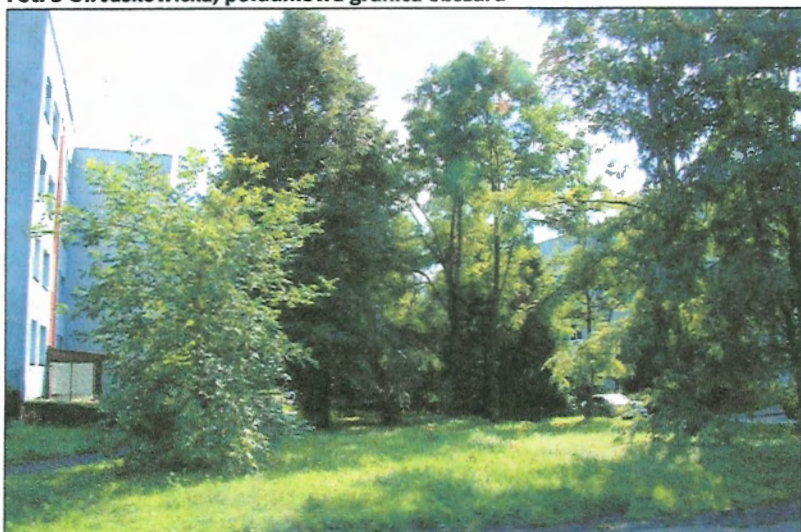
Fot. 6 Teren zieleni w centralnej części obszaru