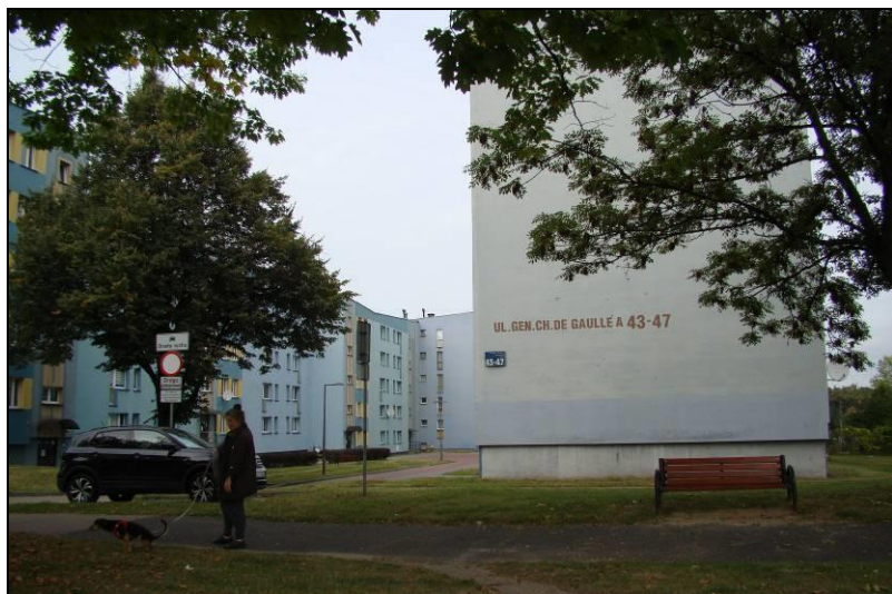
Fot. 9 Rejon ul. De Gaulle`a, wschodnia część obszaru