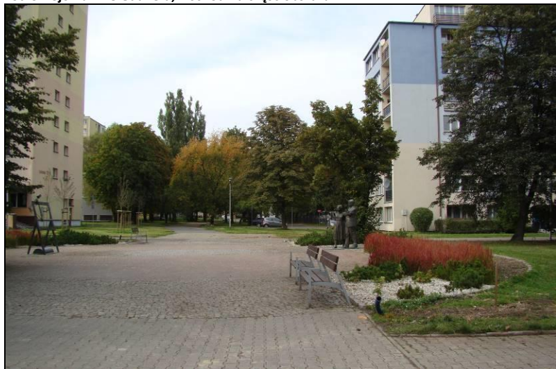
Fot. 10 Widok na tereny zielone w centralnej części terenu, rejon ul. Darwina