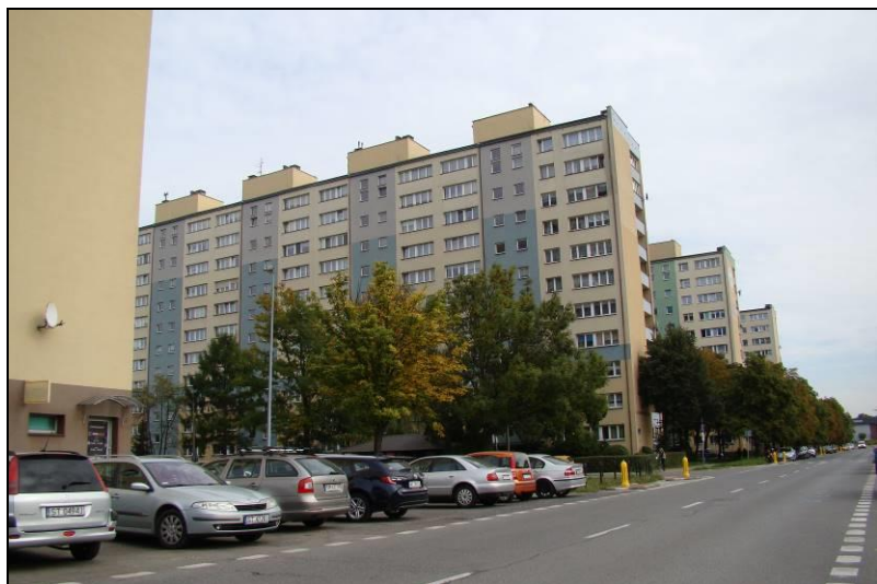
Fot. 5 Jak powyżej