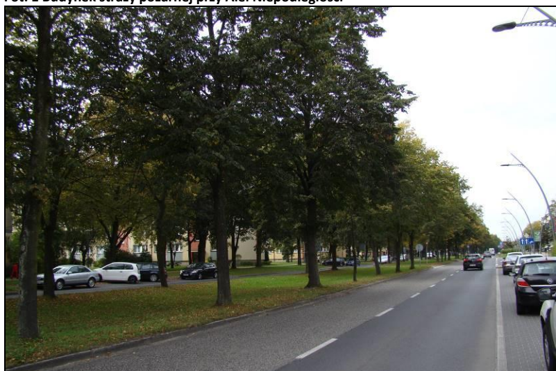
Fot. 2 Aleja Niepodległości, północna granica obszaru