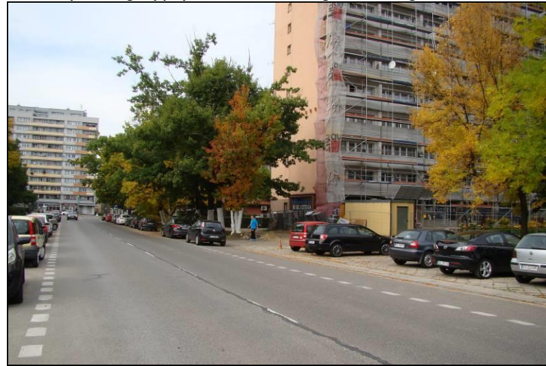
Fot. 4 Ul. Dąbrowskiego, południowa granica obszaru