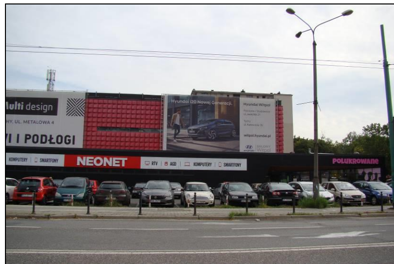
Fot. 3 Budynek usługowy przy ul. S. Grota-Roweckiego, zachodnia granica obszaru