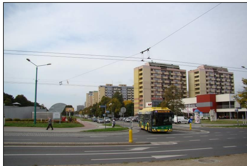
Fot. 7 Analizowany obszar, widok w kierunku północno-zachodnim