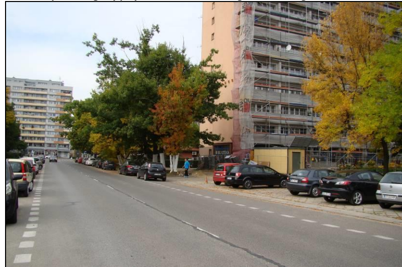
Fot. 4 Ul. Dąbrowskiego, południowa granica obszaru