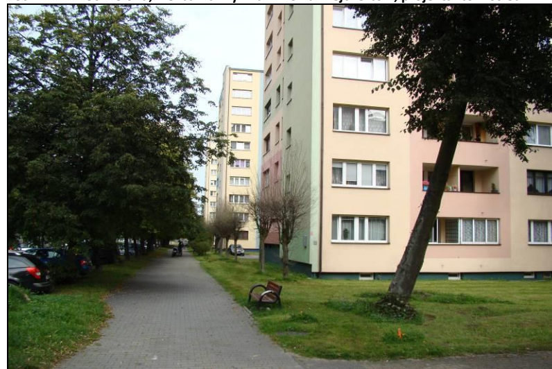
Fot. 12 Rejon ul. Darwina, centralna część terenu