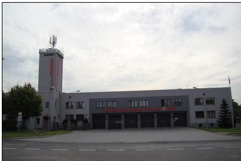
Fot. 1 Budynek straży pożarnej przy Alei Niepodległości