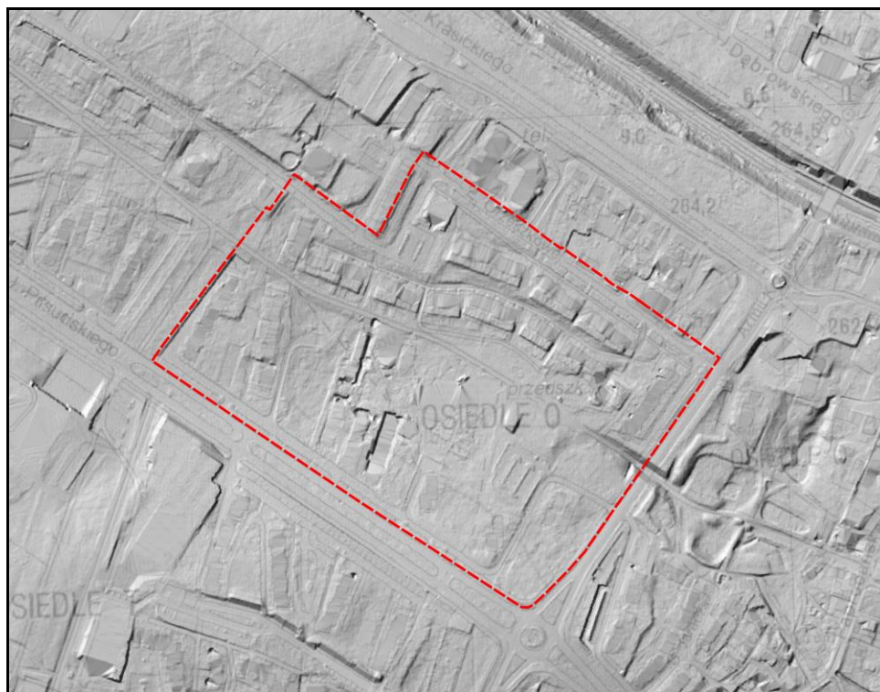
Rysunek 1 Ukształtowanie terenu na podstawie Numerycznego Modelu Terenu