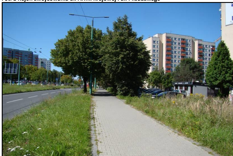
Fot. 2 Ul. Piłsudskiego, południowa granica obszaru