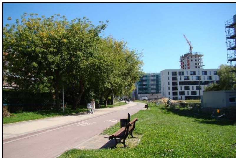
Fot. 5 Teren zieleni urządzonej w centralnej części obszaru