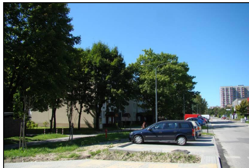
Fot. 7 Ul. E. Orzeszkowej, północno-wschodnia część obszaru