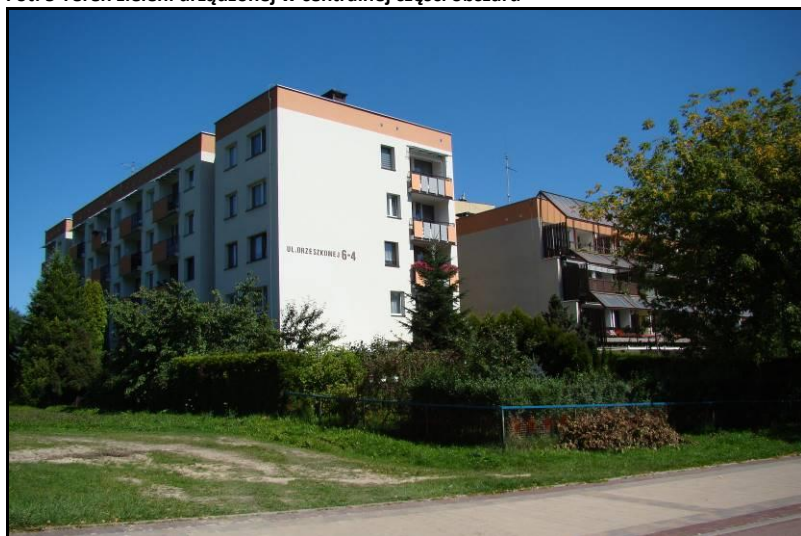
Fot. 6 Zabudowa wielorodzinna w rejonie ul. Orzeszkowej, północna część obszaru