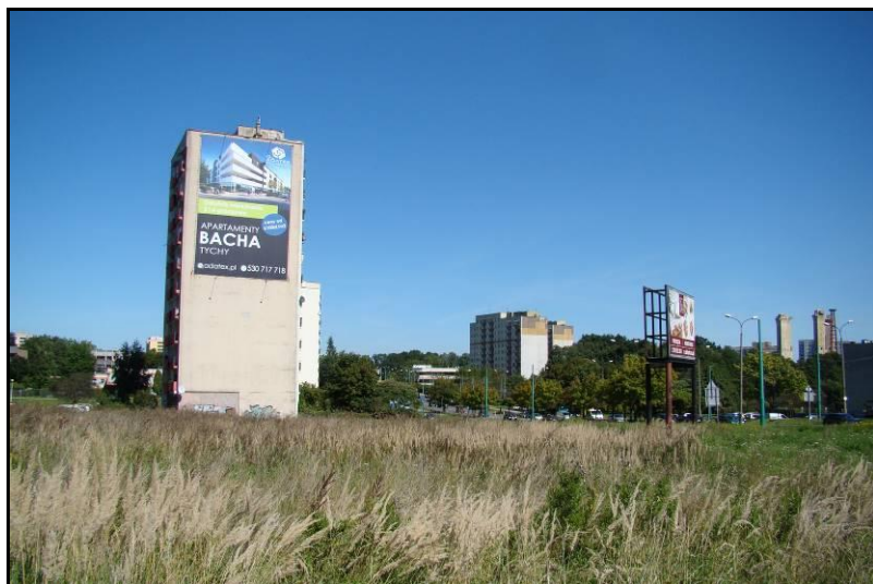
Fot. 1 Rejon skrzyżowania ul. Armii Krajowej i ul. Piłsudskiego