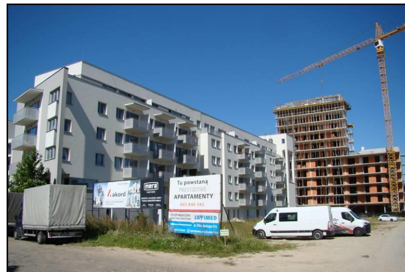
Fot. 3 Teren nowopowstającej zabudowy wielorodzinnej w południowej części obszaru