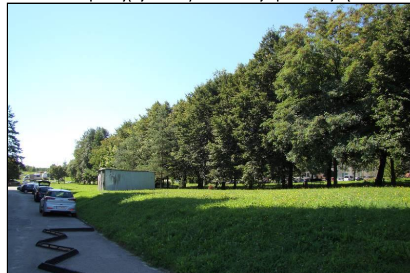
Fot. 4 Pas zadrzewień na zachodniej granicy obszaru