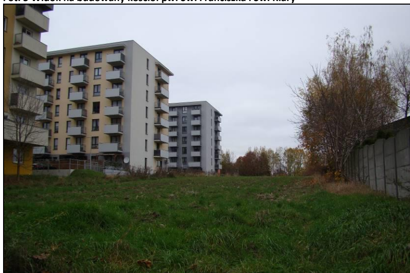
Fot. 6 Zabudowa wielorodzinna i teren rolny w części północno-wschodniej