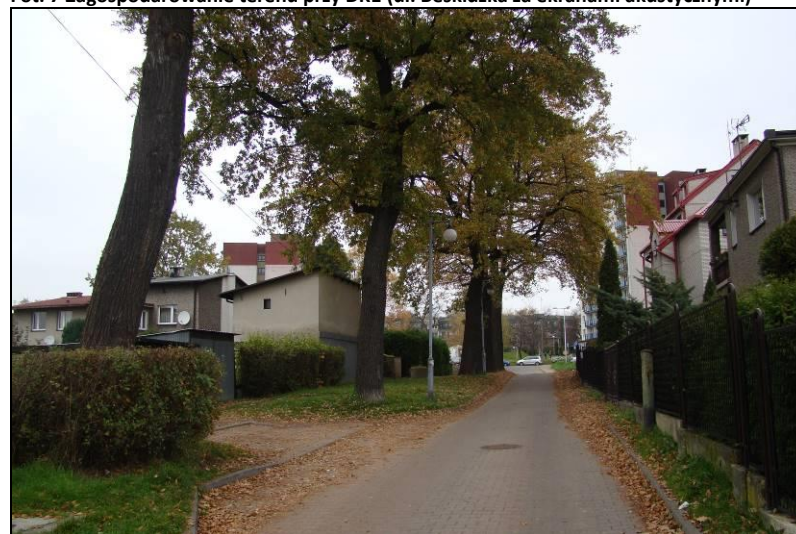
Fot. 8 Dęby na drodze łączącej ul. Przemysłową z ul. Poziomkową