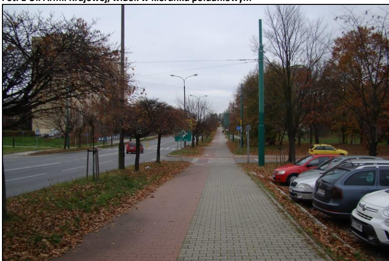
Fot. 2 Ul. Armii Krajowej, widok w kierunku północnym