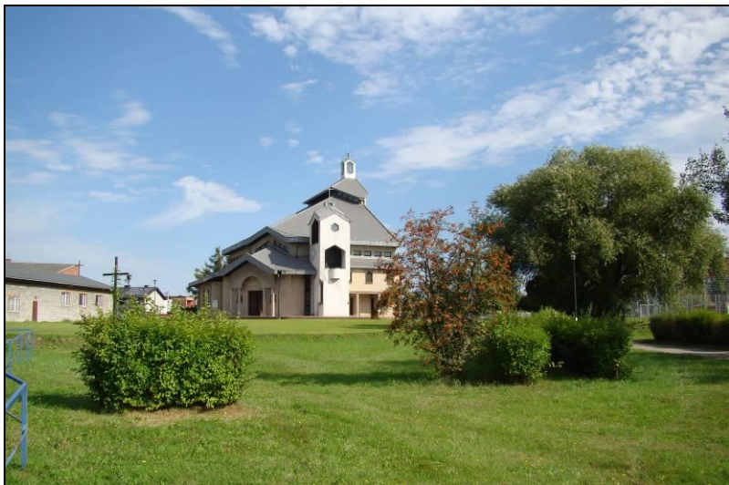
Fot. 5 Kościół pw. Św. Jadwigi Śląskiej