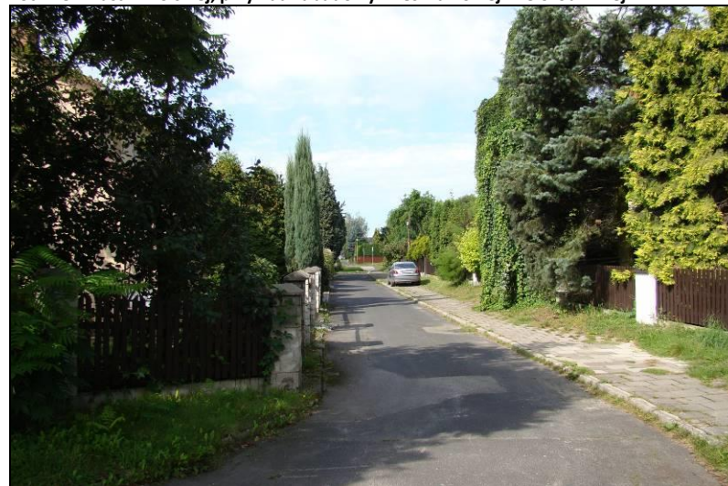
Fot. 8 Ul. Owczarska, przykład zabudowy mieszkaniowej jednorodzinnej