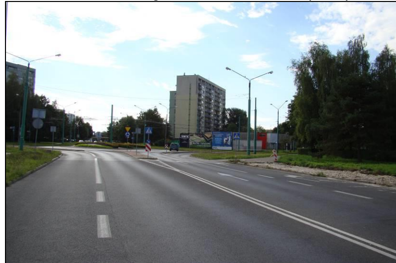
Fot. 4 Ul. Żwakowska, widok w kierunku południowym