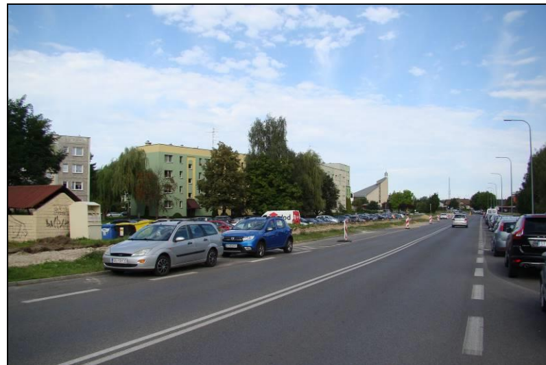
Fot. 3 Ul. Żwakowska, wschodnia granica obszaru, widok w kierunku północnym