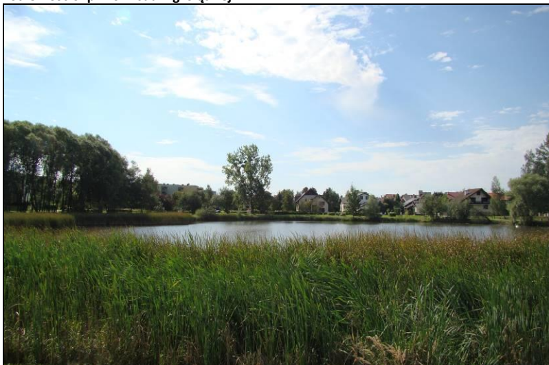
Fot. 6 Staw w Parku Suble poza północną granicą obszaru