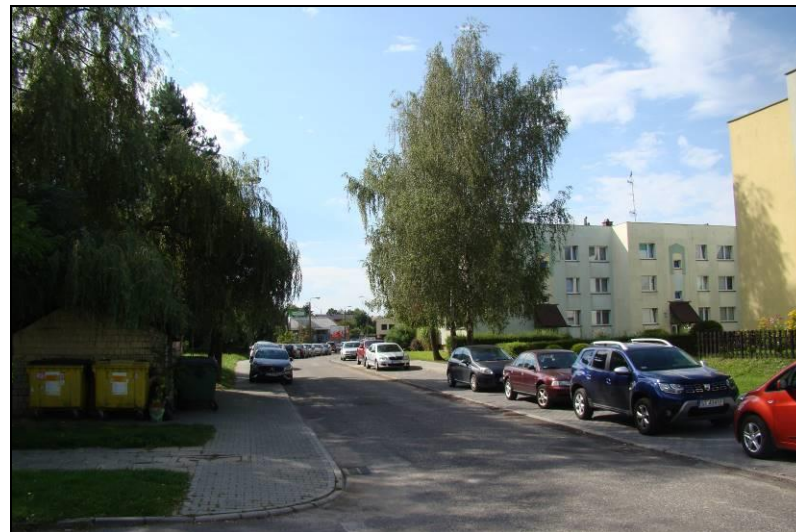
Fot. 7 Ul. Husarii Polskiej, przykład zabudowy mieszkaniowej wielorodzinnej