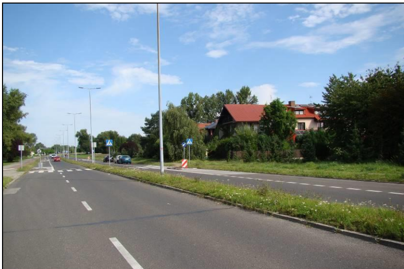
Fot. 1 Ul. Stoczniewców 70, zachodnia granica obszaru