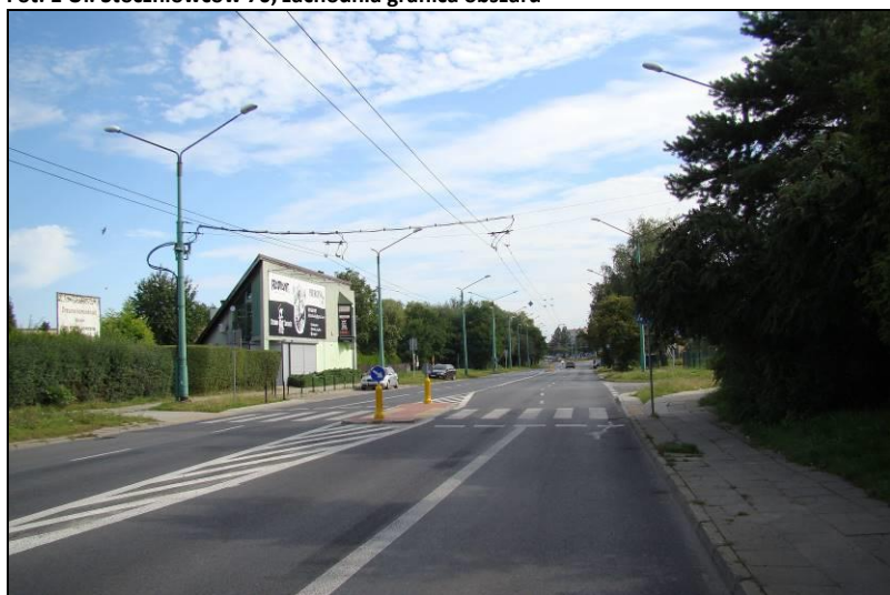
Fot. 2 Ul. Harcerska, południowa granica obszaru