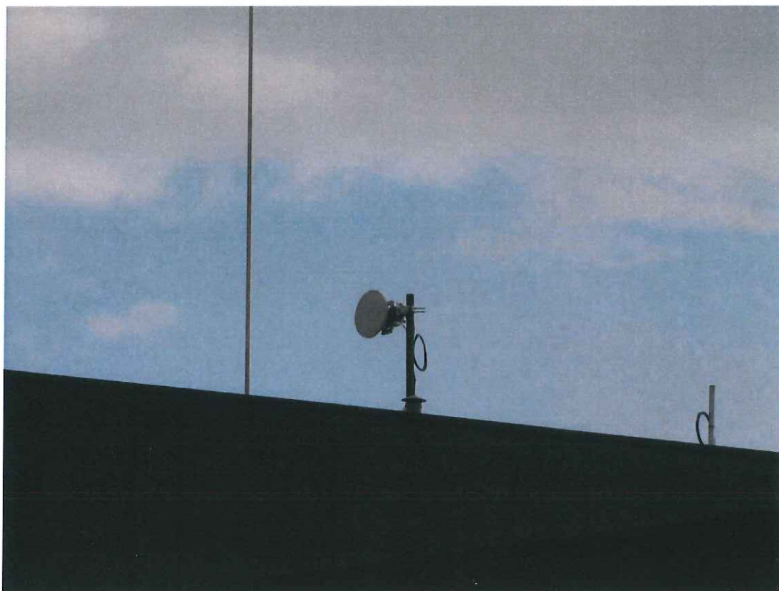
Widok instalacji radiokomunikacyjnej Stacja Netia TYCYB277 - TYCYM00060ANT001 Tychy, ul. Fabryczna 3b.