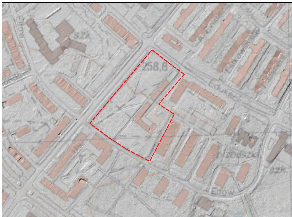
Rysunek 1 Ukształtowanie terenu na podstawie Numerycznego Modelu Terenu