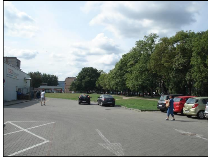
Fot. 4 Widok od strony ul. Edukacji w kierunku północnym