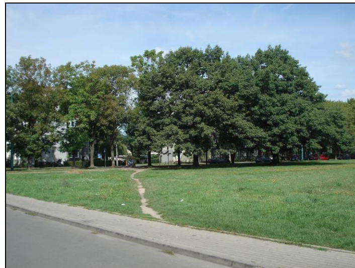
Fot. 3 Widok w kierunku zachodnim, widoczne dwa dęby wskazane do zachowania