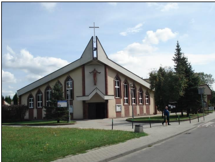
Fot. 1 Południowa część obszaru, widok na kościół pw. Świętej Rodziny