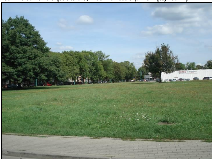
Fot. 2 Widok w kierunku północnym od strony ul. Elfów