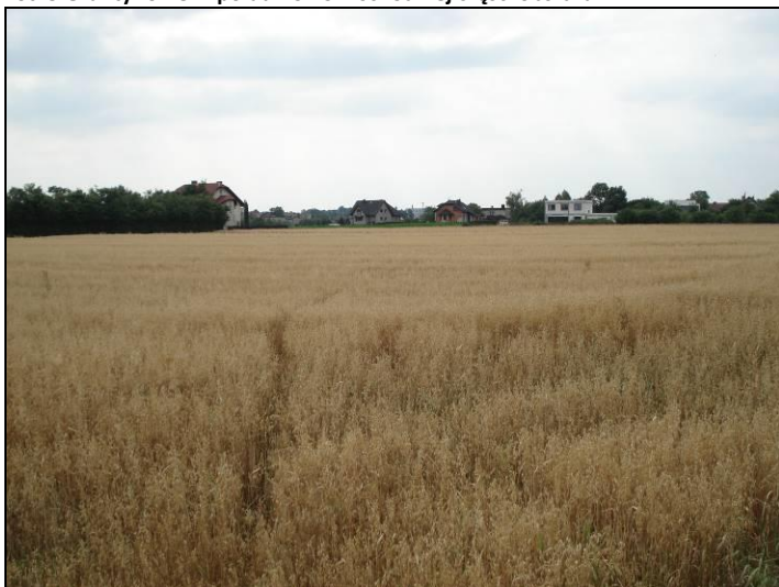
Fot. 6 Grunty rolne, widok od strony południowej w kierunku północnym