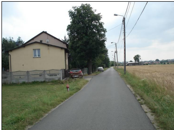
Fot. 1 Ul. Jaskrów, zachodnia granica obszaru