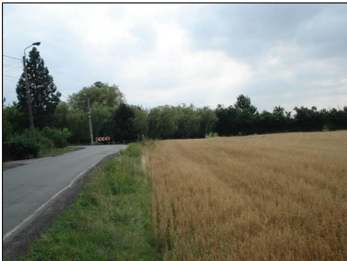
Fot. 5 Grunty rolne w południowo-wschodniej części obszaru