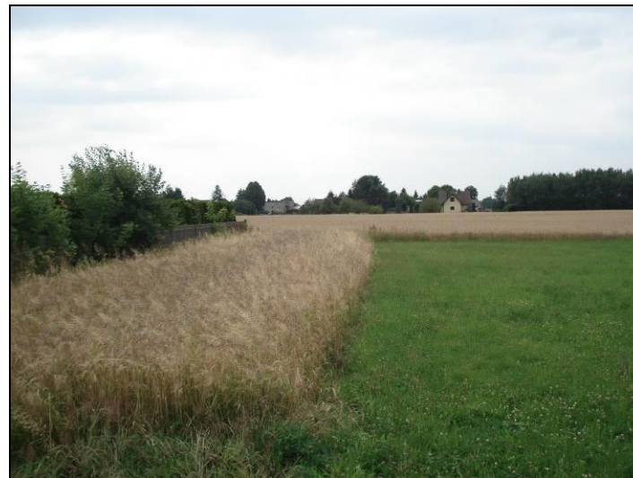
Fot. 3 Grunty rolne w centralnej części obszaru