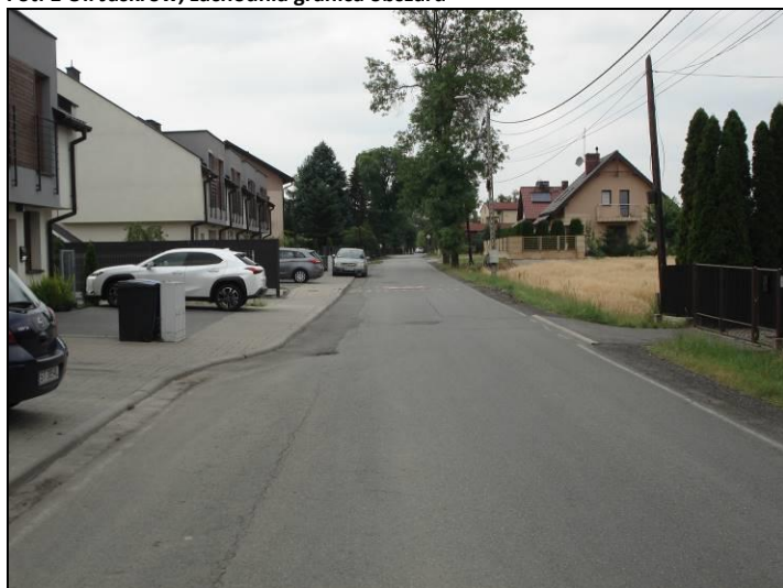
Fot. 2 Ul. Dzwonkowa, północna granica obszaru