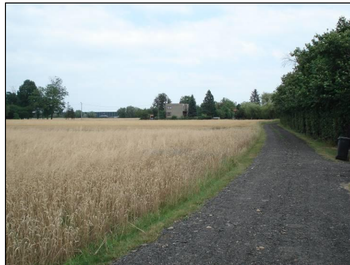
Fot. 7 Ul. jaskrów, planowana droga klasy lokalna, widok w kierunku wschodnim