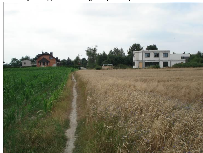
Fot. 8 Ul. jaskrów, planowana droga klasy lokalna, widok w kierunku zachodnim