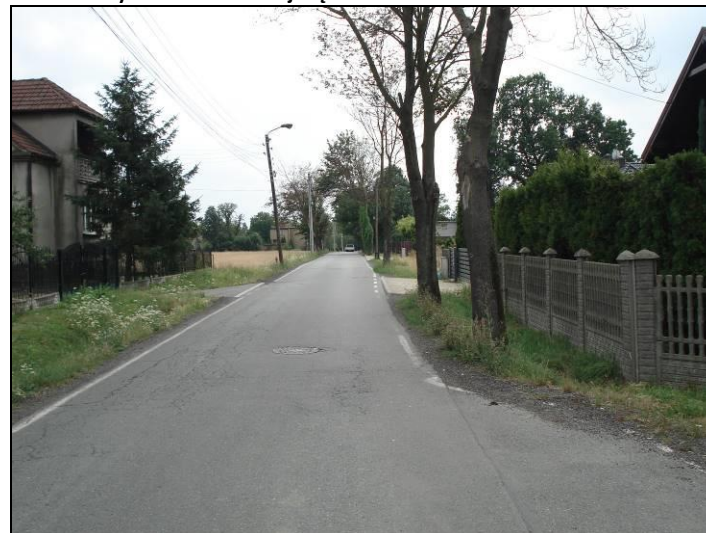
Fot. 4 Ul. Dzwonkowa, wschodnia granica obszaru