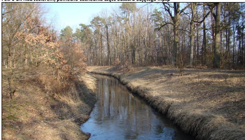
Fot. 2 Rzeka Gostynia