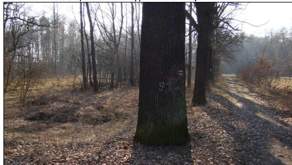
Fot. 12 Szpaler dębów w północnej części terenu