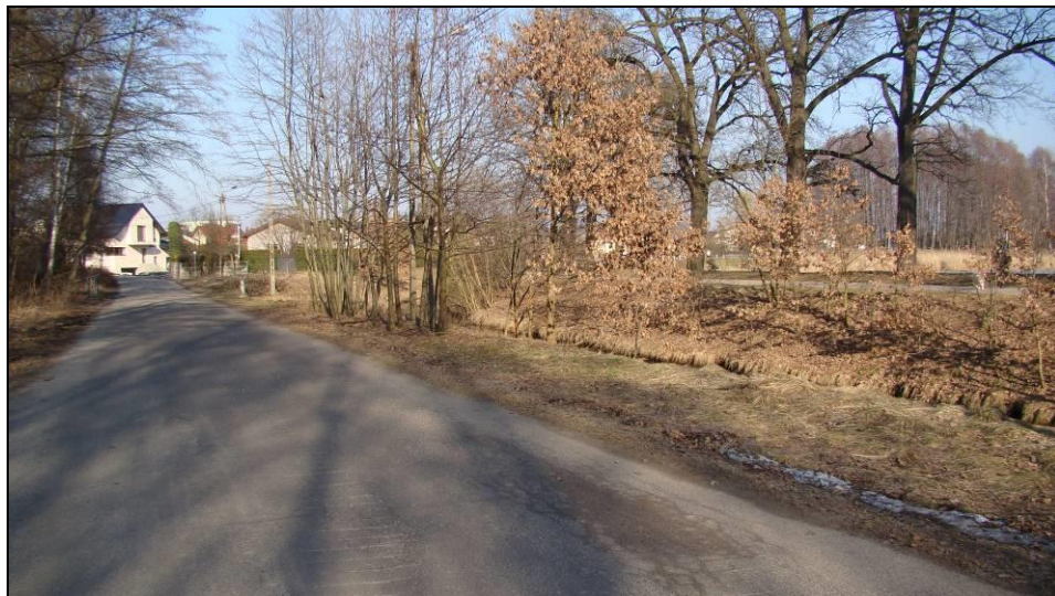
Fot. 1 Ul. Nad Jeziorem, północno-zachodnia część obszaru objętego mpzp