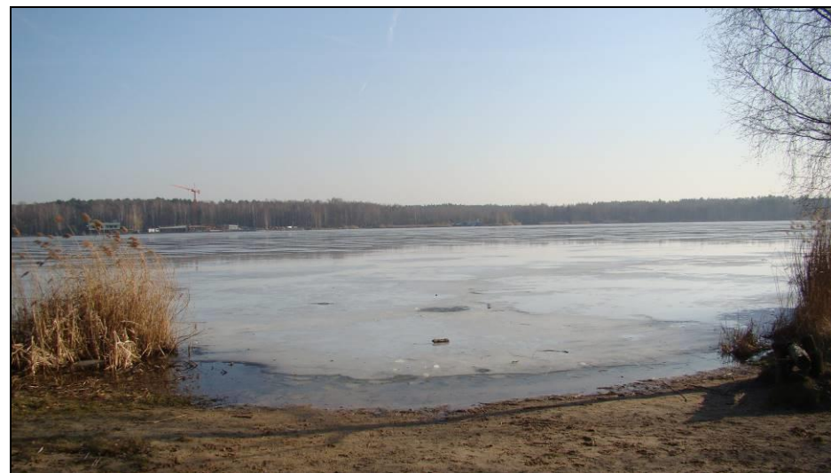
Fot. 7 Jezioro Paprocańskie