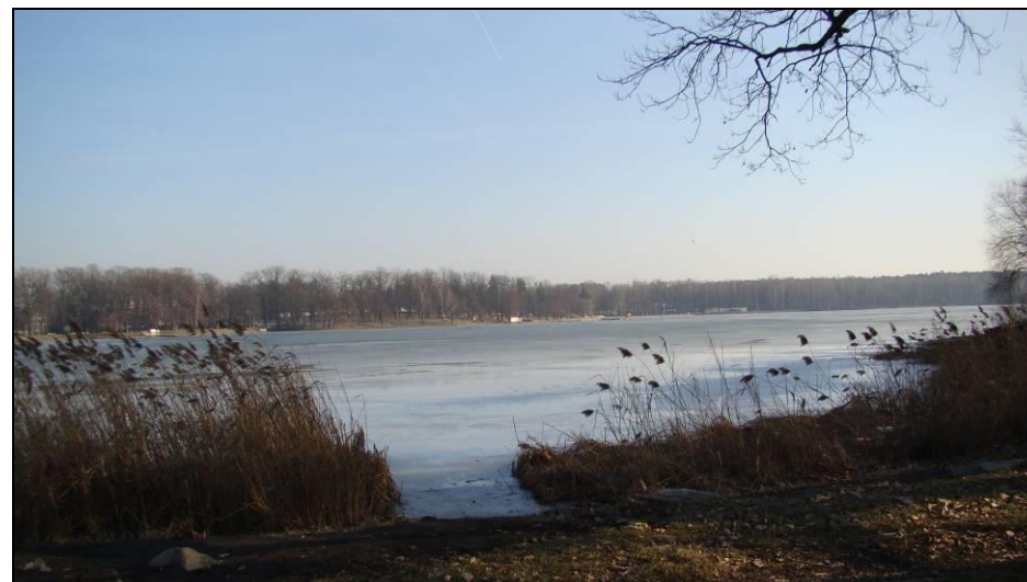
Fot. 11 Widok na Jezioro Paprocańskie od strony północno-zachodniej