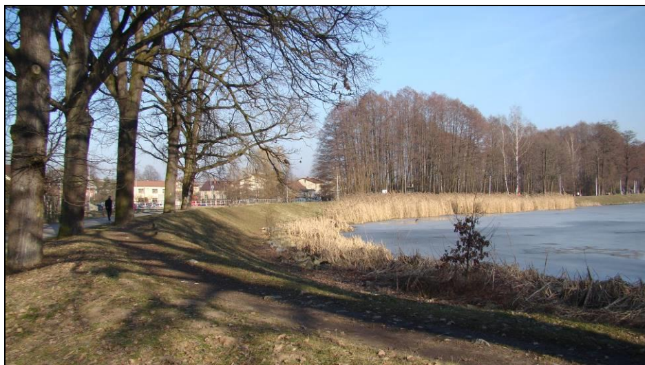
Fot. 9 Północno-wschodnia część obszaru