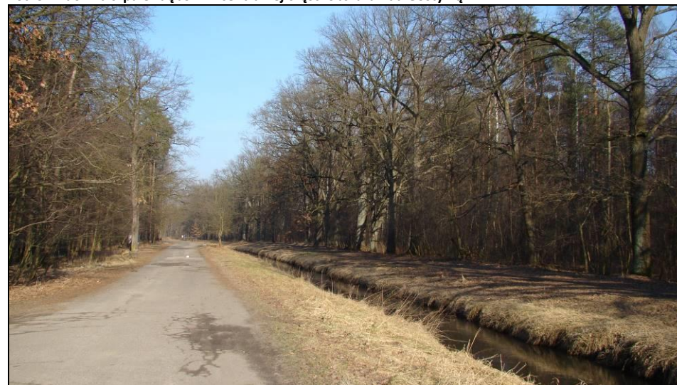
Fot. 4 Gostynia i ul. Nad Jeziorem w południowo-zachodniej części obszaru