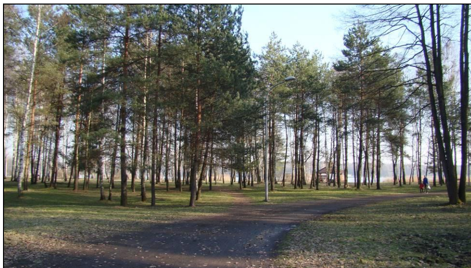
Fot. 5 Rejon planowanej lokalizacji terenów U i drogi KDJP