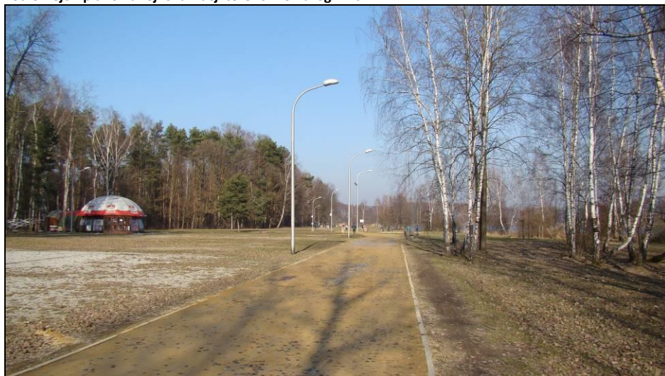
Fot. 6 Jak powyżej, widok w kierunku północnym