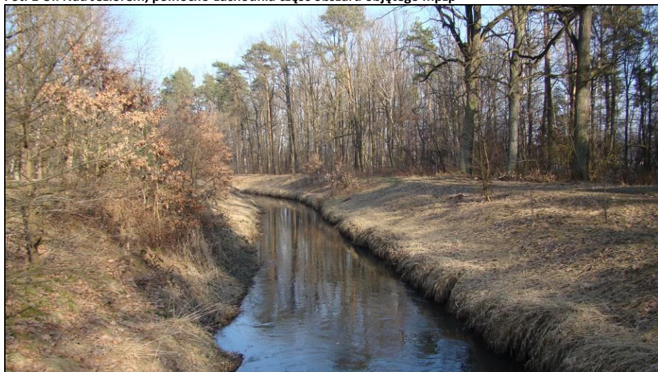
Fot. 2 Rzeka Gostynia