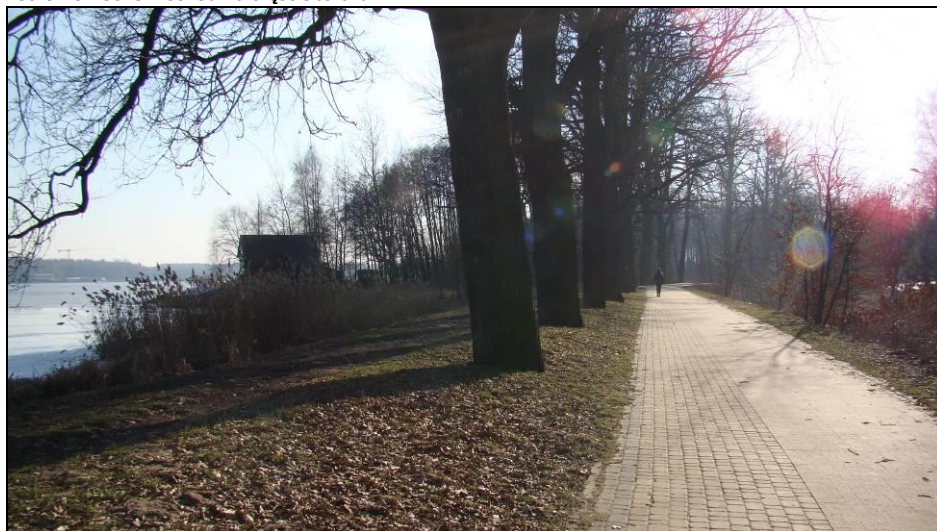
Fot. 10 Jak powyżej, widoczny budynek PZW