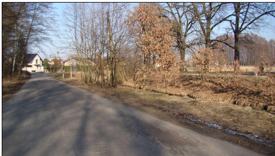
Fot. 1 Ul. Nad Jeziorem, północno-zachodnia część obszaru objętego mpzp