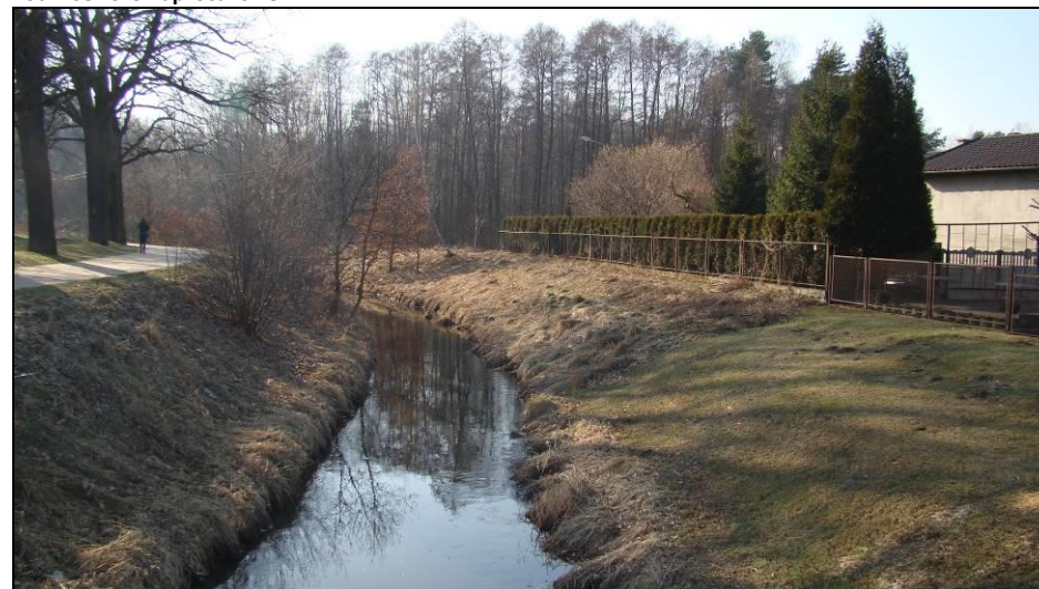
Fot. 8 Gostynia w północno-wschodniej części obszaru