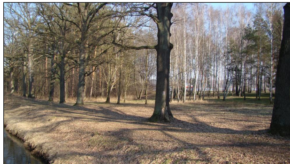
Fot. 3 Widok na szpaler dębów w centralnej części obszaru nad Gostynią