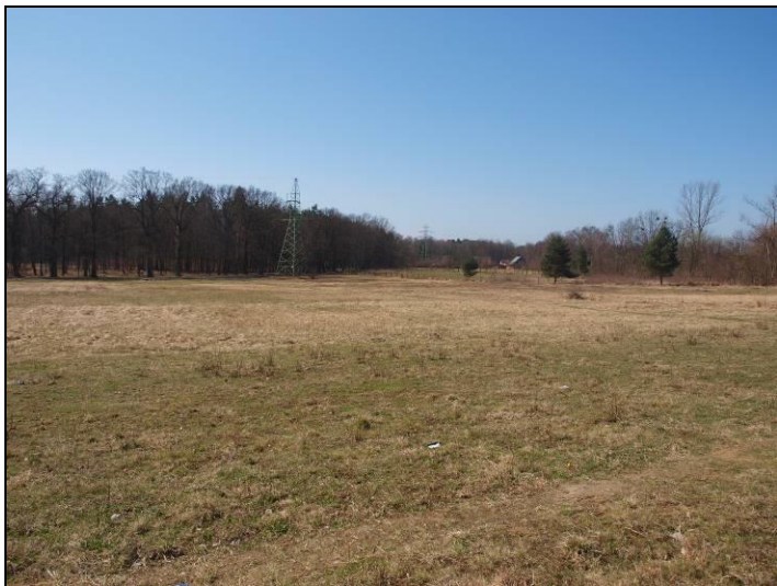
Fot. 1 Widok w kierunku południowo-zachodnim