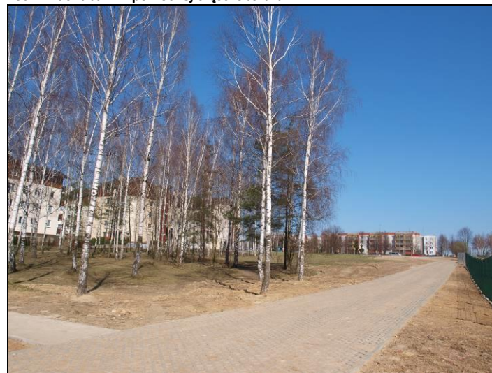
Fot. 8 Zadrzewienia brzoźowe w północnej części obszaru, pomiędzy Osiedlem 4 Pory Roku i Parkiem Wodnym