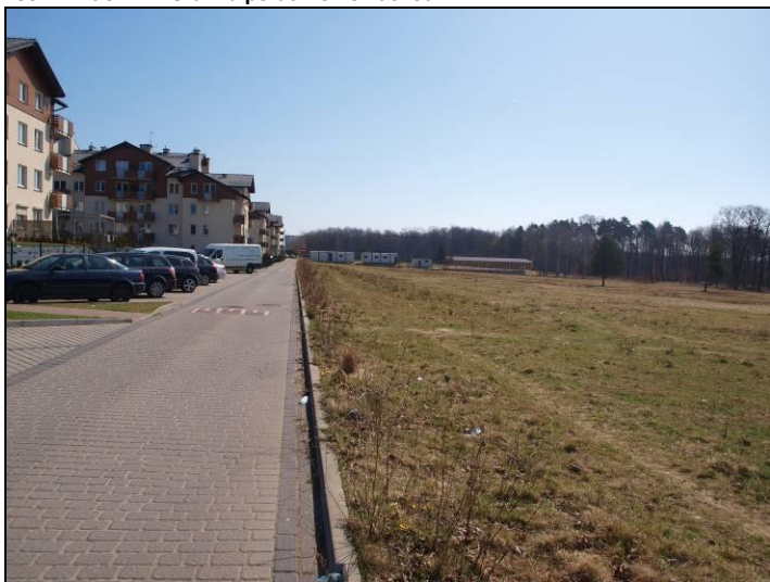
Fot. 2 Widok w kierunku wschodnim, po stronie północnej Osiedle 4 Pory Roku