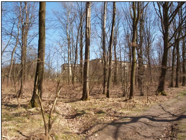
Fot. 5 Teren leśny we wschodniej części obszaru