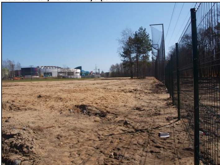
Fot. 6 Pole golfowe w centralnej części obszaru, w trakcie realizacji