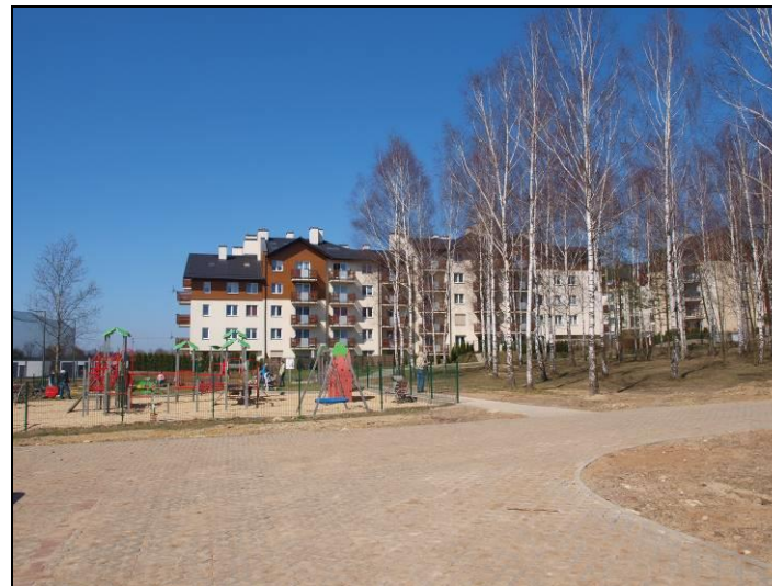
Fot. 7 Plac zabaw w północnej części obszaru