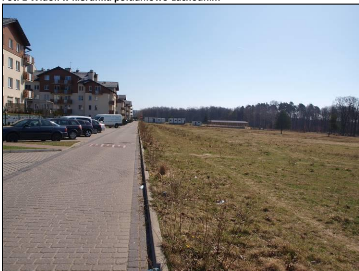
Fot. 2 Widok w kierunku wschodnim, po stronie północnej Osiedle 4 Pory Roku