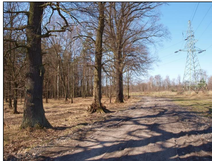
Fot. 3 Szpaler dębów w południowo-zachodniej części obszaru