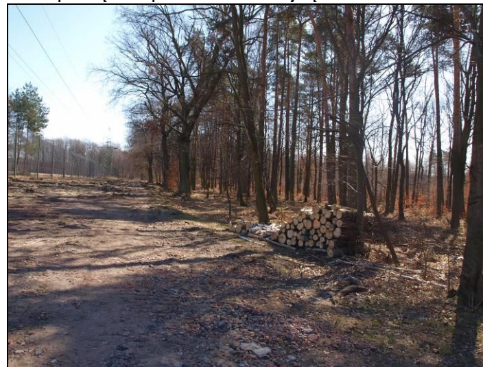
Fot. 4 Teren leśny w południowej części obszaru