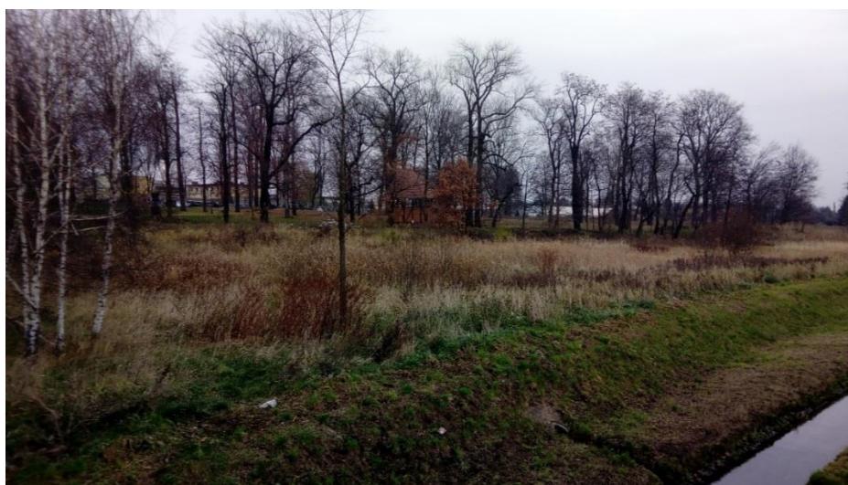
Ryc. 5. Roślinność wzdłuż Potoku Tyskiego oraz na terenie Parku Książęcego

Inny typ roślinności występuje w Parku Książęcym, zlokalizowanym przy północno-zachodniej granicy opracowania. Jest to teren z zielenią urządzoną. Wśród drzew wyróżnić można m.in. robinie akacjowe, lipy drobnolistne, modrzewie europejskie, dęby i platany. Część gatunków liczy kilkaset lat. Cały zespół pałacowo-parkowy poddawany jest sukcesywnej rewitalizacji. Park, poza funkcją krajobrazową i rekreacyjną, spełnia również ważną rolę ekologiczną w układzie miejskim, zapewniając środowisko bytowania różnym organizmom roślinnym i zwierzęcym, a także stanowi uzupełnienie istniejących lokalnych powiązań przyrodniczych.