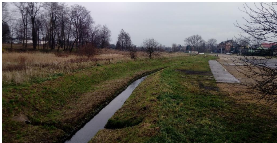
Ryc. 7. Dolina Potoku Tyskiego w zachodniej części terenu opracowania