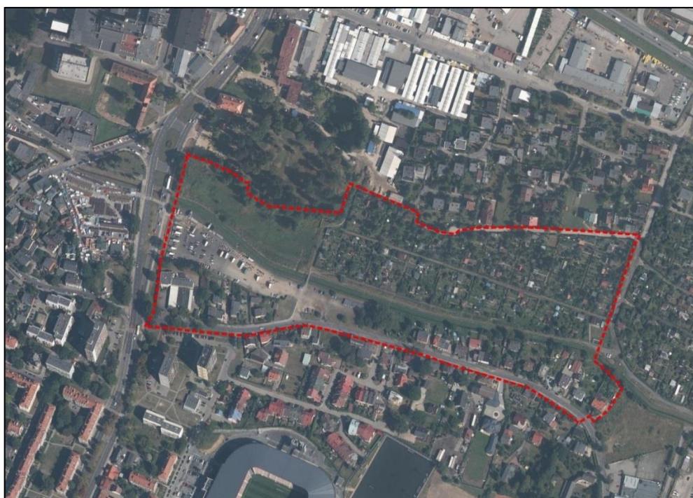
Ryc. 1. Granice obszaru objętego opracowaniem

Granice obszaru objętego planem zostały wyznaczone w uchwale nr XIX/342/16 Rady Miasta Tychy z dnia 31 marca 2016 roku w sprawie przystąpienia do sporządzania miejscowego planu zagospodarowania przestrzennego w rejonie ulic: Starokościelnej, Jaworowej oraz Alei Bielskiej i Potoku Tyskiego w Tychach.