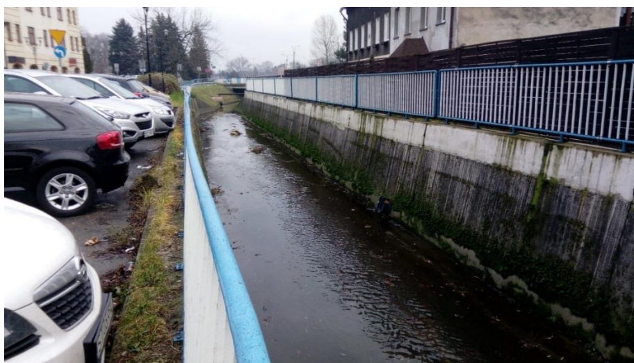
Ryc. 6. Potok Tyski poza obszarem opracowania - przy ul. Kościuszki

Na obszarze analizy potencjalnym lokalnym korytarzem ekologicznym jest dolina Potoku Tyskiego. Zapewnia ona, raczej odcinkową migrację owadów, ryb, płazów i drobnych zwierząt. Potok Tyski, ze względu na niezadowalający stan chemiczny wód, wykonane w przeszłości regulacje oraz istniejące bariery antropogeniczne, spełnia ograniczoną rolę jako szlak migracyjny zwierząt. Na zachód od analizowanego obszaru jego dolina została przegrodzona mostem na al. Bielskiej, dalej ciek jest mocno obudowany, a ewentualna migracja fauny może odbywać się jedynie korytem potoku (Ryc. 6). Większe możliwości przemieszczania się zwierząt i roślin występują w kierunku wschodnim. Dolina Potoku Tyskiego, wraz z terenami ogrodów działkowych stanowi lokalny łącznik ekologiczny pomiędzy Parkiem Książęcym a Parkiem Północnym. Dalej jednak pasy zieleni wzdłuż cieku zostają znów ograniczone przez duży węzeł drogowy na skrzyżowaniu ul. Oświęcimskiej i Beskidzkiej, co utrudnia dalszą migrację fauny i flory.