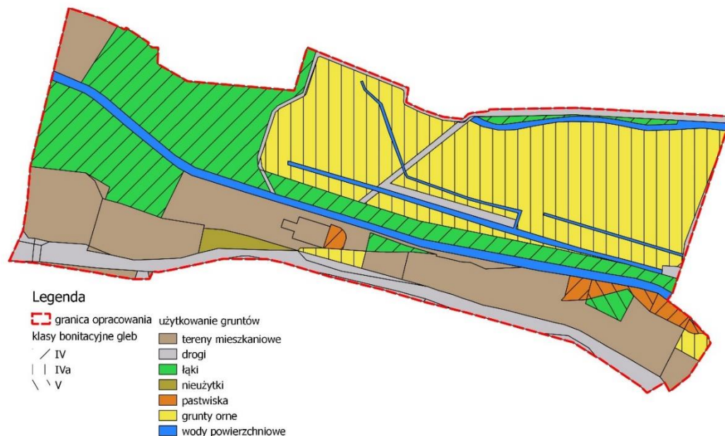
Ryc. 3. Użytkowanie gruntów oraz klasyfikacji bonitacyjna gleb

Na obszarze analizy występują grunty orne (w rejonie ogródków działkowych), użytki zielone oraz tereny zabudowane. Fragmentarycznie występują grunty klasyfikowane jako pastwiska i nieużytki. Występują tu gleby IV i V klasy bonitacyjnej (Ryc. 3).