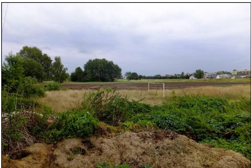
Fot. 9 Dolina Gostyni, widok od strony północnej