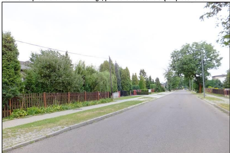
Fot. 2 Ul. Paprocańska