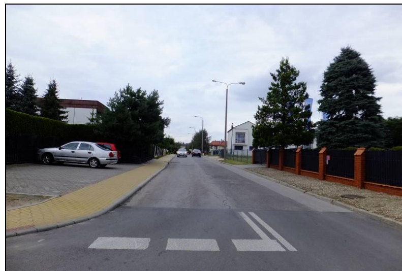
Fot. 3 Ul. H. Jordana