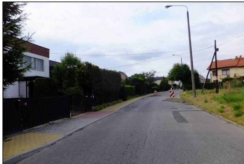
Fot. 7 Ul. H. Jordana