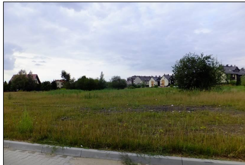
Fot. 4 Ruderalne nieużytki przy ul. H. Jordana