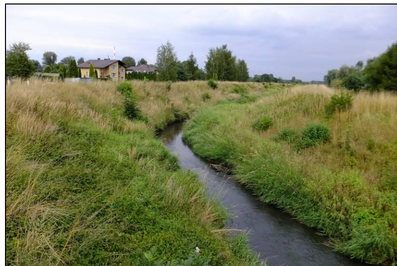
Fot. 11 Gostynia, widok w kierunku wschodnim