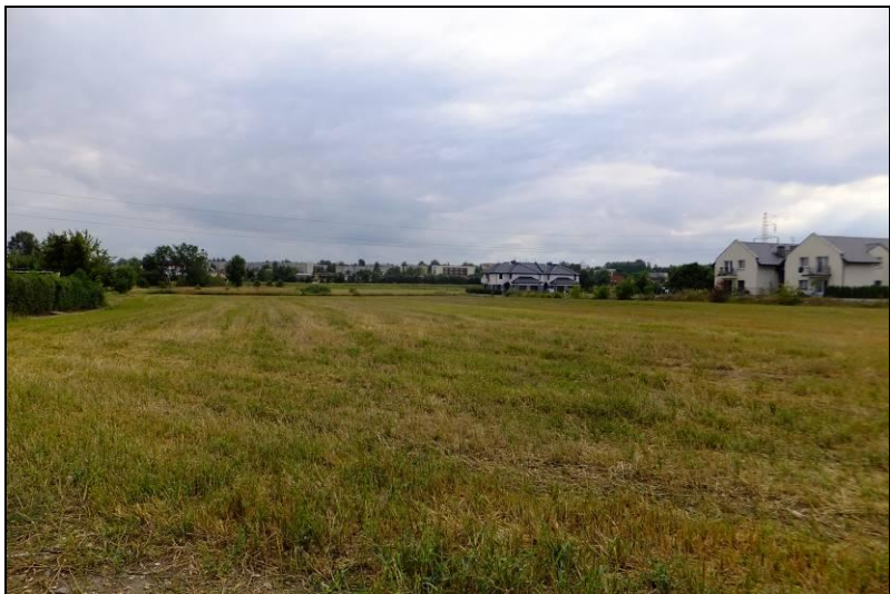
Fot. 5 Skoszona łąka przy ul. H. Jordana