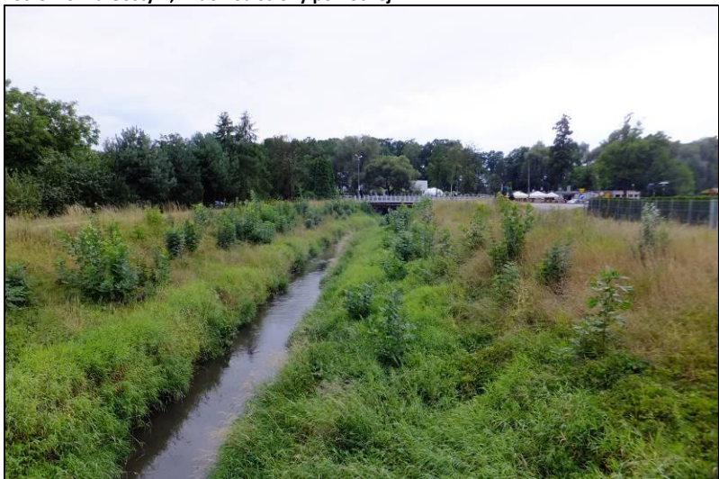
Fot. 10 Gostynia, widok w kierunku zachodnim