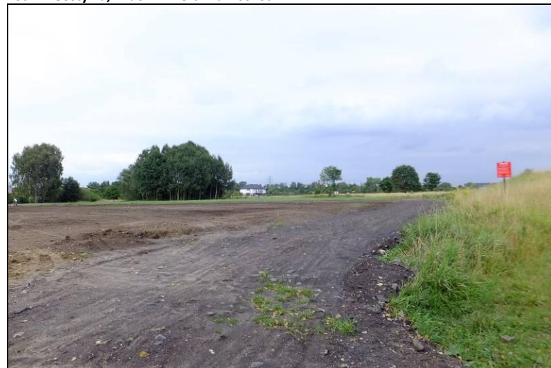
Fot. 12 Dolina Gostyni, widok od strony południowo-zachodniej