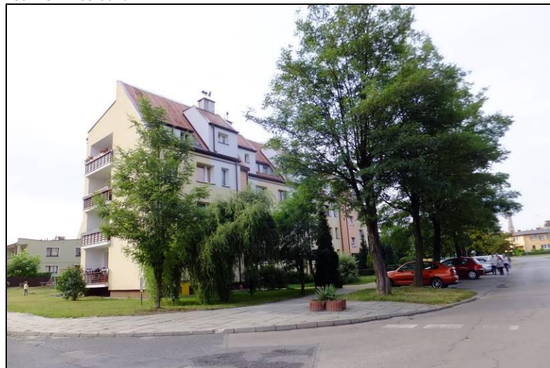
Fot. 8 Zabudowa mieszkaniowa wielorodzinna przy ul. H. Jordana