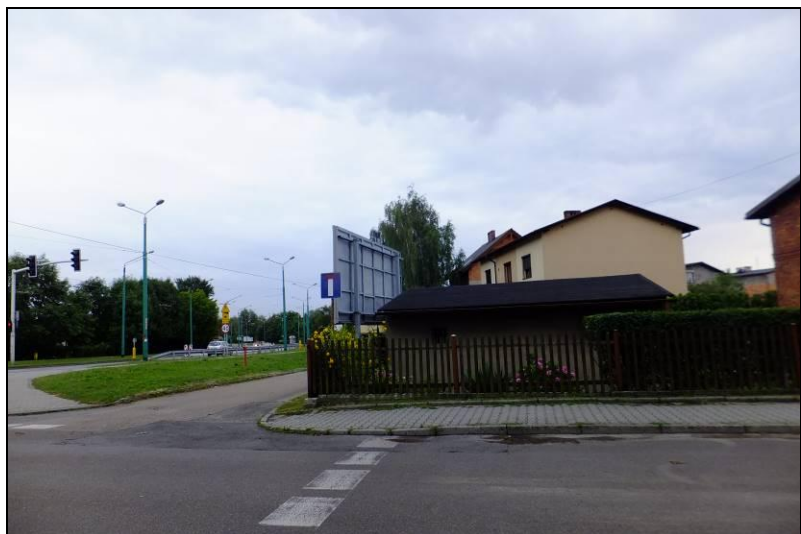
Fot. 1 Ul. Paprocańska i ul. Piłsudskiego, północno-zachodnia część opracowania