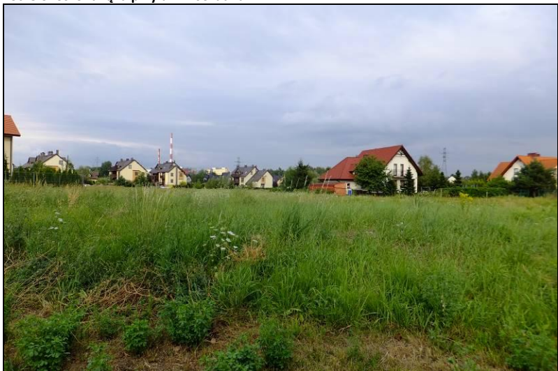
Fot. 6 Nieużytki przy ul. H. Jordana