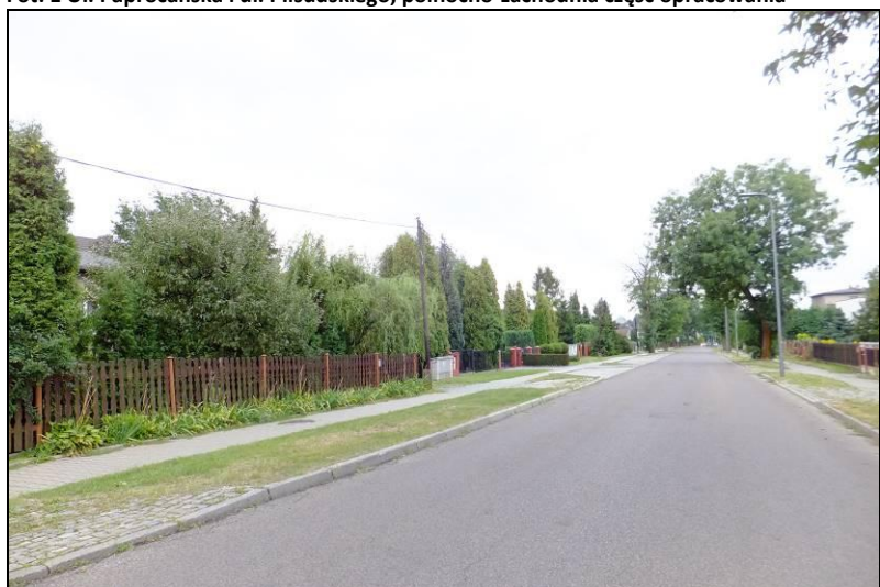
Fot. 2 Ul. Paprocańska