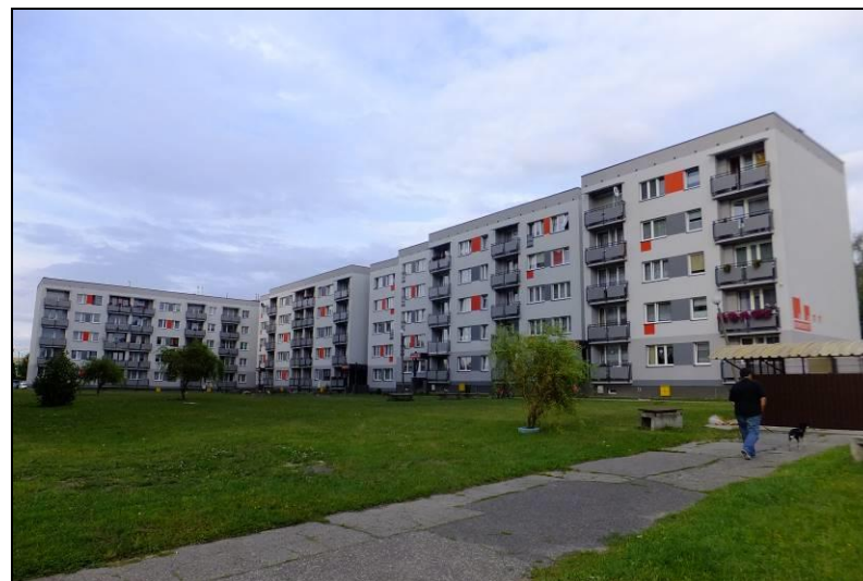
Fot. 7 Jak powyżej