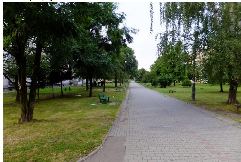
Fot. 8 Zieleni urządzona w zachodniej części obszaru