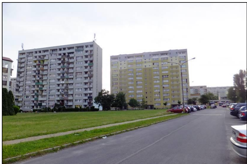
Fot. 1 Centralna część analizowanego obszaru