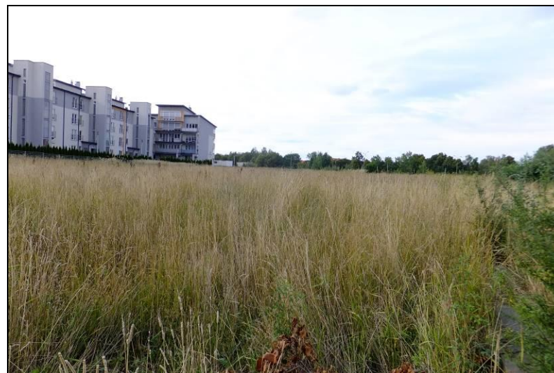
Fot. 3 Teren do tej pory niezabudowany w rejonie ul. Kopernika