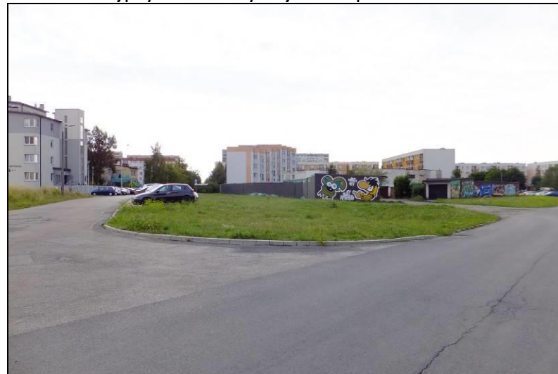
Fot. 4 Zespół garaży osiedlowych w północno-wschodniej części obszaru