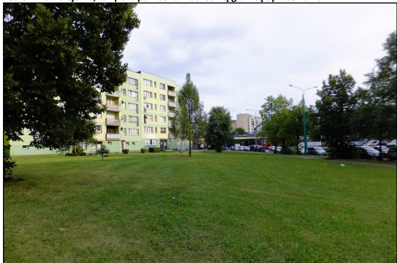
Fot. 6 Zabudowa wielorodzinna w zachodniej części obszaru