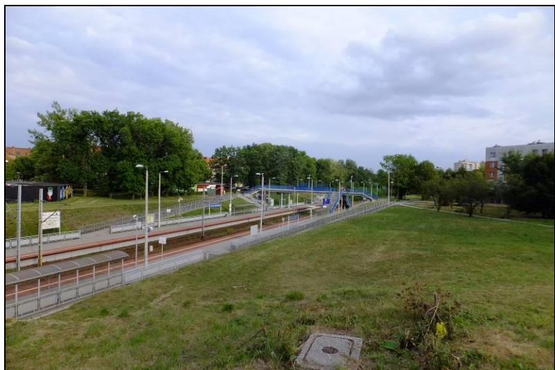
Fot. 5 Linia kolejowa, tuż poza północno-wschodnią granicą opracowania