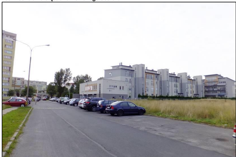
Fot. 2 Jak powyżej