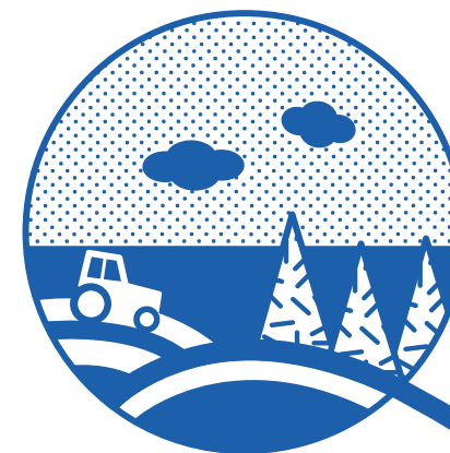
tereny zieleni: (np. rolne, leśne, parkowe lub ogródki działkowe)