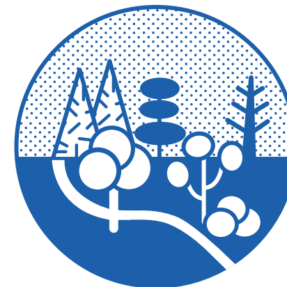
niezabudowane (np. las lub park)