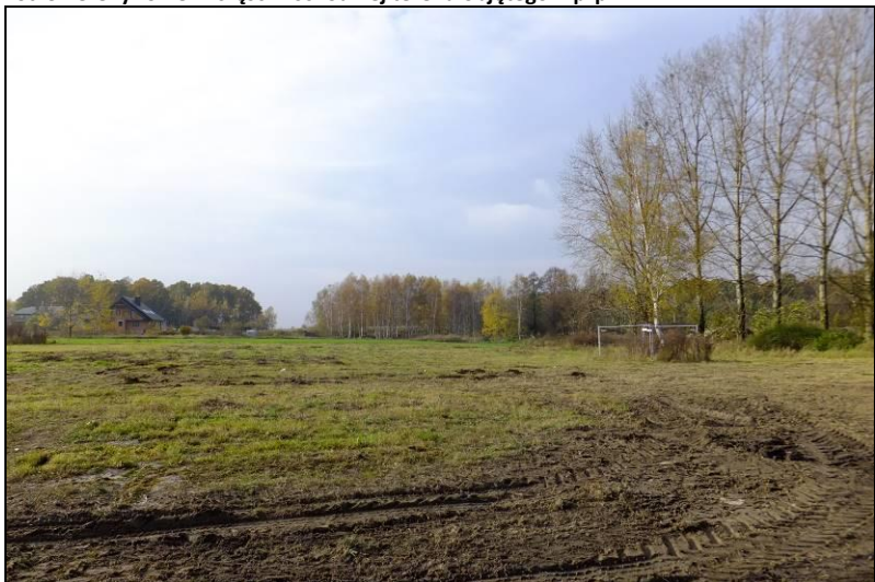
Fot. 10 Część wschodnia doliny Dopywu spod Mąkołowca, widok w kierunku południowo-zachodnim z ul. Kolibrów