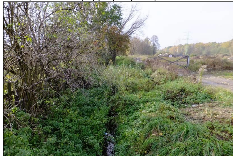
Fot. 12 Część wschodnia Doliny Dopywu spod Mąkołowca, widok w kierunku zachodnim z ul. Kolibrów