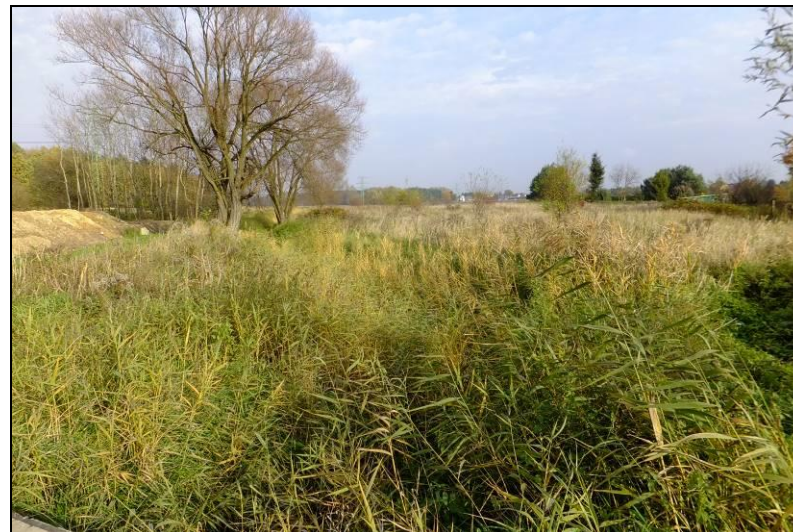
Fot. 11 Część wschodnia Doliny Dopywu spod Mąkołowca, widok w kierunku wschodnim z ul. Kolibrów