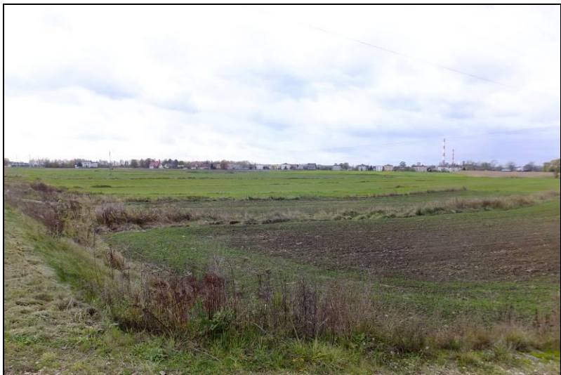
Fot. 1 Widok w kierunku zachodnim z ul. Serdecznej