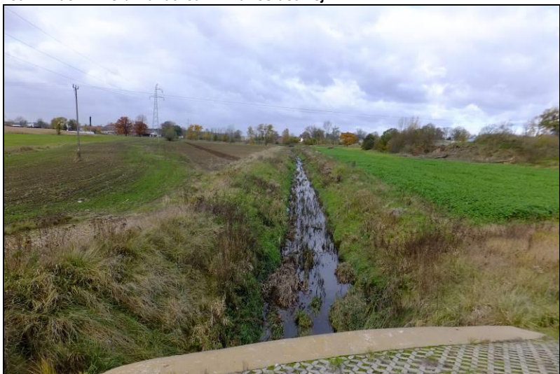
Fot. 2 Potok Tyski, widok z ul. Serdecznej