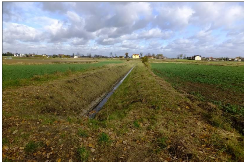
Fot. 5 Potok Nowotyski, widok z drogi gruntowej, która stanowi przedłużenie ul. Żniwnej