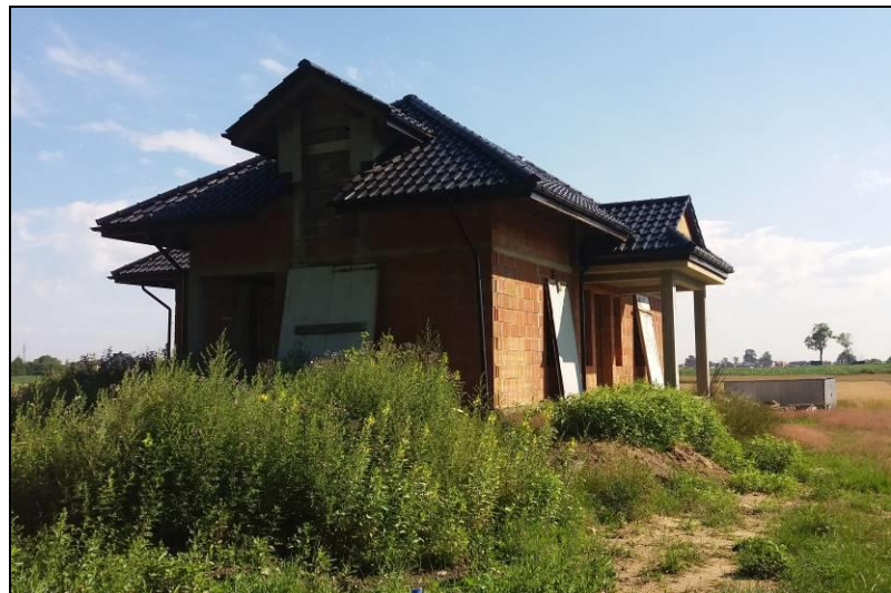
Fot. 7 Budynek zlokalizowany na podstawie decyzji o warunkach zabudowy na otwartych terenach rolnych, północno-zachodnia część obszaru objętego planem