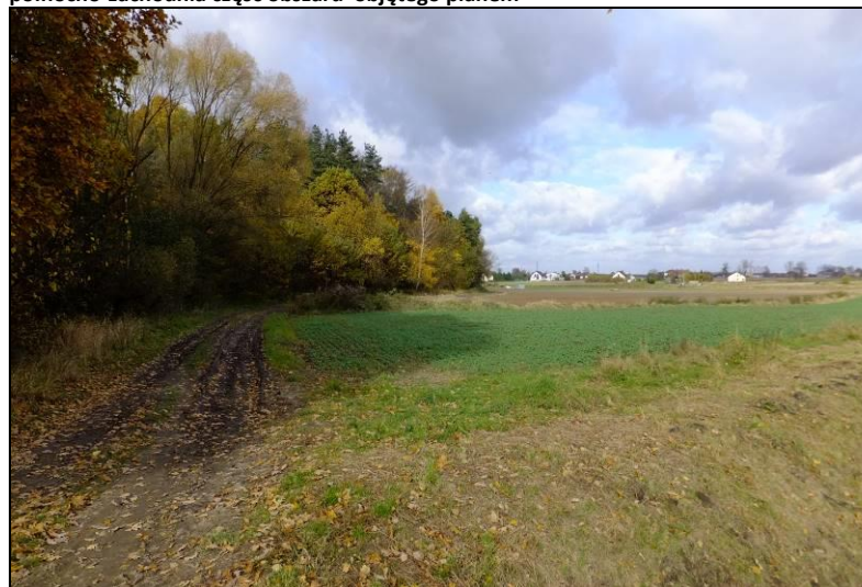
Fot. 8 Widok na tereny rolne na północ od kompleksu leśnego