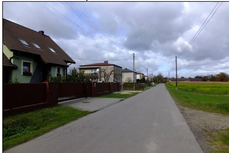
Fot. 4 Południowo-wschodnia część terenu, zabudowa w rejonie ul. Przejazdowej