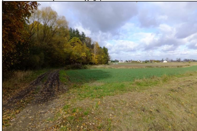
Fot. 8 Widok na tereny rolne na północ od kompleksu leśnego