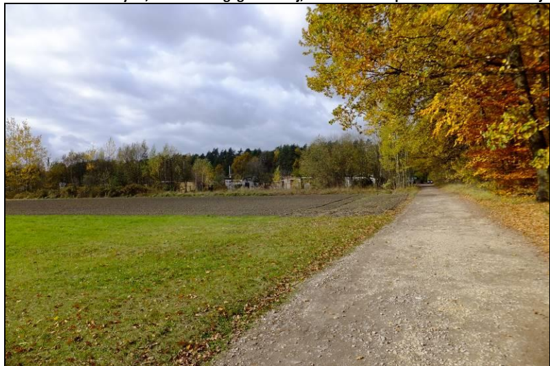
Fot. 6 Widok na ogródki działkowe po południowej stronie kompleksu leśnego