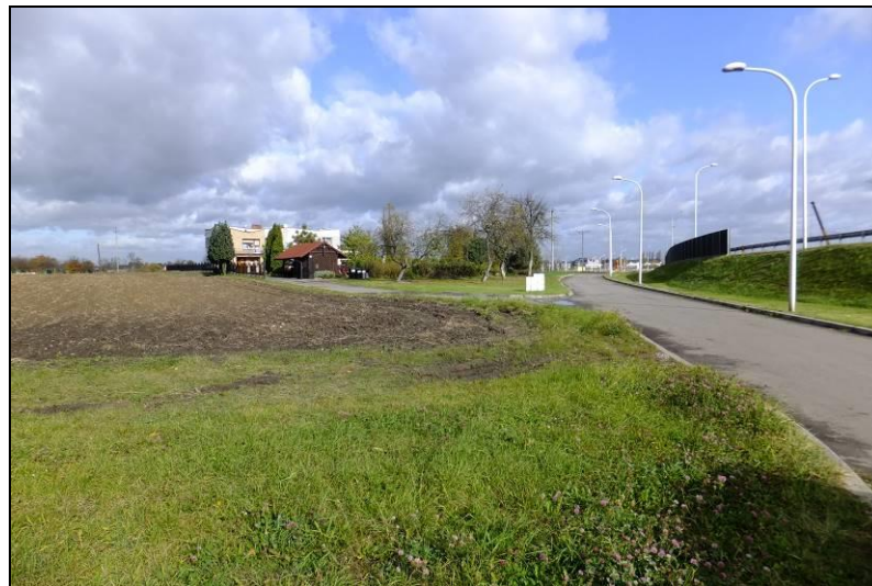
Fot. 3 Południowo-wschodnia część terenu