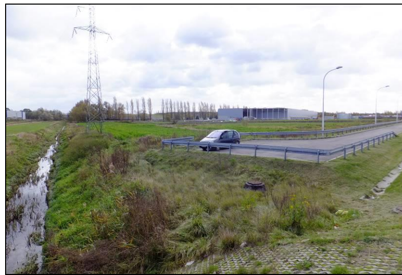
Fot. 4 Widok w kierunku południowo-wschodnim, na pierwszym planie widoczny Potok Tyski, na drugim planie nowo wybudowane obiekty magazynowe