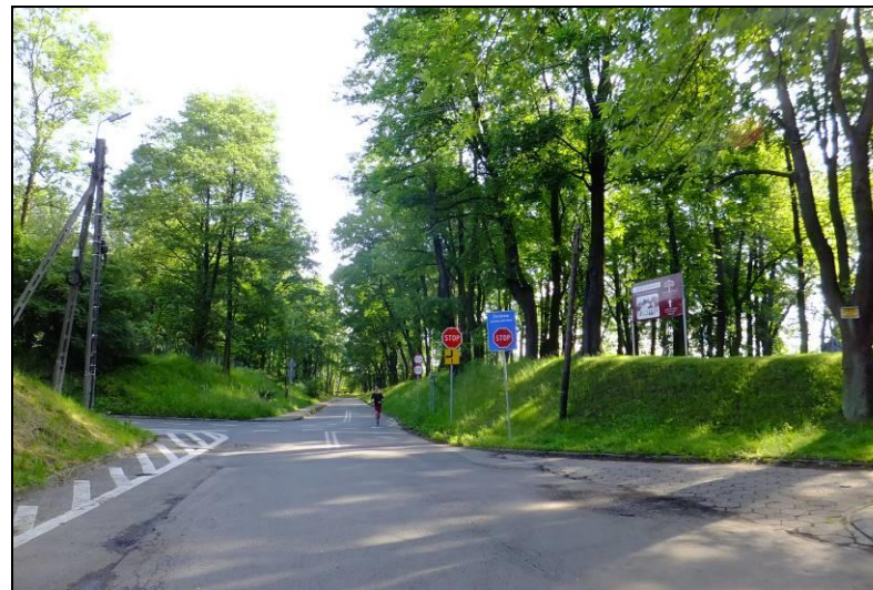
Fot. 4 Południowo-wschodnia część terenu opracowania, ul. Browarowa, zadrzewienia o charakterze parkowym