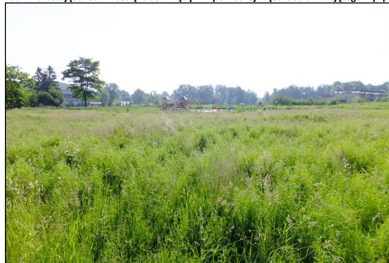
Fot. 8 Łąki od strony ul. Obywatelskiej, na drugim planie widoczny wybudowany ostatnio plac zabaw