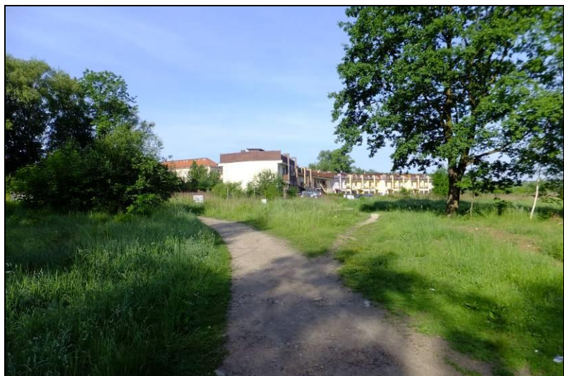
Fot. 5 Charakterystycznie wygięta w łuk zabudowa szeregowa w centralnej części obszaru