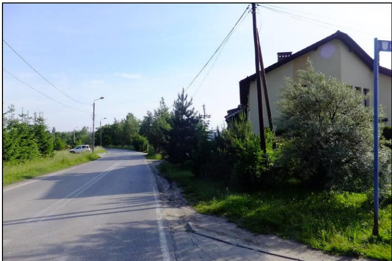
Fot. 1 Południowo-zachodnia granica opracowania, ul. Obywatelska