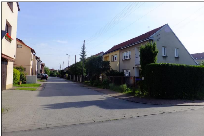
Fot. 2 Zabudowa w rejonie ul. Sosnowej, południowo-zachodnia część opracowania