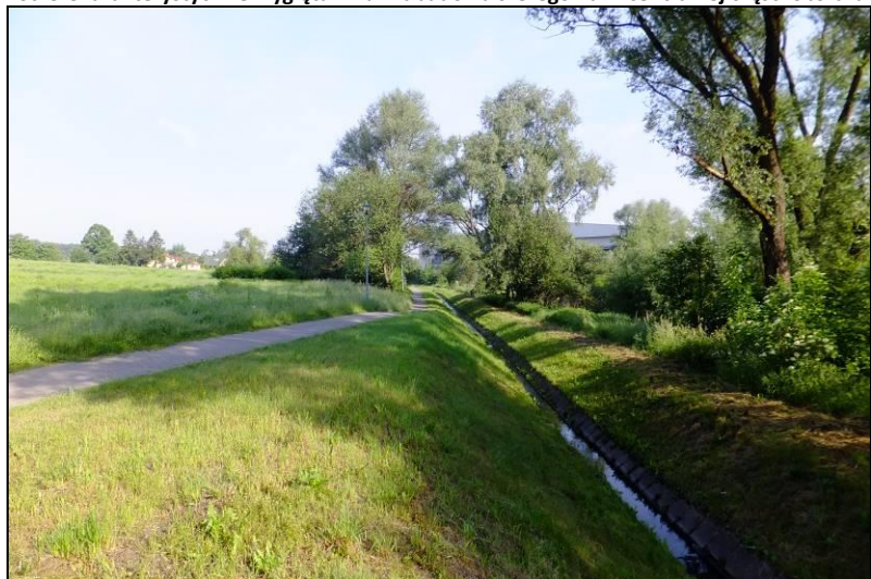
Fot. 6 Potok Tyski, północno-wschodnia część obszaru, widoczne pojedyncze zadrzewienia o charakterze łągowym