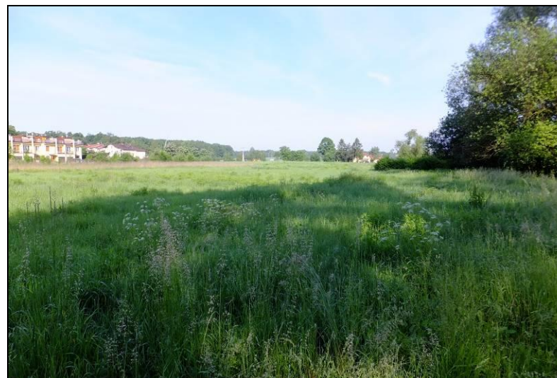
Fot. 7 Zarastające roślinnością ruderalną łąki w północnej części obszaru objętego mpzp