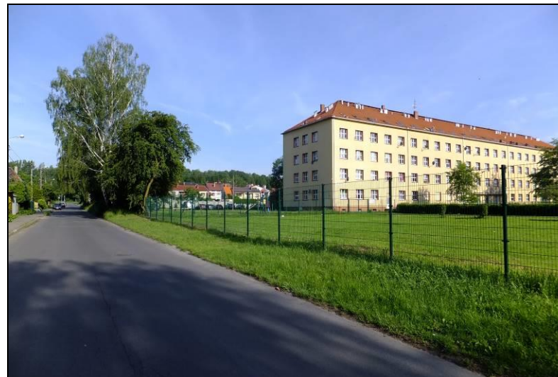
Fot. 3 Ul. Browarowa, zespół szkół nr 7