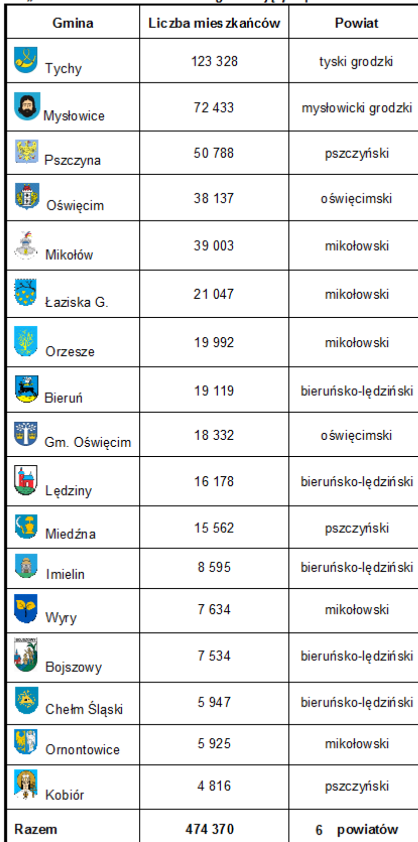
„Tabela 1. Liczba mieszkańców gmin objętych porozumieniem.

”