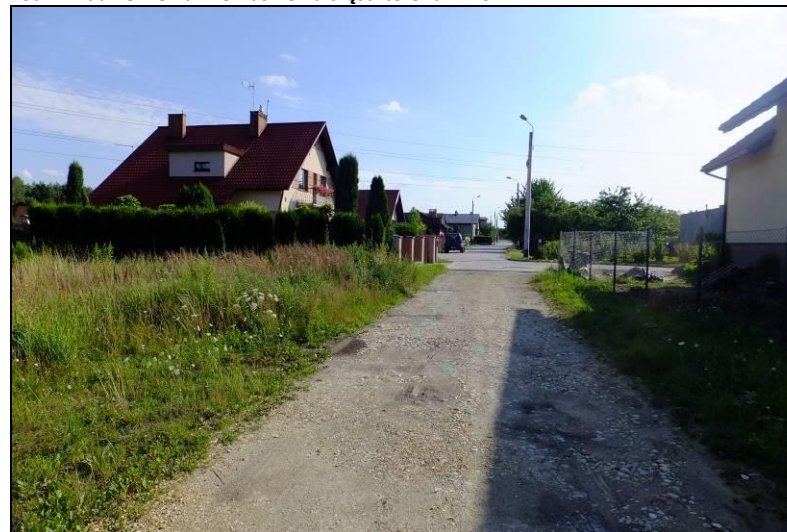
Fot. 12 Przykład zabudowy mieszkaniowej jednorodzinnej, ul. Modrzewiowa