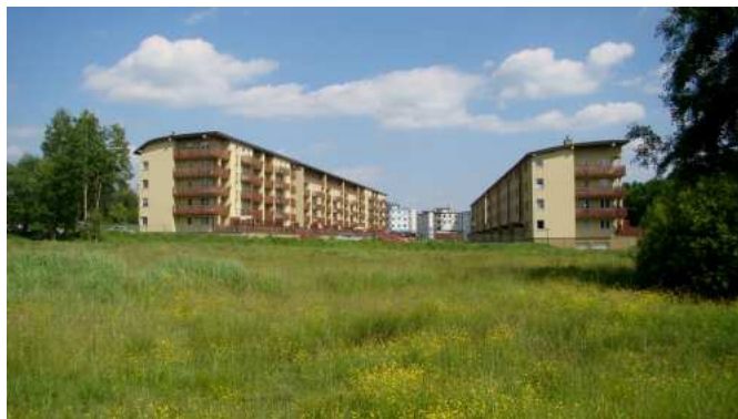
Widok na to samo osiedle – czerwiec 2011 rok.

W okresie zimowym, północna część terenu, w sąsiedztwie ulicy Sikorskiego wykorzystywana jest jako miejsce do składowania śniegu wywożonego z terenu miasta, co negatywnie wpływa na walory estetyczne i krajobrazowe – w terenie oprócz przyzmu śniegu widoczne są liczne śmieci, formy antropogeniczne – zdjęcie zrobiono w marcu 2011 roku.