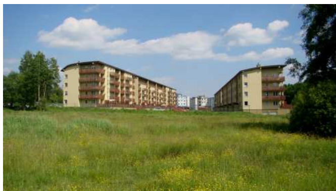
Widok na to samo osiedle – czerwiec 2011 rok.

W okresie zimowym, północna część terenu, w sąsiedztwie ulicy Sikorskiego wykorzystywana jest jako miejsce do składowania śniegu wywożonego z terenu miasta, co negatywnie wpływa na walory estetyczne i krajobrazowe – w terenie oprócz przyzmu śniegu widoczne są liczne śmieci, formy antropogeniczne – zdjęcie zrobiono w marcu 2011 roku.