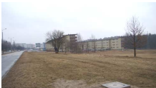
Widok na nowe osiedle wielorodzinne przy zachodniej granicy terenu – ma- rzec 2011 rok.