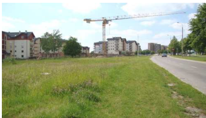
Widok na to samo osiedle – czerwiec 2011 rok – rozpoczęto budowę kolej- nego budynku.