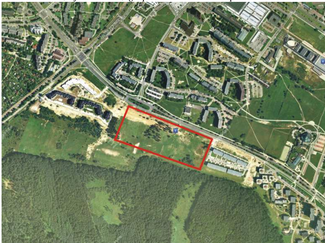
Rysunek 1 Lokalizacja i obecne zagospodarowanie terenu opracowania

Lokalizację i obecne zagospodarowanie analizowanego terenu przedstawia poniższy fragment ortofotomapy: