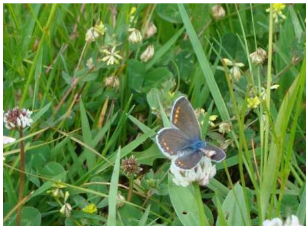
Modraszek Ikar ( Polyommatus ikarus )