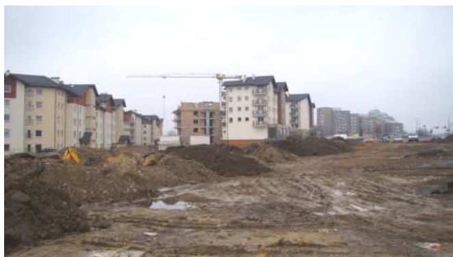
Widok na powstające osiedle wielo- rodzinne przy wschodniej granicy terenu – marzec 2011 rok.

Teren pełni po części funkcje przyrodnicze – w nawiązaniu do terenów leśnych rozciągają- cych się na południe od niego, jednocześnie jednak pozostaje pod dużą presją antropoge- niczną, inwestycyjną – po wschodniej i zachodniej stronie przedmiotowego terenu rozbudo- wują się osiedla wielorodzinne: