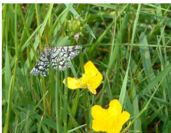
Witalnik naostrzak ( Chiasmia clathrata ).

W zachodniej części terenu, w rejonie gdzie tworzyły się lokalne podmokłości i stagnowała woda, w niedalekim sąsiedztwie lasu udało się zaobserwować żaby oraz rzekotkę drzewną ( Hyla arborea ) – gatunek ten najprawdopodobniej ma swoje siedliska w pobliskich lasach, za południową granicą analizowanego terenu.