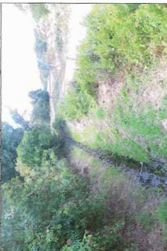
Fot. 4 Dolina Dopływu spod Mąkolowa, poza północną granicą terenu objętego planem