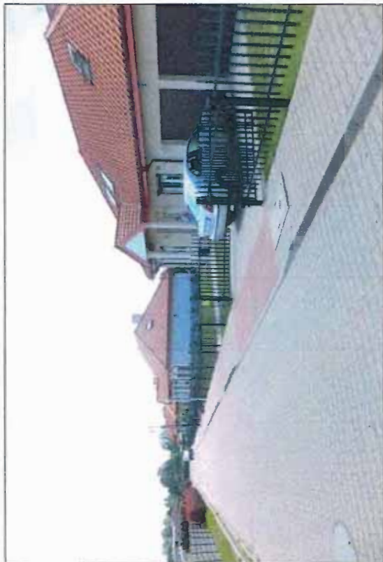
Fot. 1 Nowa zabudowa mieszkaniowa w rejonie ul. Flamingów