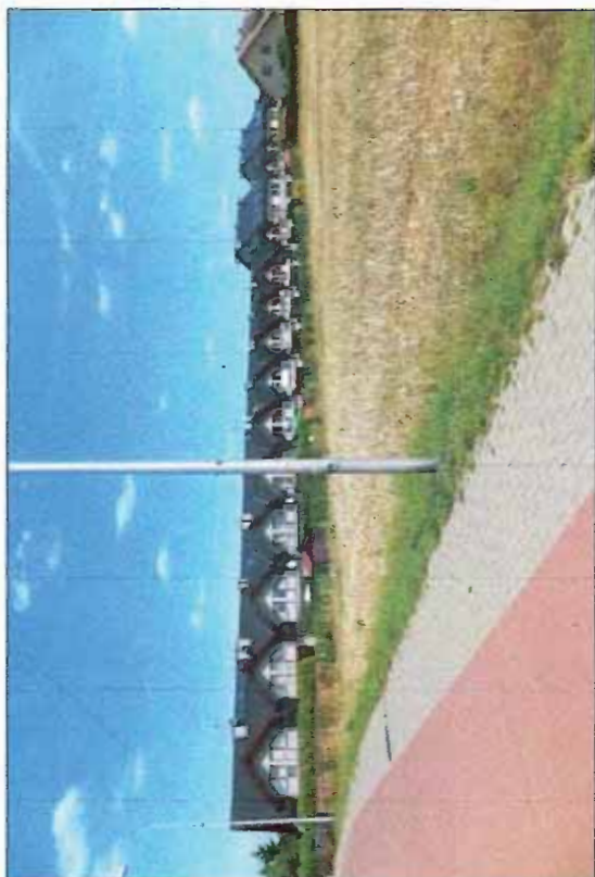
Fot. 3 Przykład zabudowy szeregowej w rejonie ul. Zielone Wzgórze