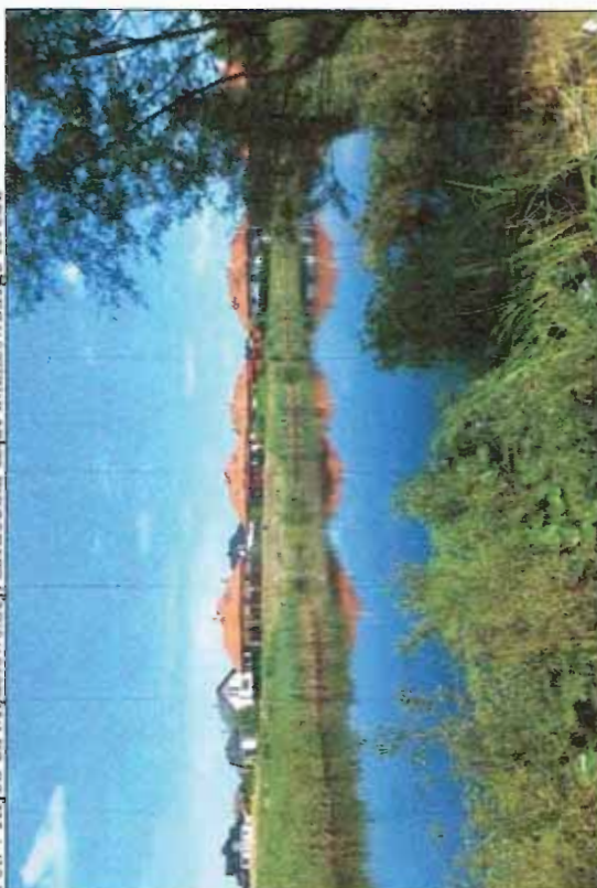
Fot. 8 Niewielki staw, pozostałość glinianki, staw ten znajduje się poza południową granicą opracowania