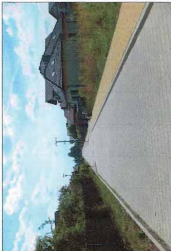
Fot. 5 Przykład zabudowy w rejonie ul. Albatrosów, północna część terenu objętego planem