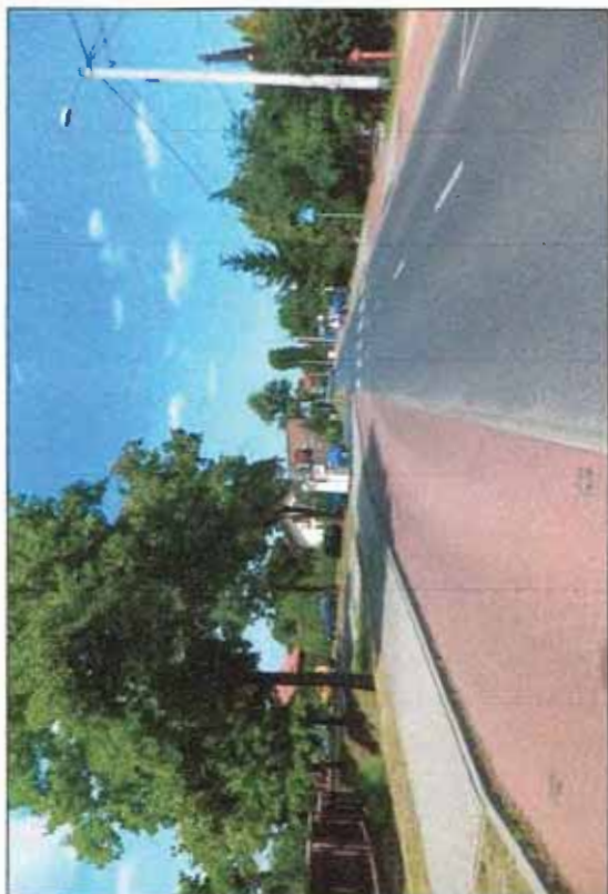
Fot. 7 Rejon ul. Makolowskiej, zachodnia część analizowanego terenu