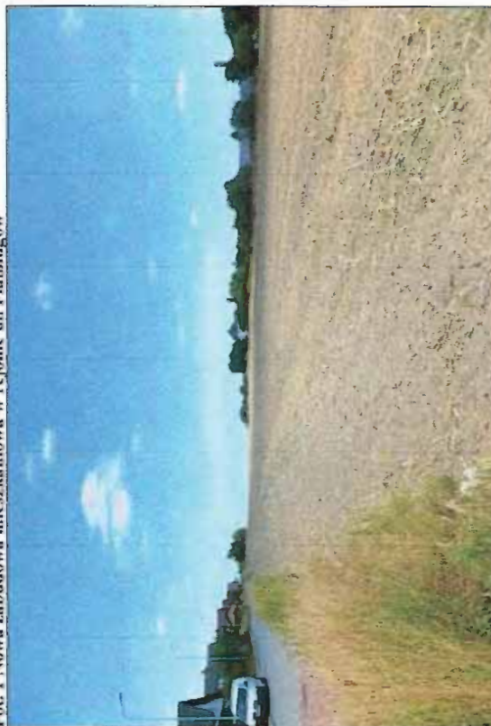
Fot. 2 Wschodnia część terenu, grunty orne