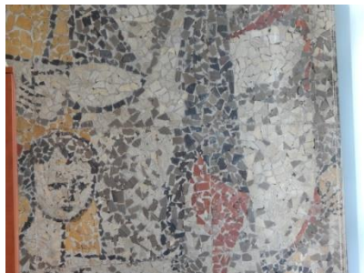
Budynek d. sklepu obówniczego „Chełmek” przy Al. Niepodległości