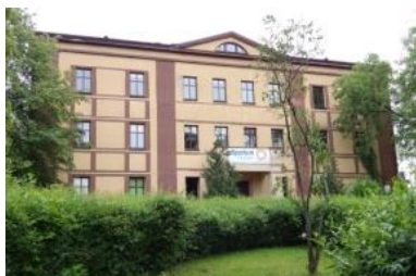
d. Dom gminny