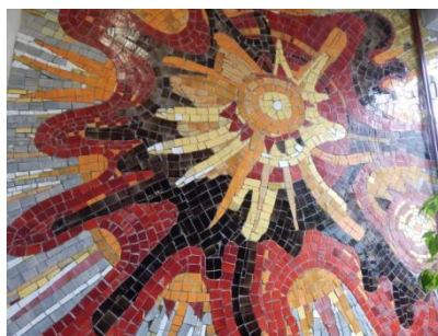
Budynek Szkoły podstawowej Nr 17 przy ul. Begonii