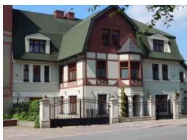
d. willa Drabika