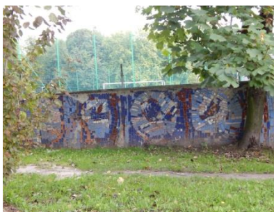
Ogrodzenie Szkoły podstawowej nr 18 przy ul. Grzegorza Fitelberga