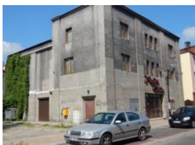
d. kino Helios