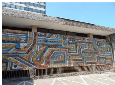
Budynek d. Zakładu Elektroniki Górnicy przy ul. Biskupa Burschego