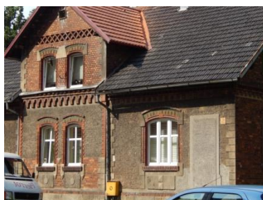
Budynek przy ul. Batorego 5