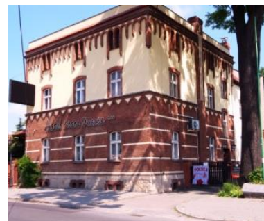
budynek pierwszego urzędu pocztowego