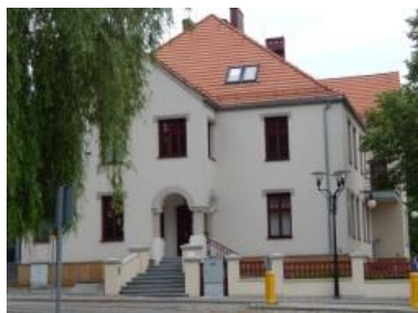
d. siedziba pierwszego urzędu gminnego