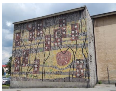
Budynek Teatru Małego przy ul. Ks. Kardynała Augusta Hlonda