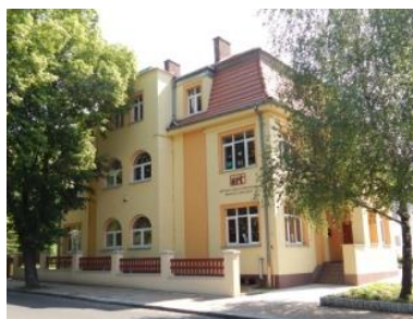
d. gminny dom mieszkalny