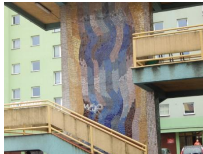
Pylon konstrukcji schodów pawilonu na oś. G przy ul. Kardynała Stefana Wyszyńskiego