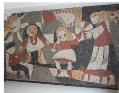
Budynek d. Szkoły podstawowej Nr 15 przy ul. Elfów