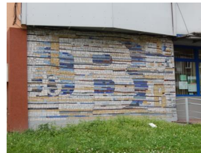
Budynek wielorodzinny z filią Biblioteki Miejskiej przy ul. Dąbrowskiego