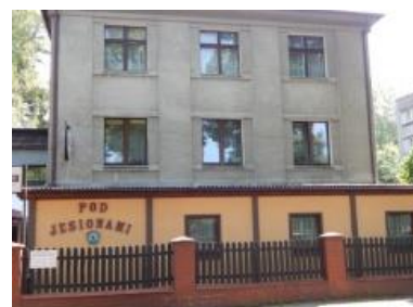
d. dom rodziny Wieczorków