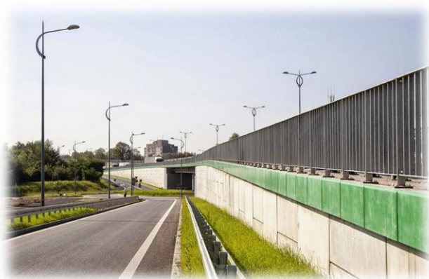
Źródło: Miejski Zarząd Ulic i Mostów

Konieczność przebudowy 6,4 km odcinka drogi wynika z niedostosowania do narastającego obciążenia ruchem tranzytowym i ciężkim, generując liczne zagrożenia.