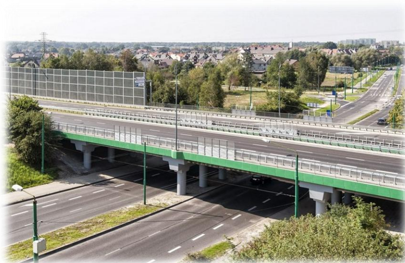
Źródło: Miejski Zarząd Ulic i Mostów

Realizacja powyższego zakresu wpłynęła na możliwość rozdzielenia ruchu lokalnego od tranzytowego, poprawiając warunki techniczne i funkcjonalne prowadzenia całego ruchu drogowego, z uwzględnieniem ruchu pieszego (budowa przejść podziemnych dla pieszych oraz rowerzystów).