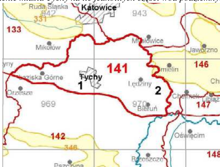
Rysunek 3 Położenie miasta Tychy na tle jednolitych części wód podziemnych (JCWPd)