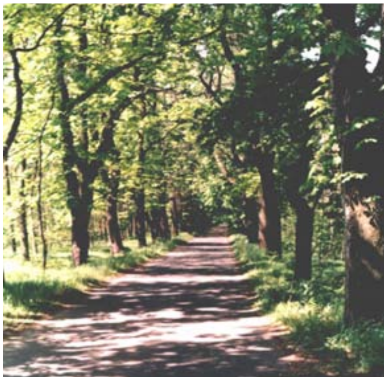
Fot. 15. Szosa Książęca – odcinek do Promnic

Na terenie Miasta Tychy projektowane są również dwa użytki ekologiczne: