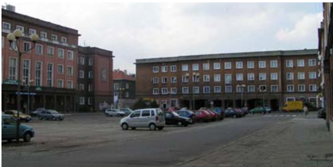
Fot. 2. Plac św. Anny na osiedlu A

Całość założenia osiedla dopełnia zaprojektowany oraz zrealizowany układ zieleni wysokiej i niskiej o charakterze szpalerowym.