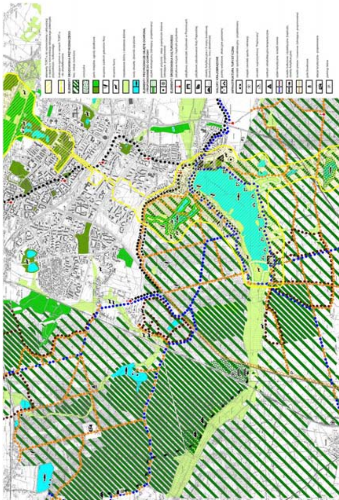
Rys.3. Potencjał przyrodniczo-kulturowy