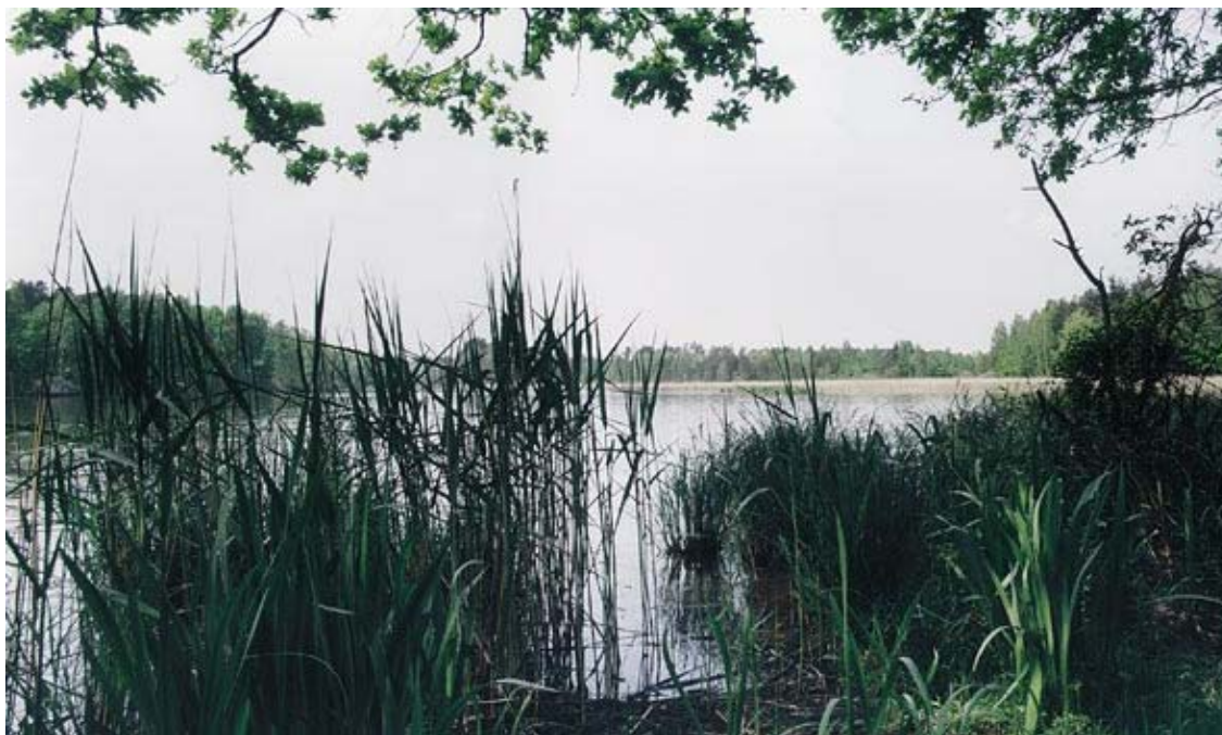
Fot. 6. Jezioro Paprocańskie

Jezioro pełni rolę rekreacyjnego akwenu wód I klasy czystości.