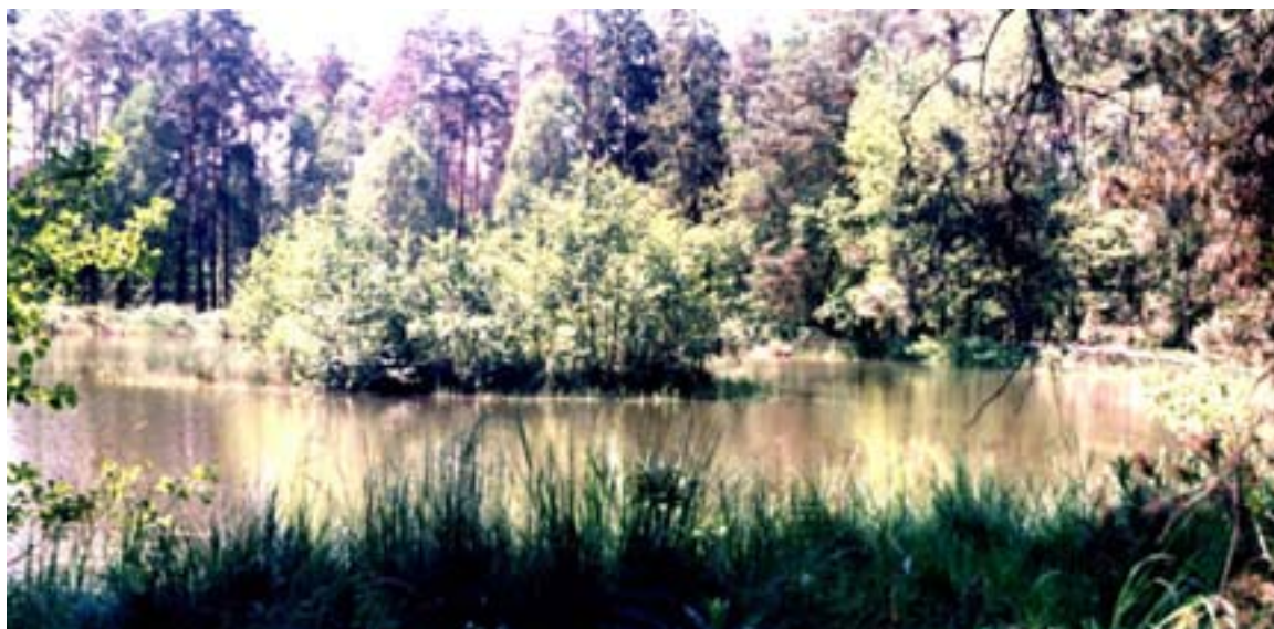
Fot. 11. Staw Bidermany

Ważnym obiektem dla flory i fauny jest Jezioro Paprocańskie, znajdujące się na granicy Miasta Tychy i Gminy Kobiór wraz z przylegającym do niego zabytkowym obiektem przyrodniczo-kulturowym, jakim jest Huta Paprocka.