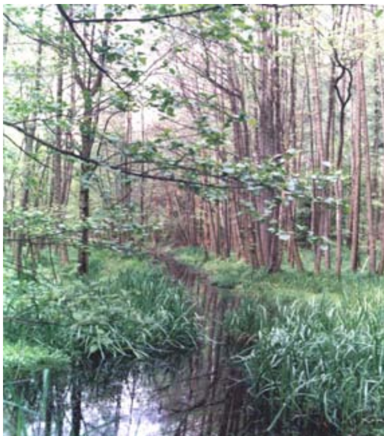
Fot. 13. Otoczenie Starego Stawu

Na wskazanym obszarze występują również rośliny objęte ochroną gatunkową.