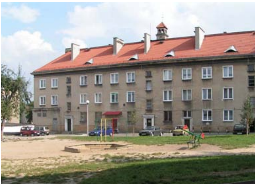
Fot. 18. Widok placu zabaw

W Tychach istnieją nadal słabo zorganizowane zbiorowości terytorialne, w których konstytutywną, a czasami jedyną cechą jest przypisana przestrzeń. W mieście mamy do czynienia z zespołem bloków urbanistycznych, usytuowanych w obrębie określonych granic miasta.