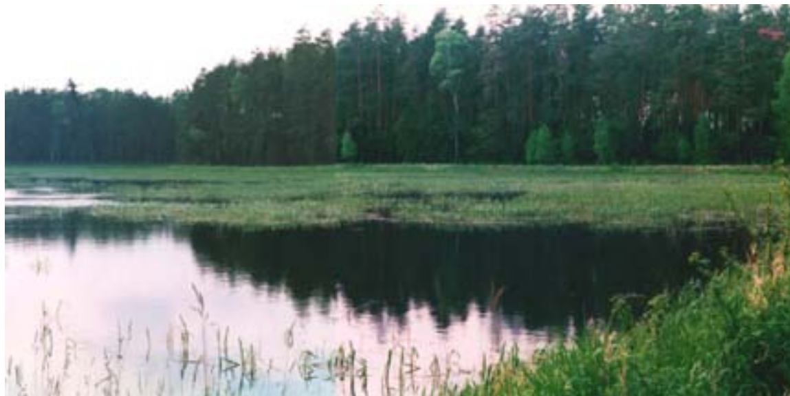
Fot. 10. Stary Staw

gatunki roślin i zwierząt zbiorowisk leśnych na kontynencie europejskim. Sąsiedztwo stawów zasiedlonych przez ptaki wodne, takie jak: łabędź niemy, łyśka, kokoszka czy krzyżówka, stanowi rzadko spotykany w środowisku wielkomiejskim przykład „wyspy ekologicznej” o najwyższych wartościach przyrodniczych.