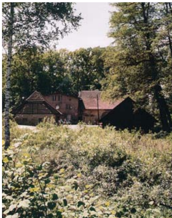
Fot. 14. Widok Huty Paprockiej

Huta Paprocka posiada równocześnie wartości przyrodnicze i kulturowe. Jej otoczenie stanowi zwarty i wyizolowany obszar rozciągający się pomiędzy korytem Gostynki, a kanałem spustowym wód z Jeziora Paprocańskiego. Od strony zachodniej zamyka ją wał zapory czołowej zbiornika wodnego. Powierzchnia tego obszaru wynosi około 1,8 ha. Ma ona kształt prostokąta o bokach 100 × 180 m. Na tym obszarze stwierdzono występowanie 180 gatunków roślin naczyniowych, z czego 14% przypadało na antropofity – taksony obce dla flory krajowej. Na terenie Huty Paprockiej przeważają zbiorowiska leśne. Największą powierzchnię zajmuje tu łęg olszowy Circaeo-Alnetum porastający przede wszystkim wilgotne obniżenie między Gostynką a zaporą czołową jeziora. Dominuje w nim drzewostan w średniej klasie wieku. Podstawowym gatunkiem jest olcha czarna (136 sztuk). Z krzewów znaczny udział osiąga dziki bez czarny.