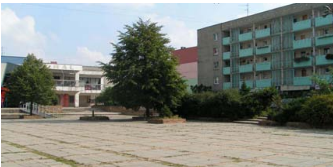
Fot. 21. Plac Korfantego – osiedle K jako przykład braku estetyki przestrzeni publicznej

Osiedla tyskie są zaniedbane infrastrukturalnie i ich program usługowo-handlowy jest niezwykle skromny. Przestrzeń jest tak ukształtowana, iż nie istnieją w niej ewentualne miejsca skupienia (skwery, klomby, alejki spacerowe).