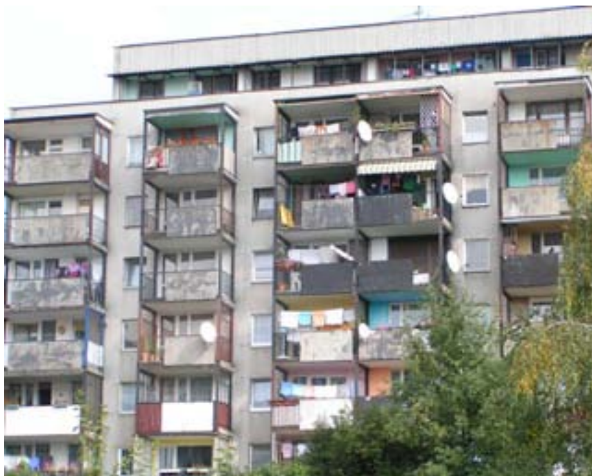
Fot. 20. Blokowiska na osiedlu U

Osiedla tyskie są zaniedbane infrastrukturalnie i ich program usługowo-handlowy jest niezwykle skromny. Przestrzeń jest tak ukształtowana, iż nie istnieją w niej ewentualne miejsca skupienia (skwery, klomby, alejki spacerowe).