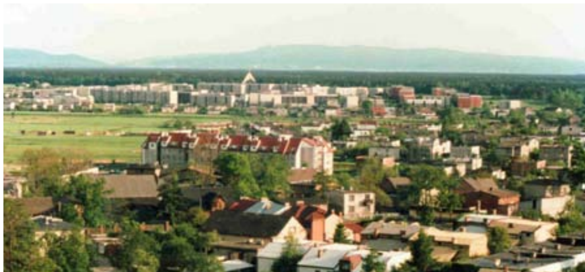
Fot. 1. Widok na Beskid Śląski od strony miasta

Miasto charakteryzuje korzystne położenie w systemie przyrodniczym aglomeracji śląskiej. Naturalne otoczenie, a tym samym wydzielenie krajobrazowe Tychów, stanowią kompleksy Leśnego Pasa Ochronnego oraz prastarej Puszczy Pszczyńskiej. Sąsiedztwo lasów Puszczy Pszczyńskiej, sprawia, że miasto posiada bardzo dobre w stosunku do innych dużych miast aglomeracji śląskiej warunki przyrodnicze i ekologiczne. Stwarza to szczególnie korzystne warunki do rozwoju usług turystycznych i sportowo-rekreacyjnych.