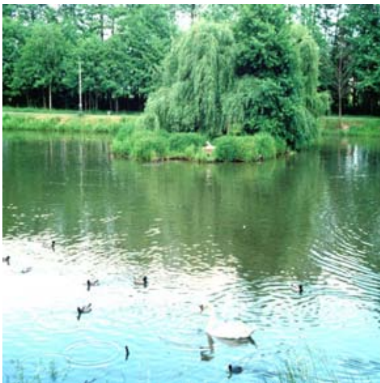
Fot. 4. Park Północny