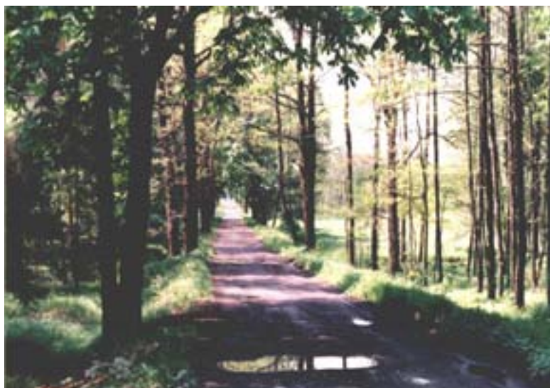
Fot. 9. Droga do gajówki w Wyrach

W środowisku przyrodniczym Tychów duże zasoby faunistyczne związane są z lasami murckowskimi i pszczyńskimi, których fragmenty należą lub przylegają do miasta.