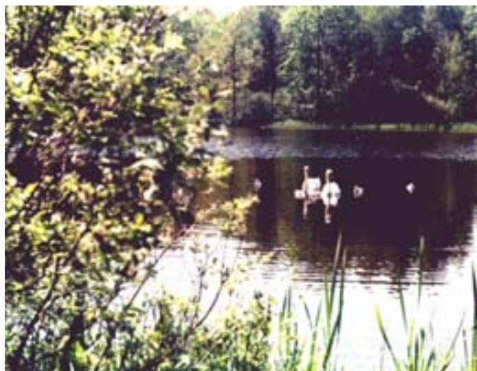
Fot. 8. Paprocany – fragmenty stawów śródleśnych

Natomiast do wartości rzadkich zaliczono zbiorowiska leśne łągów olchowo-jesionowych i wiązowo-jesionowych, olsów i borów bagiennych oraz nieleśne zbiorowiska łąk, zbiorowisk torfowiskowych, bagiennych, szuwarowych i wodnych. Wartości te zajmują 20% powierzchni miasta.