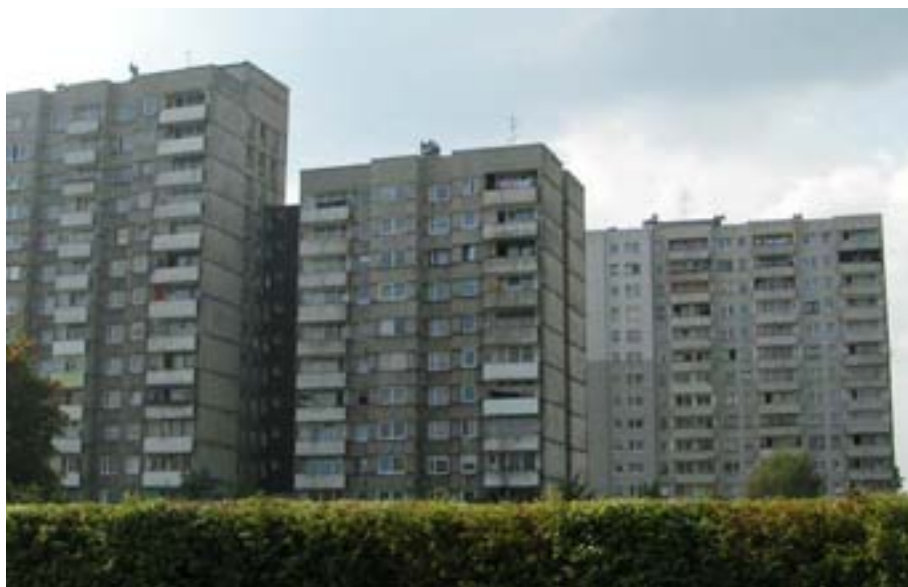
Fot. 17. Zbiór blokowisk jako odspoleczniona forma architektoniczna

Budowę Nowego Miasta Tychy rozpoczęto od budowy północnej części miasta, tj. osiedli: