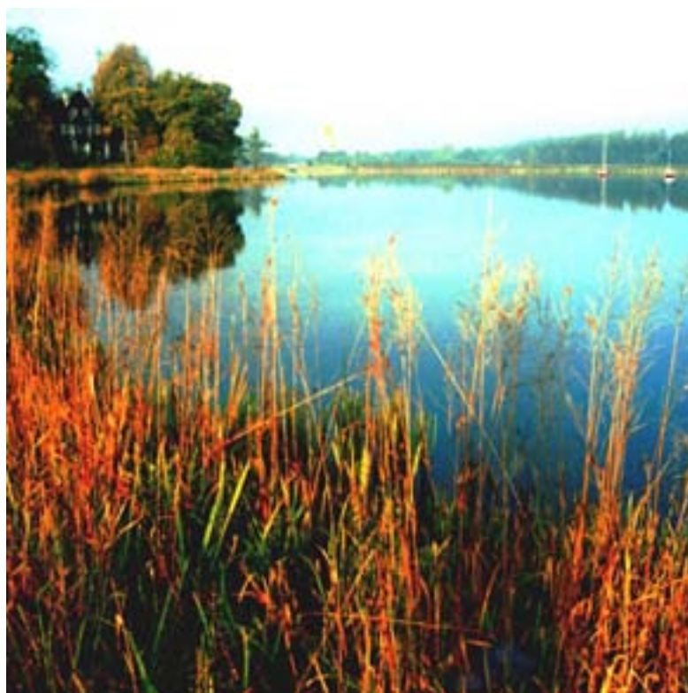
Fot. 12. Jezioro Paprocańskie

Wskazany obszar wymaga jednak inwestycji w zakresie infrastruktury związanej z rozwojem funkcji turystycznych, rekreacyjnych i kulturalnych, które będą miały bezpośredni związek ze wzrostem gospodarczym i wzrostem zatrudnienia.