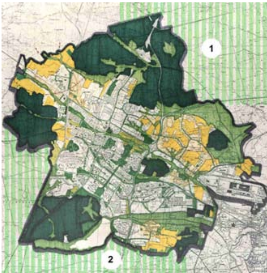
Rys. 1. Miejski system terenów otwartych

po między lasami katowicko-murckowskimi, a rozległymi kompleksami Puszczy Pszczyńskiej.