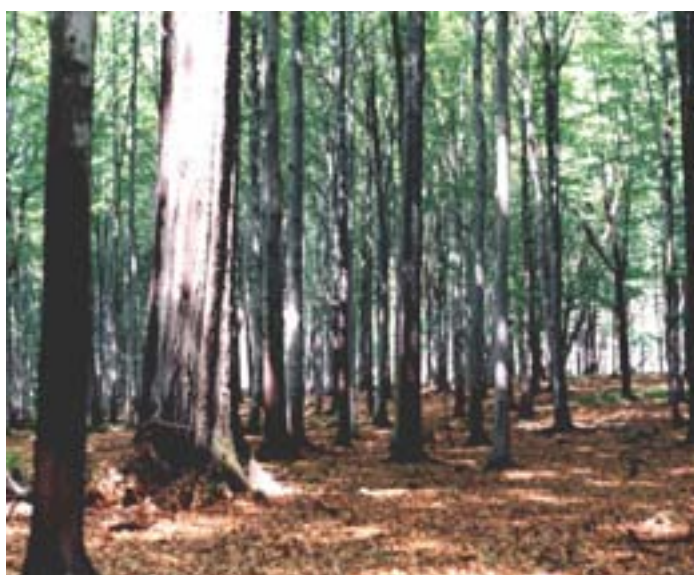
Fot. 5. Uroczysko – fragment lasu bukowego

Obszar zajmowany przez lasy na terenie miasta wynosi 2 197 ha. Tychy otoczone są dużymi kompleksami lasów: Leśnym Pasem Ochronnym oraz kompleksami leśnymi pozostałymi po Puszczy Pszczyńskiej. Ogrody działkowe są ważnym elementem pasm ekologicznych. Powierzchnia miasta zajmowana przez ogródki działkowe wynosi 158,7 ha.