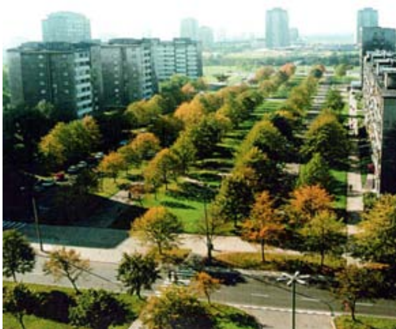
Fot. 3. Oś zielona