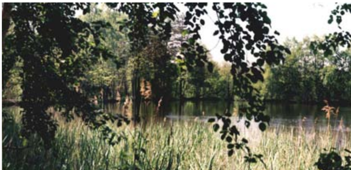
Fot. 7. Paprocany – fragmenty stawów śródleśnych

Miasto Tychy pokrywają następujące formacje roślinne: zbiorowiska ruderalne na terenach zabudowanych i nieużytkach, lasy i zadrzewienia, zbiorowiska pól uprawnych, łąki oraz torfowiska, parki, sady, zbiorowiska wód otwartych oraz szuwarowe i bagienne.