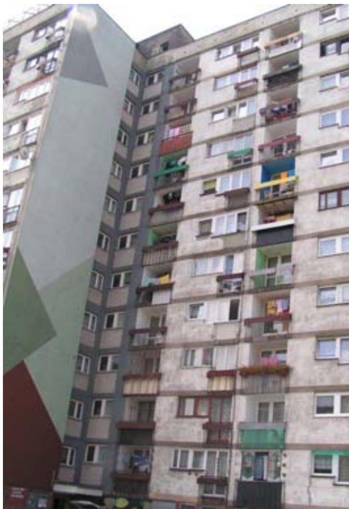
Fot. 19. Blokowiska na osiedlu M

Podobnie jak w innych częściach miasta, sprowadzona na ten teren ludność była ze względu na miejsce pochodzenia, zróżnicowana kulturowo i społecznie heterogeniczna. Jedynym czynnikiem skupiającym i integrującym była przestrzeń bloków urbanistycznych. Wymogiem bliskości społecznej i zacieśniania się stosunków sąsiedzkich jest wspólna praca lub nauka, uczestnictwo w rozmaitych związkach, klubach, zrzeszeniach i stowarzyszeniach, uczestnictwo w różnego rodzaju formach rozrywki, uczestnictwo w kulturze, życiu społeczno-towarzyskim. Ogromną rolę w tak rozumianym procesie konsolidacji zbiorowości terytorialnej odegrać mogła społecznie wytworzona przestrzeń, jednakże aranżacja przestrzeni w Tychach właściwych umożliwia jedynie pogłębienie stosunków społecznych w przestrzeni handlowej i usługowej.