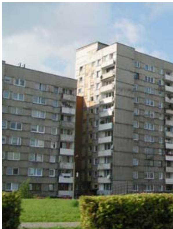
Fot. 16. Budynki nowego miasta

Powojenna architektura przejawiała się także w takiej rekonstrukcji przestrzeni, która podkreślała społeczny egalitaryzm i ograniczała zindywidualizowane zachowania lub działania. Brak elementarnej wiedzy socjologicznej doprowadził do powstania odspolecznionych form architektonicznych, zbioru blokowisk, w których wytworzona przestrzeń uniemożliwiała realizację takich wartości jak: więź społeczna, sąsiedztwo, poczucie przynależności do miasta, itp. Stworzenie wielkich bloków urbanistycznych, a w istocie luźno ze sobą powiązanych blokowisk nie sprzyjało powstawaniu zwartego organizmu przestrzenno-społecznego. Tychy od samego początku są niedoinwestowane, jeżeli chodzi o kina, kluby, kawiarnie, restauracje, czy dobrze zagospodarowane tereny rekreacyjne.