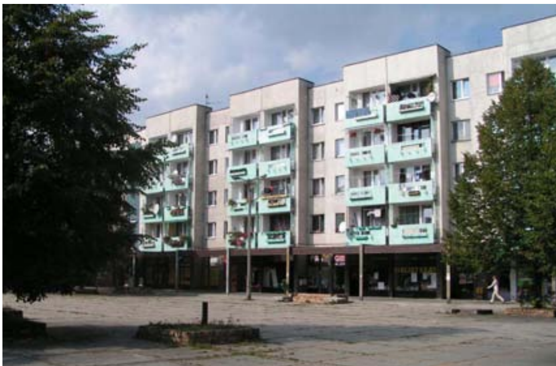
Fot. 22. Plac Korfantego – osiedle K, wymagający modernizacji

Centrum blokowisk często bywa wykorzystywane na rozległe parkingi. Brak przestrzeni handlowo-usługowej kompensowany jest przez przenoszenie codziennych aktywności do centrum handlowego miasta lub nawet innych miast, w których pracują mieszkańcy blokowiska. Takie transportowanie aktywności poza obszar zamieszkania pogłębia anonimowość i sprzyja zamknięciu w przestrzeni mieszkania.