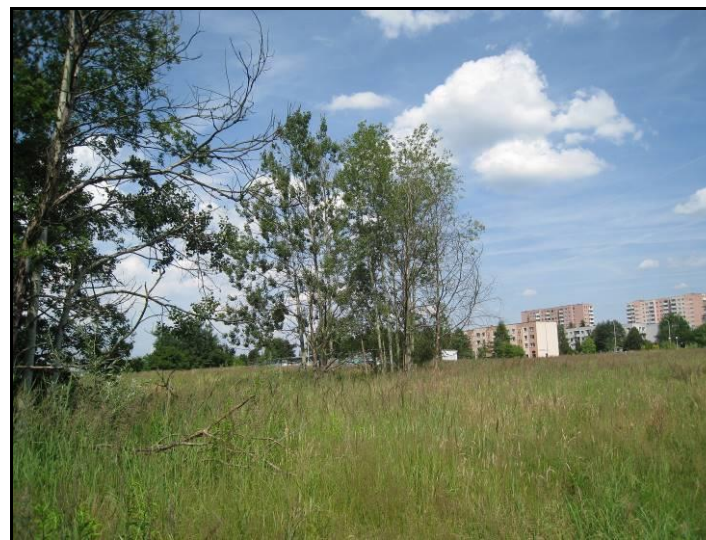
Fot. 11 Nieużytki w południowo-zachodniej części terenu