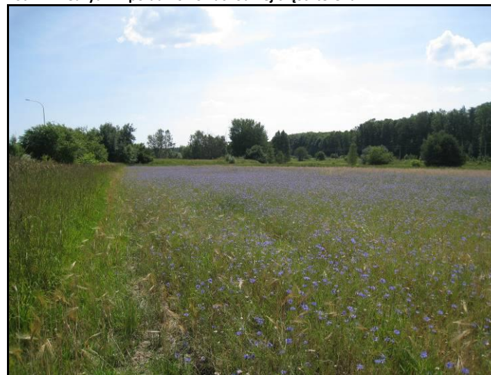
Fot. 12 Tereny rolne w północnej części terenu