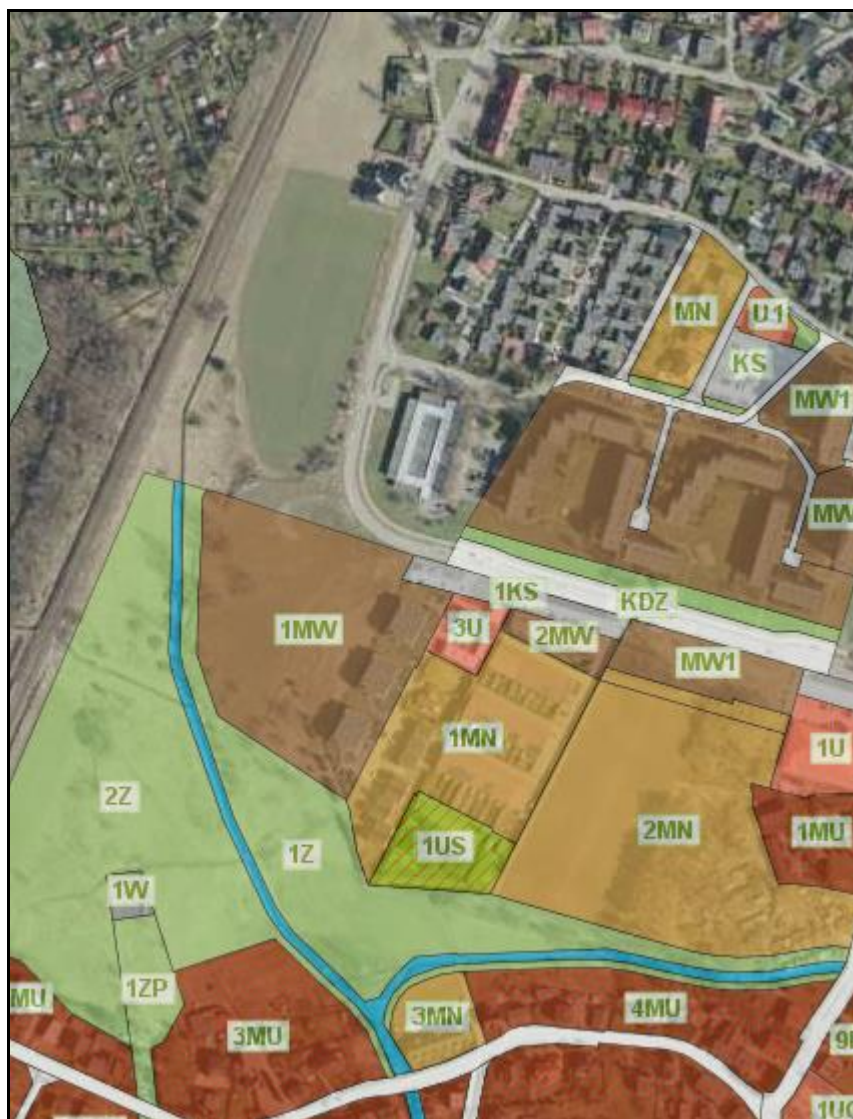
Rysunek 1 Przeznaczenia terenów na podstawie obowiązującego mpzp na podstawie geoportal.gov