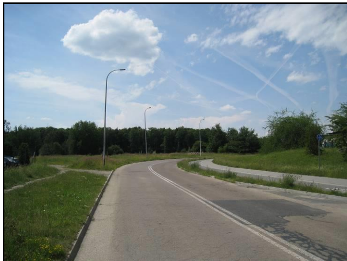
Fot. 1 Ul. Jaśkowska poza wschodnią granicą terenu, widok w kierunku zachodnim