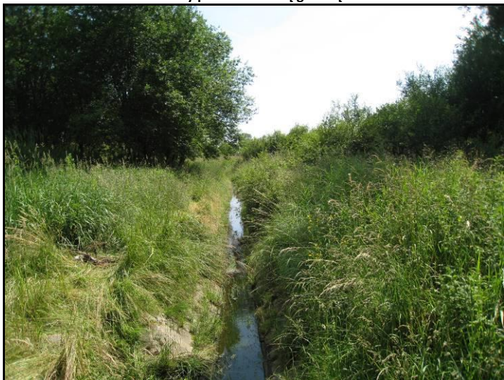
Fot. 10 Dolinka ciekui bez nazwy poza zachodnią granicą terenu