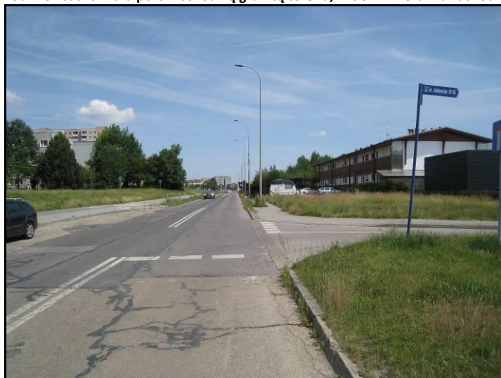
Fot. 2 Ul. Jaśkowska poza wschodnią granicą terenu, widok w kierunku wschodnim