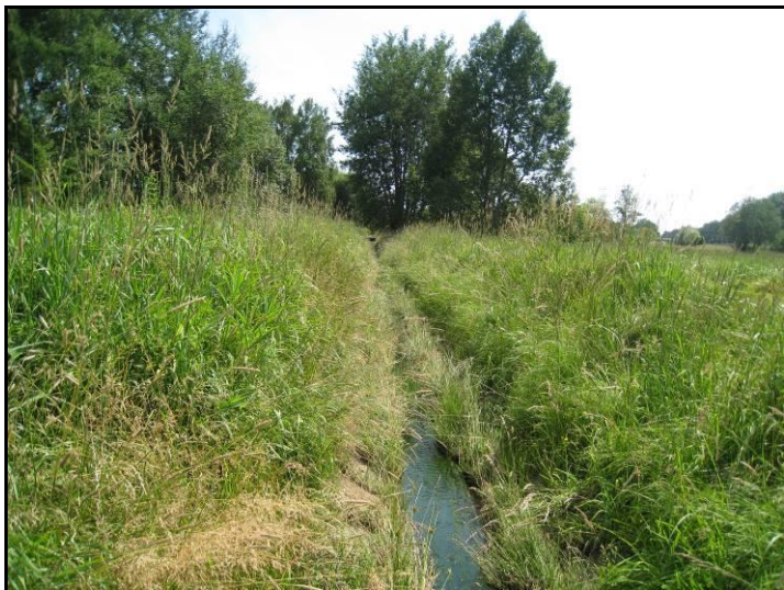
Fot. 9 Dolinka ciekui bez nazwy poza zachodnią granicą terenu