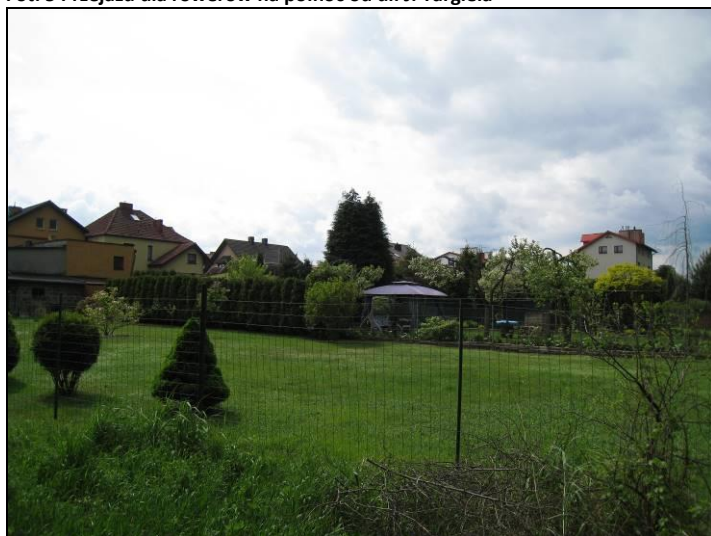
Fot. 6 Duże powierzchnie przydomowych ogrodów na zapleczu zabudowy jednorodzinnej w dolinie Gostyni