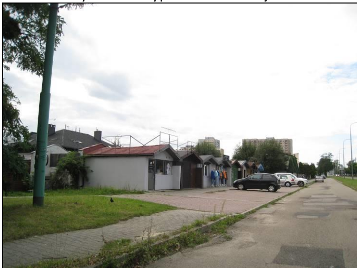
Fot. 6 Analizowany teren od strony północno-wschodniej