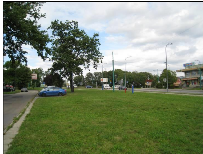
Fot. 3 Teren zieleni od strony ul. Armii Krajowej