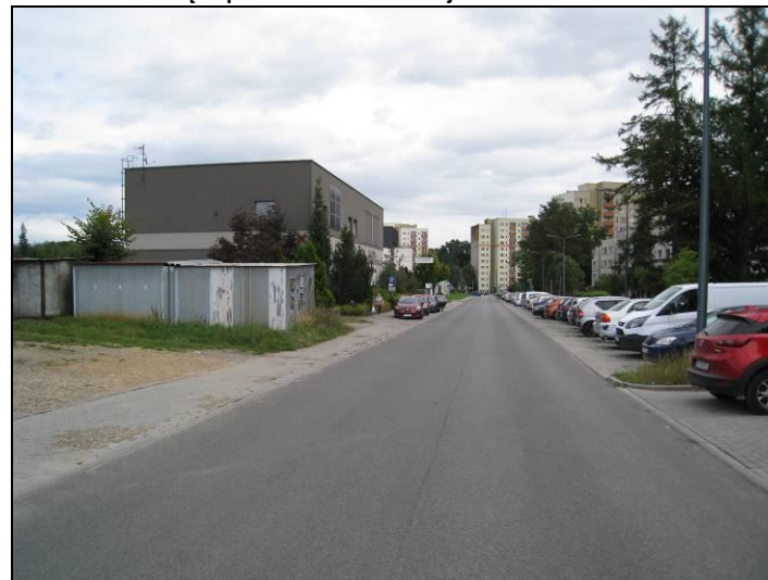
Fot. 8 Ul. E. Orzeszkowej, południowa część terenu