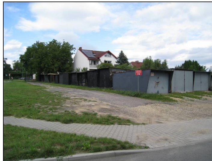
Fot. 7 Garaże w części południowo-zachodniej