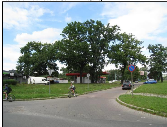
Fot. 4 Wschodnia część terenu