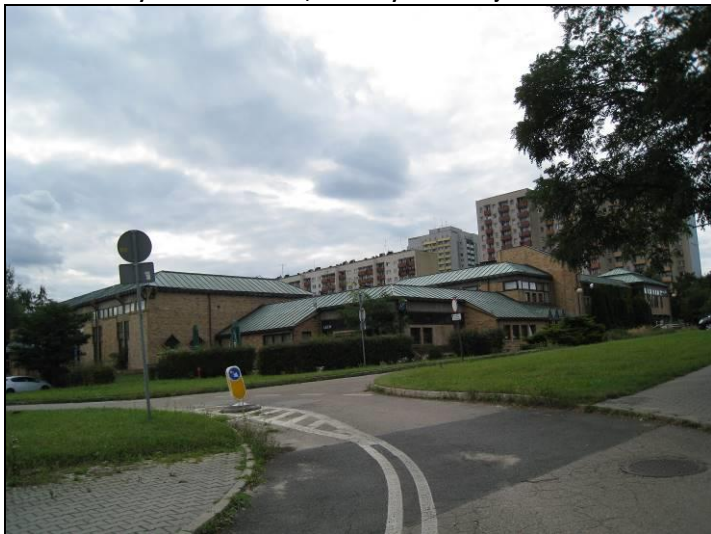
Fot. 2 Budynek z Domem Kultury, widok od strony wschodniej