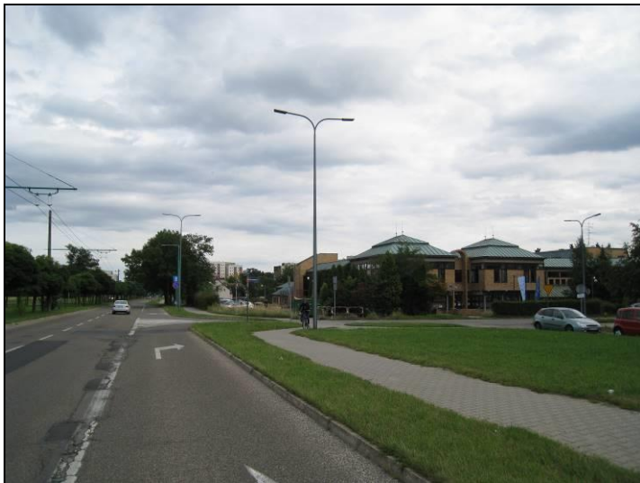
Fot. 1 Budynek w którym mieści się m.in. Dom Kultury, widok od strony Alei Jana Pawła II, od strony zachodniej