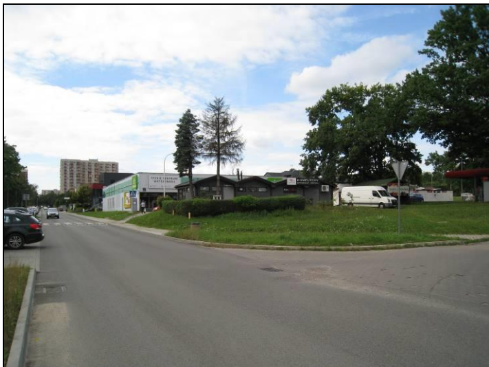
Fot. 5 Analizowany teren od strony południowo-wschodniej