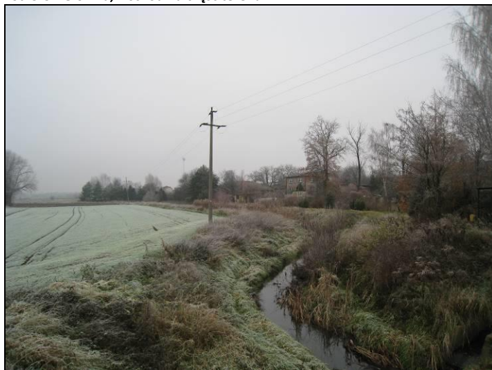
Fot. 6 Potok Tyski widziany z ul. Głównej