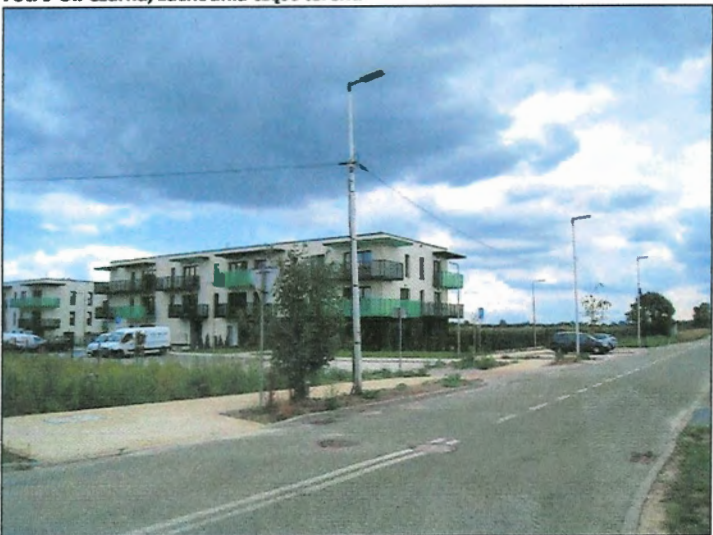
Fot. 10 Nowopowstała zabudowa wielorodzinna przy ul. Lawendowej, północno-zachodnia część terenu