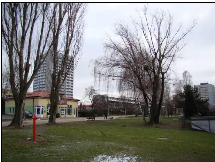
Fot. 5 Centralna część analizowanego terenu, widok w kierunku wschodnim