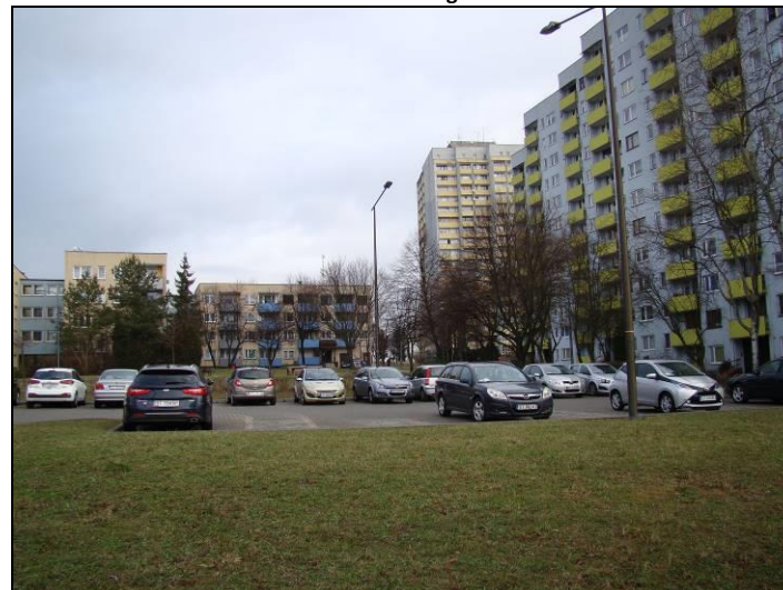
Fot. 4 Widok na południową część analizowanego terenu