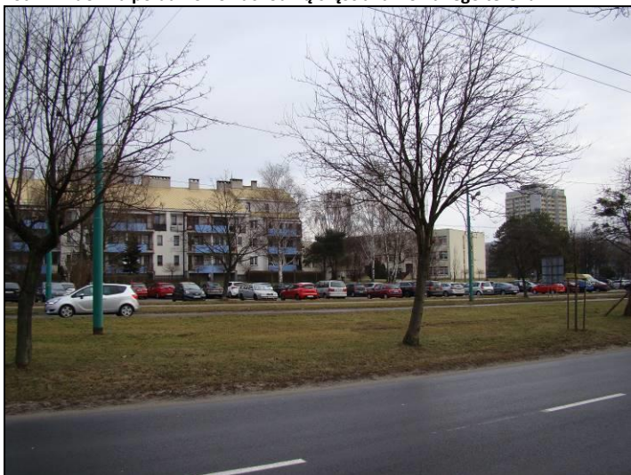
Fot. 2 Widok na południowo-wschodnią część analizowanego terenu