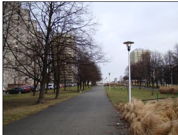
Fot. 3 Oś Zielona na wschód od analizowanego terenu