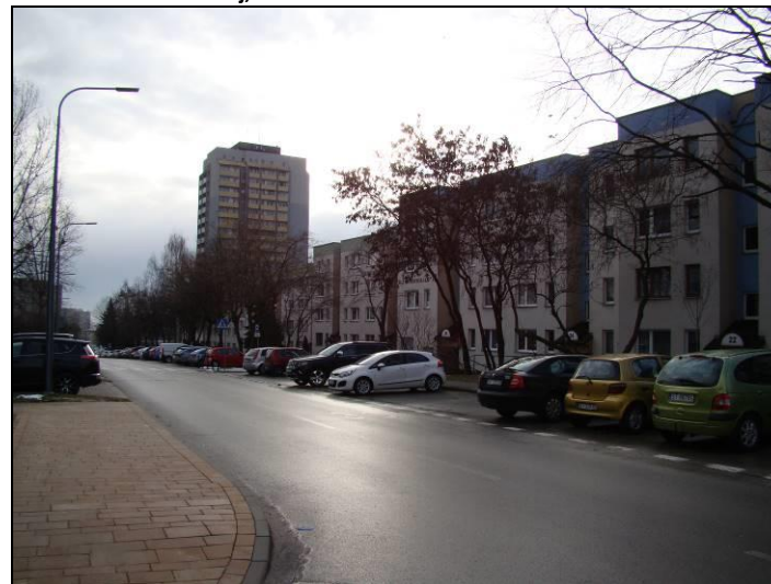
Fot. 8 Ul. Z. Nałkowskiej, widok w kierunku wschodnim