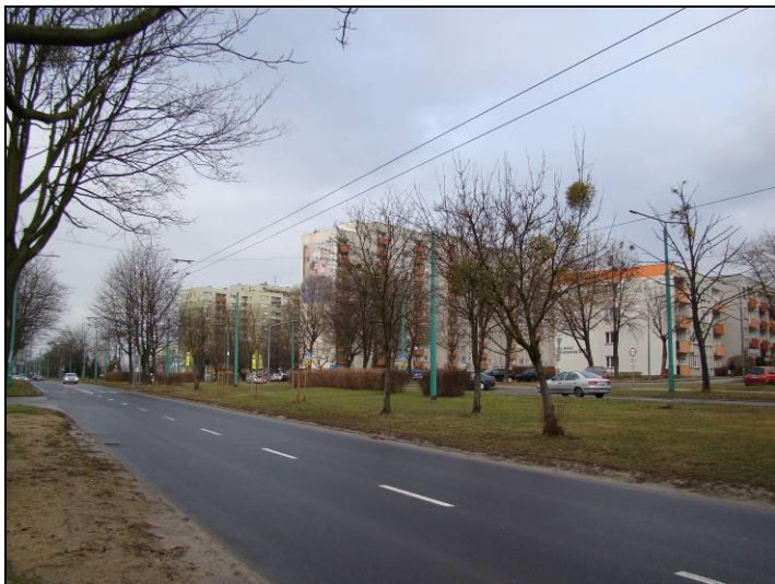
Fot. 1 Widok na południowo-zachodnią część analizowanego terenu