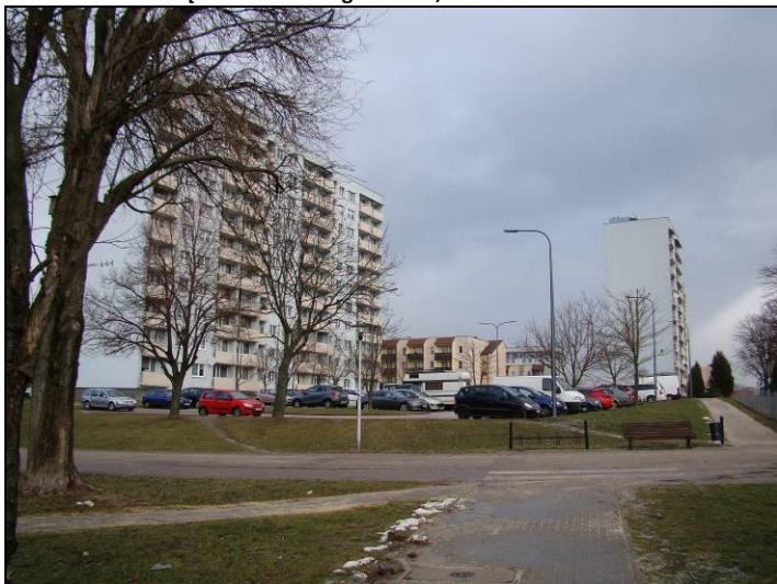
Fot. 6 Centralna część analizowanego terenu, widok w kierunku wschodnim