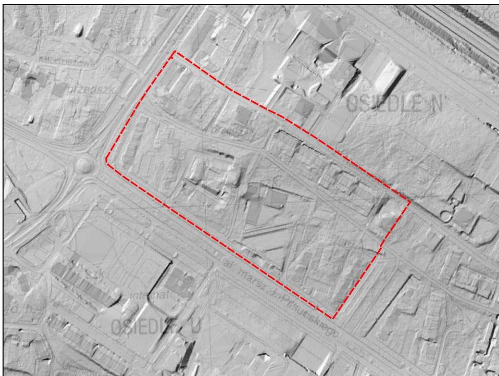
Rysunek 1 Ukształtowanie terenu na podstawie Numerycznego Modelu Terenu