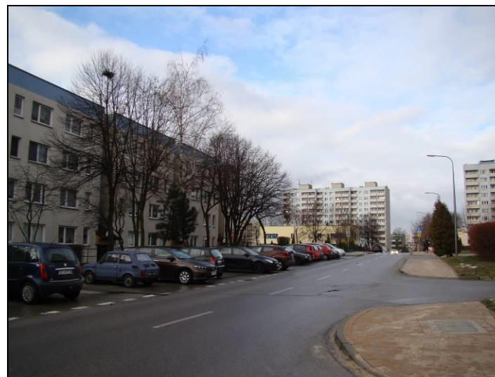
Fot. 7 Ul. Z. Nałkowskiej, widok w kierunku zachodnim