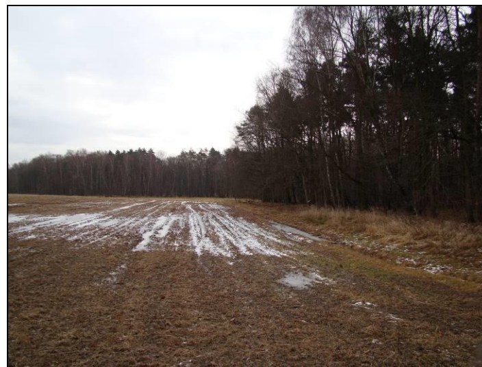
Fot. 15 Północna część obszaru