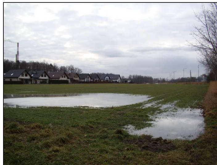
Fot. 11 Tereny rolne pomiędzy ul. Frycza-Modrzewskiego i ul. Beskidzkiego