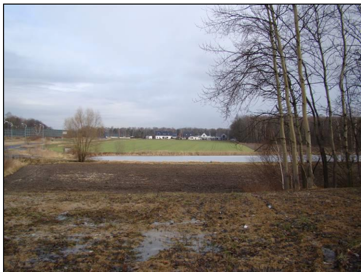
Fot. 5 Widok w kierunku północnym na Staw Grabowiec