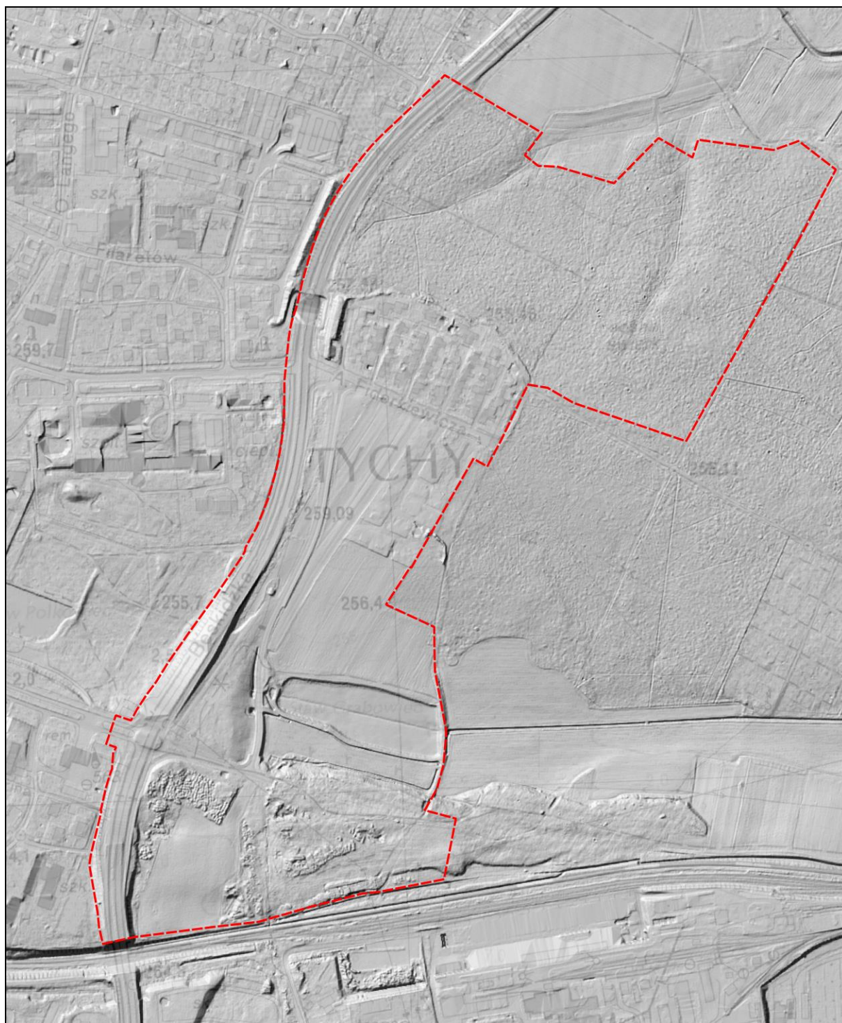
Rysunek 1 Ukształtowanie terenu na podstawie Numerycznego Modelu Terenu