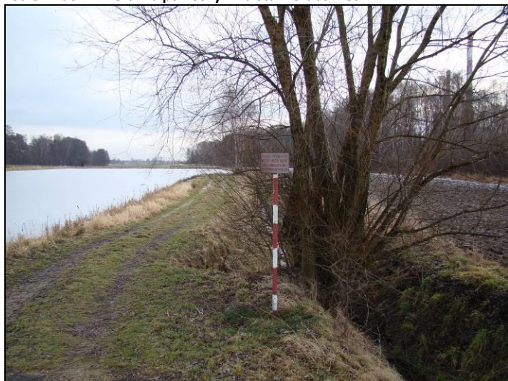
Fot. 6 Staw Grabowiec, widok w kierunku wschodnim