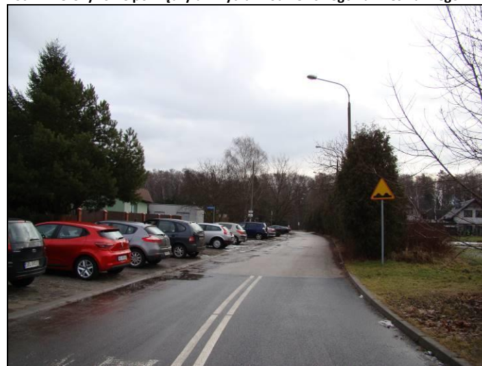
Fot. 12 Ul. Frycza-Modrzewskiego, północna część obszaru