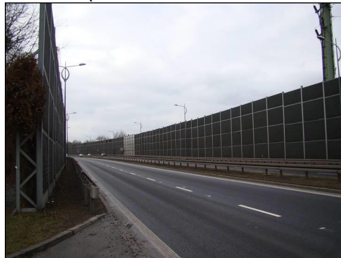
Fot. 16 Ul. Beskidzka, zachodnia granica obszaru