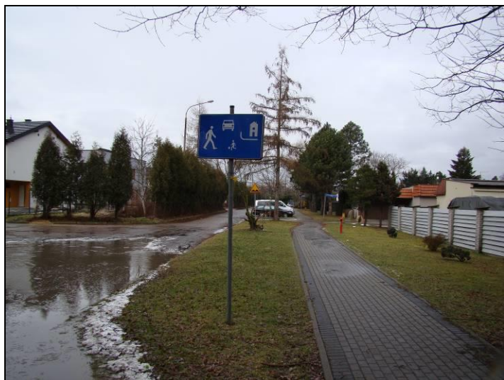
Fot. 13 Zabudowa w rejonie ul. Frycza-Modrzewskiego