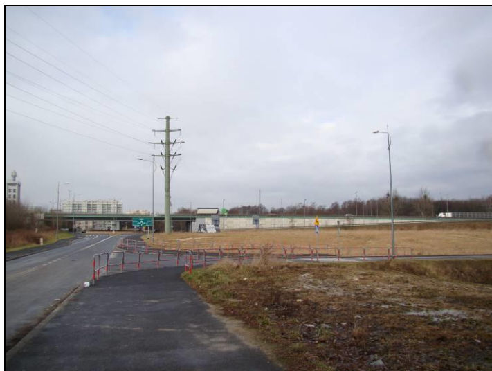
Fot. 9 Południowa część terenu, widok w kierunku zachodnim