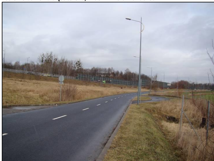
Fot. 10 Nowo powstała droga w zachodniej części obszaru