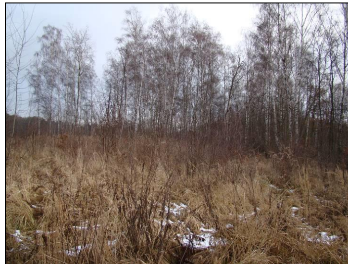
Fot. 3 Teren zadrzewień w południowej części obszaru