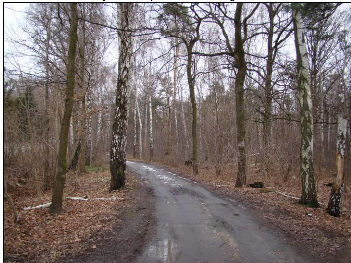
Fot. 14 Teren leśny w północno-wschodniej części obszaru