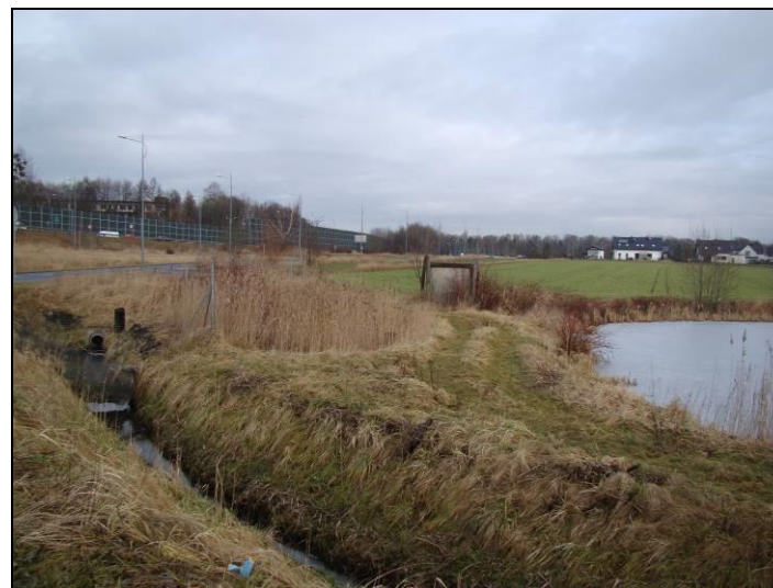
Fot. 7 Zachodnia część stawu Grabowiec