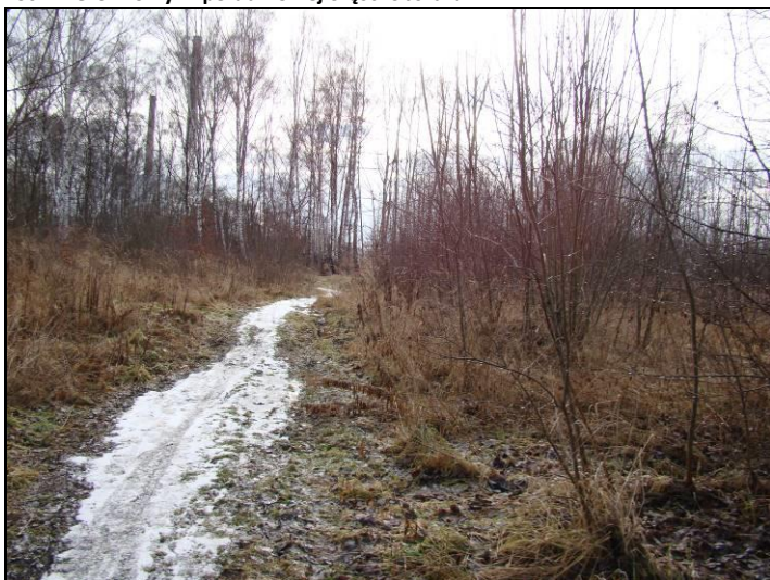
Fot. 2 Teren zadrzewień w południowej części obszaru