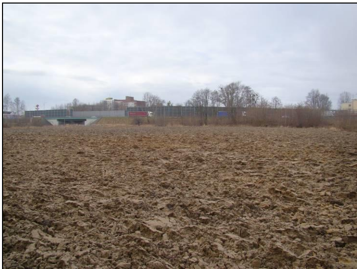
Fot. 1 Teren rolny w południowej części obszaru