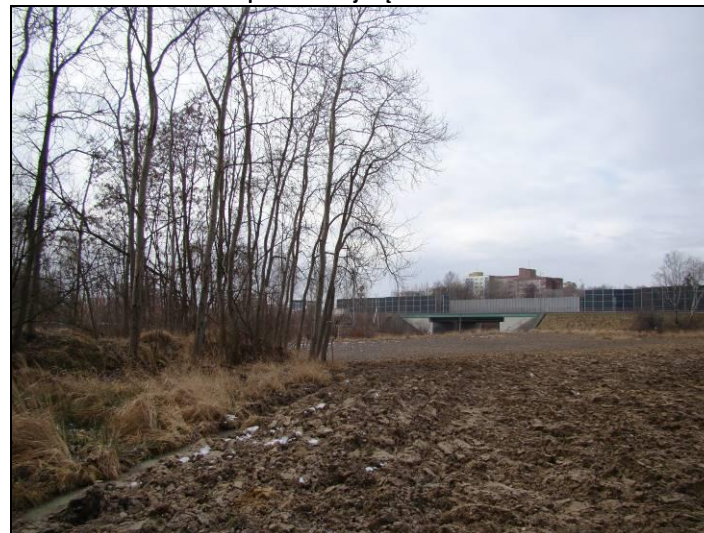
Fot. 4 Teren rolny w południowej części obszaru