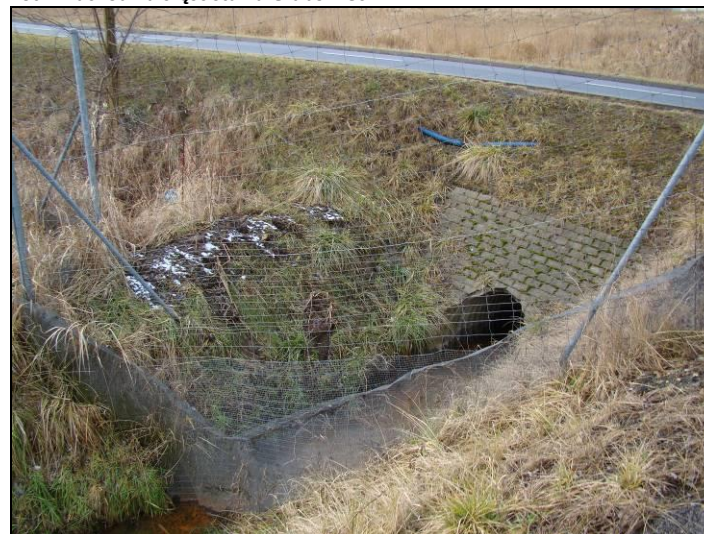
Fot. 8 Wyływ ciekii zasilającego staw Grabowiec spod nowo powstałej ulicy