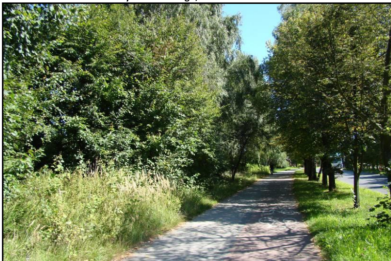
Fot. 6 Zadrzewienia od strony ul. Sikorskiego, widok w kierunku wschodnim