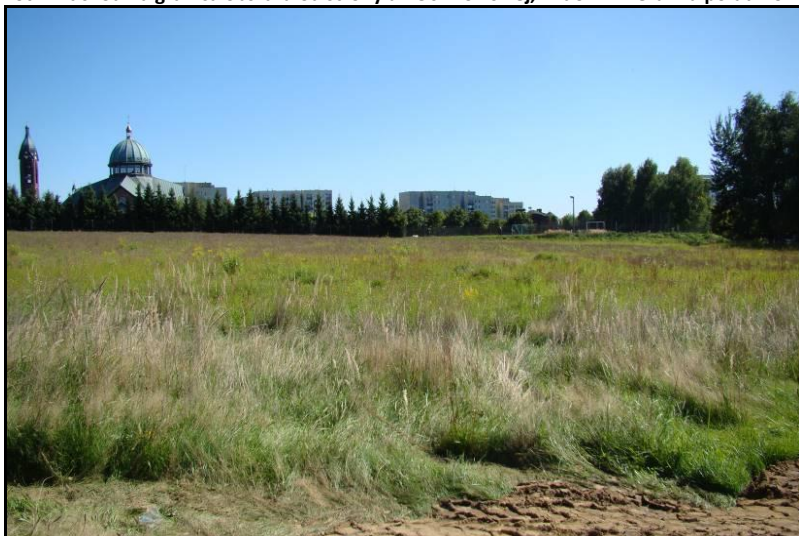
Fot. 2 Centralna część analizowanego obszaru, widok w kierunku wschodnim