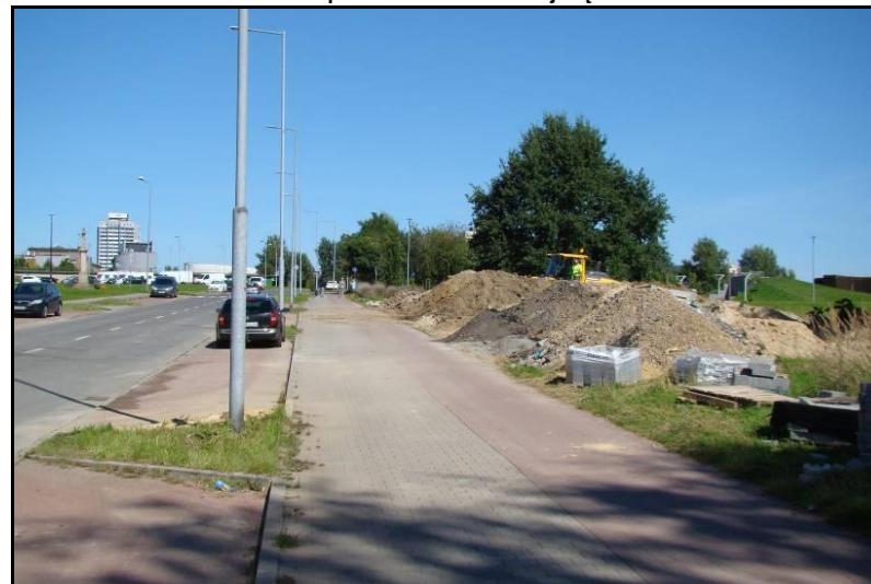
Fot. 8 Zachodnia granica obszaru od strony ul. Uczniowskiej, widok w kierunku północnym