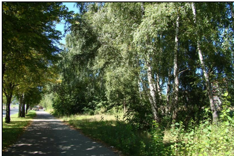
Fot. 5 Zadrzewienia od strony ul. Sikorskiego, widok w kierunku zachodnim