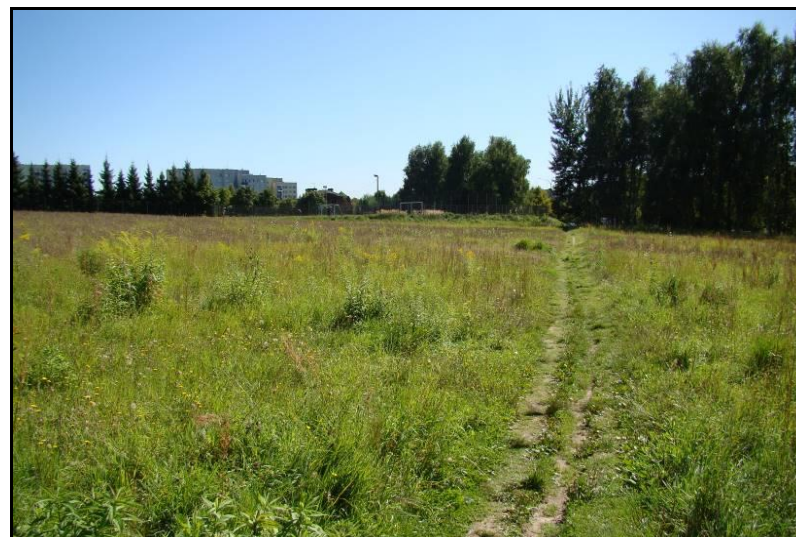
Fot. 3 Widok w kierunku południowo-wschodnim