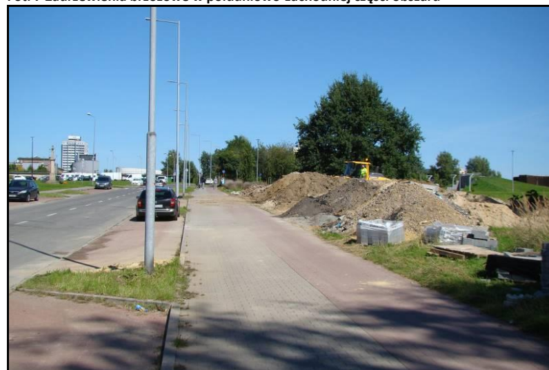
Fot. 8 Zachodnia granica obszaru od strony ul. Uczniowskiej, widok w kierunku północnym