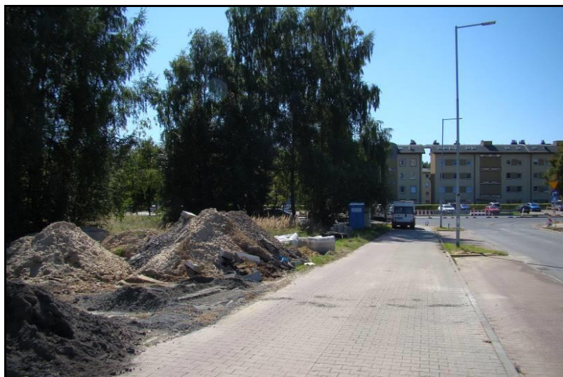
Fot. 1 Zachodnia granica obszaru od strony ul. Uczniowskiej, widok w kierunku południowym