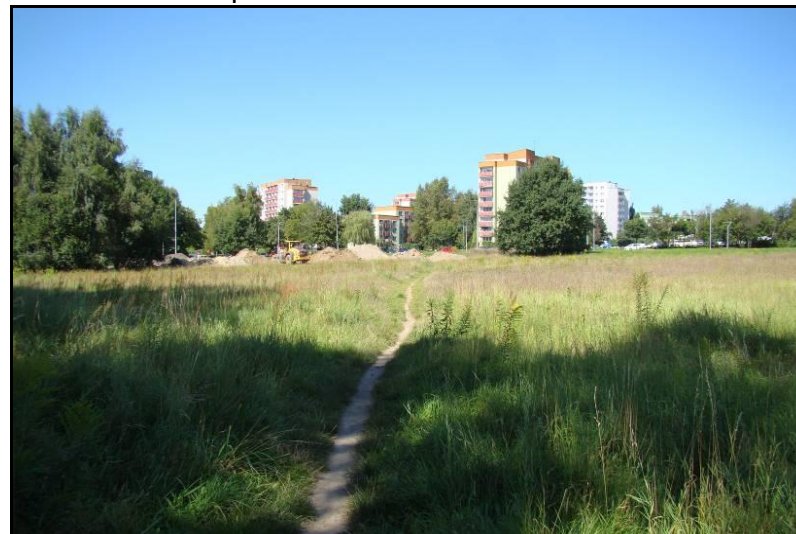
Fot. 4 Widok w kierunku północno-zachodnim