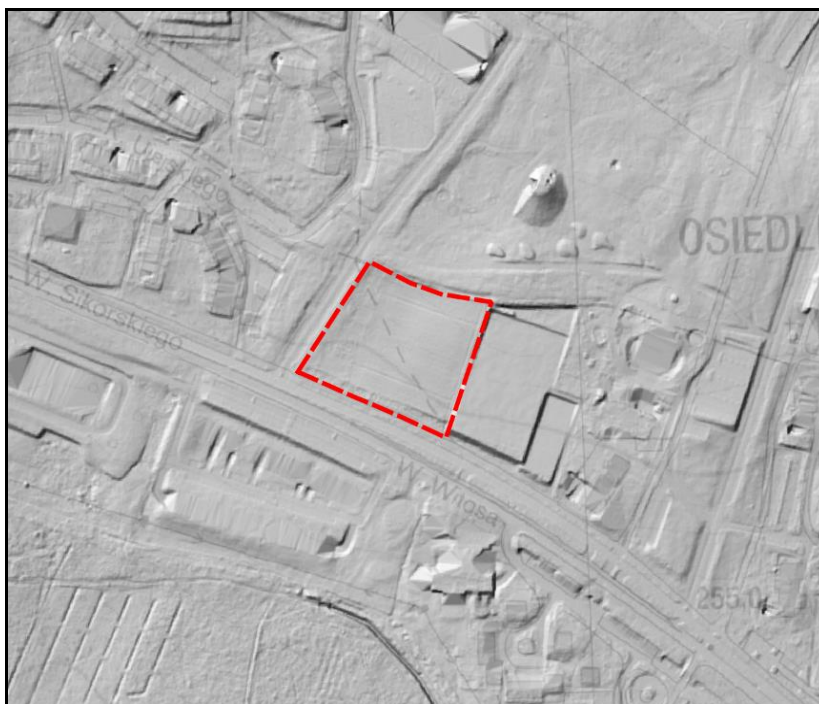
Rysunek 1 Ukształtowanie terenu na podstawie Numerycznego Modelu Terenu