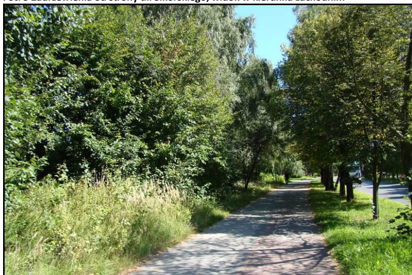
Fot. 6 Zadrzewienia od strony ul. Sikorskiego, widok w kierunku wschodnim