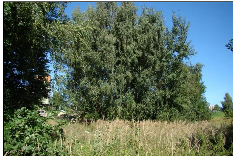
Fot. 7 Zadrzewienia brzoźowe w południowo-zachodniej części obszaru