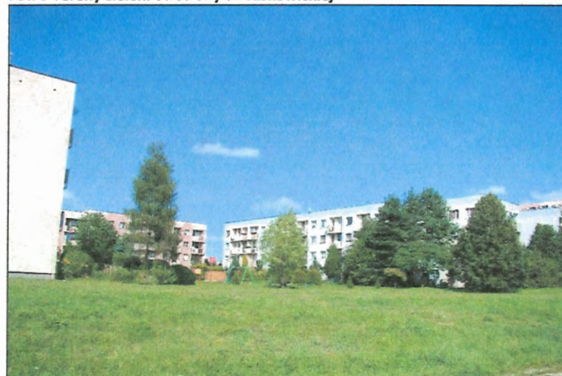
Fot. 4 Tereny zieleni od strony ul. Jaśkowskiej