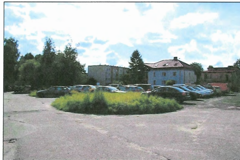
Fot. 7 Parking w rejonie ul. Skalnej