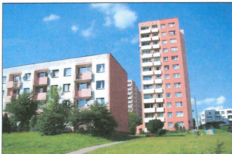
Fot. 1 Analizowany teren od strony ul. Jaśkowskiej