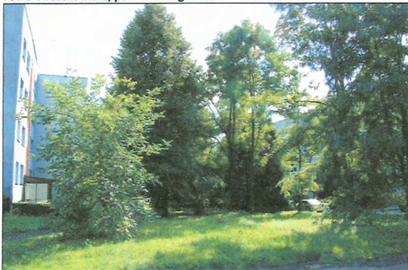
Fot. 6 Teren zieleni w centralnej części obszaru