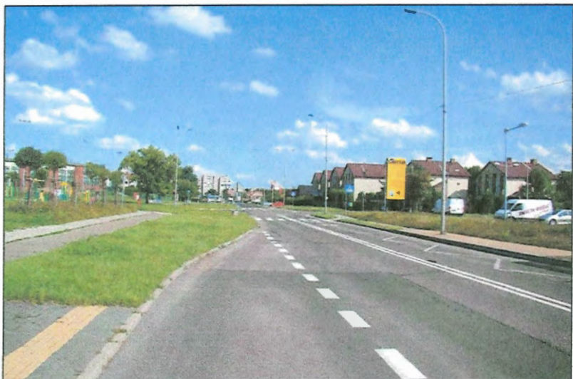
Fot. 5 Ul. Jaśkowicka, południowa granica obszaru