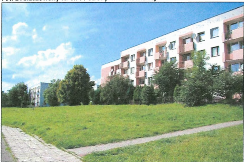
Fot. 2 Jak powyżej