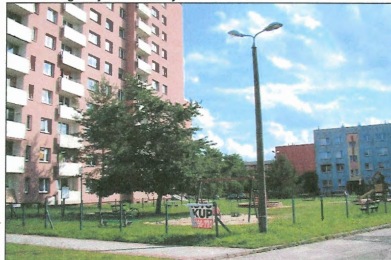
Fot. 8 Widok na osiedle od strony ul. Skalnej