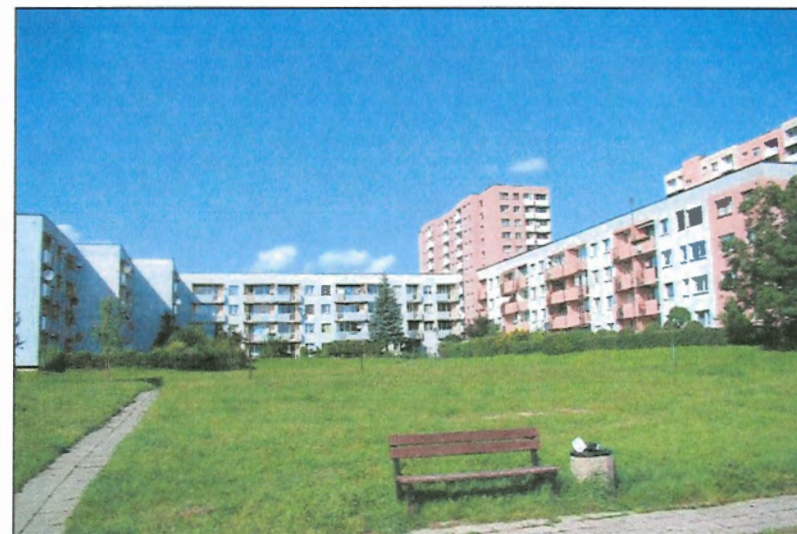
Fot. 3 Tereny zieleni od strony ul. Jaśkowskiej