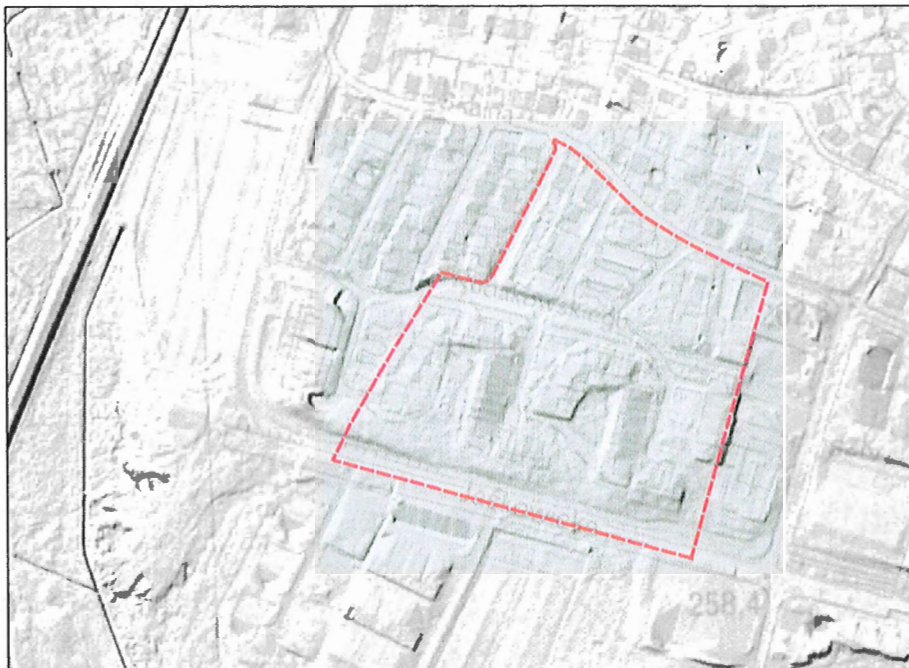
Rysunek 1 Ukształtowanie terenu na podstawie Numerycznego Model Terenu