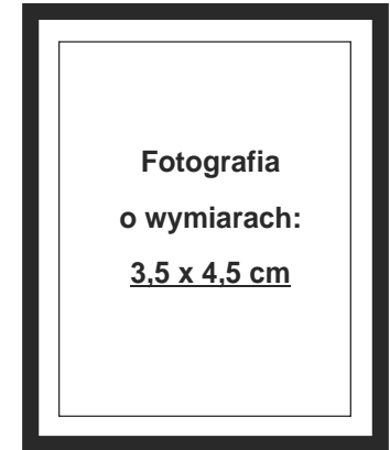
(nie wykracza poza ramki wewnętrzne)