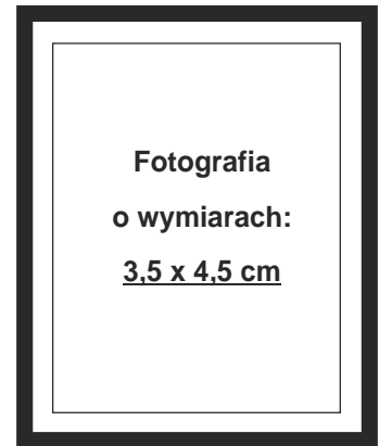
(nie wykracza poza ramki wewnętrzne)